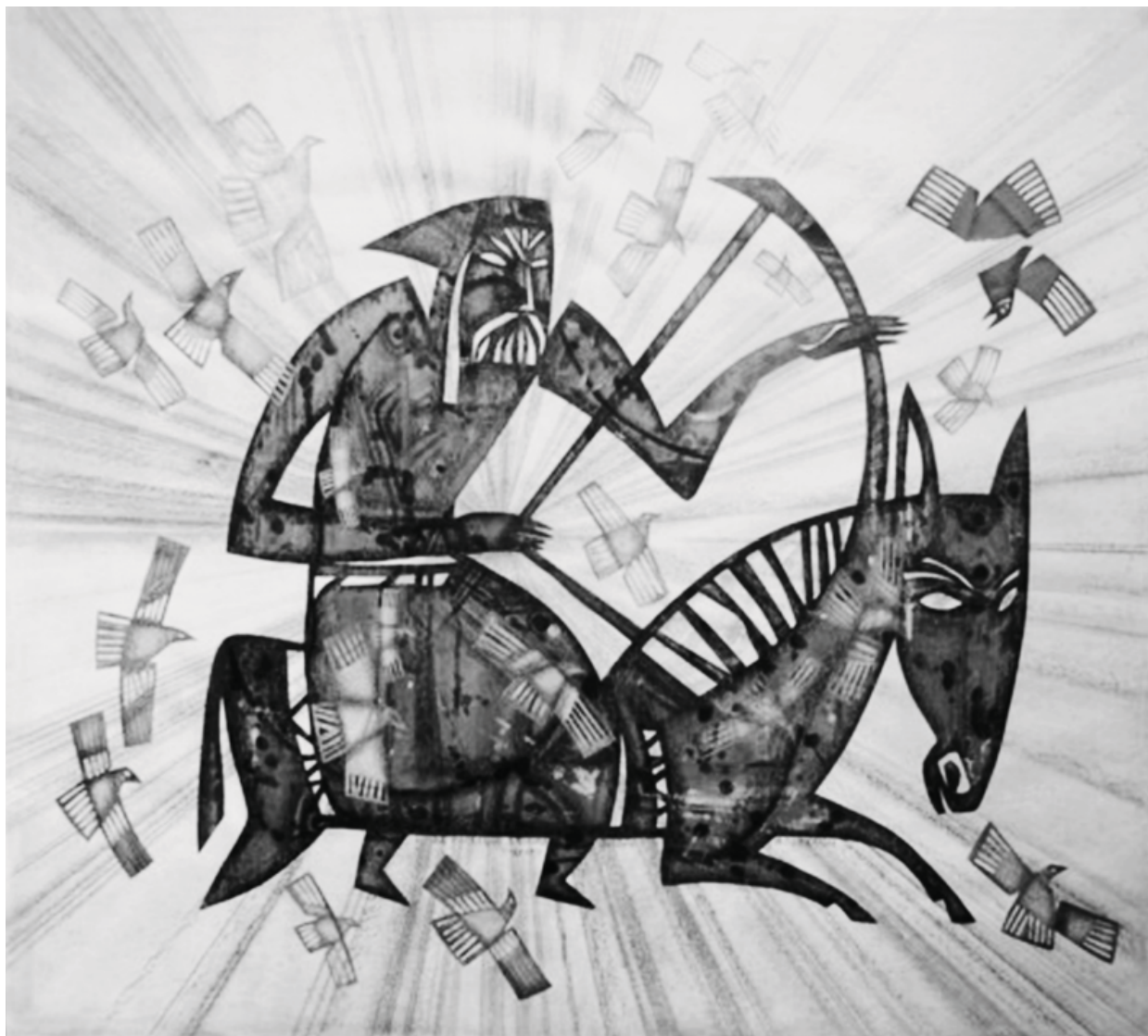
Пушкар'юв Андрій. «На Московію з білими птахами». Папір, витинання, кольорові олівці. 2003 р.

Насичена програма фестивалю дозволила його учасникам відкрити для себе нові сторінки з української історії, культури, спонукала до пошуку нових ідей.