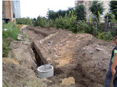
Лл. 16. Каміння та цегла із знищених склепін та фундаментів підземель кам'яниць 1-ї пол. XVII ст.