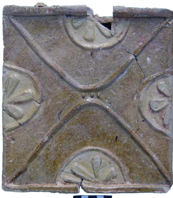
Іл. 3. Кахля 2-ї пол. XVI ст. із символами сонця і дощу.

Перше археологічне підтвердження острозького книгодрукування доби князя В.-К. Острозького?