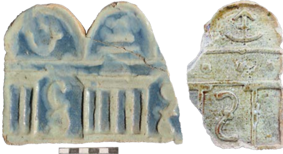
Лл. 12. Керамічні прикраси завершення печі 1-ї пол. XVII ст. з елементами зображень гербів князів Острозьких.