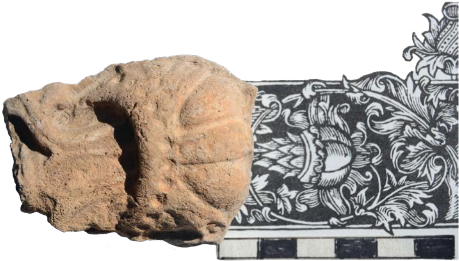
Іл. 5. Фрагмент кахлі 2-ї пол. XVI ст. та гравюра (заставка) з «Апостола» 1574 р.