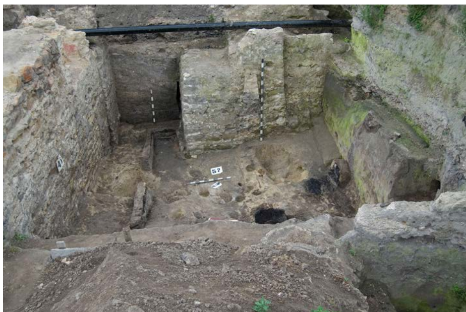
Іл. 11. Долівка об'єкту №57 2-пол. XVI ст. в тайнику якої виявлені чоловічий позолочений та золотий жіночий персні. Об'єкти №45 та №63 — фундаменти кам'яниці та опорного стовпа арки-візду на площу Ринок, 1-ї пол. XVII ст.