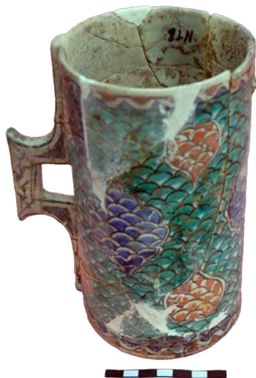
Іл. 10. Кухоль 2-ї пол. XVI ст. Майоліка. Італія.