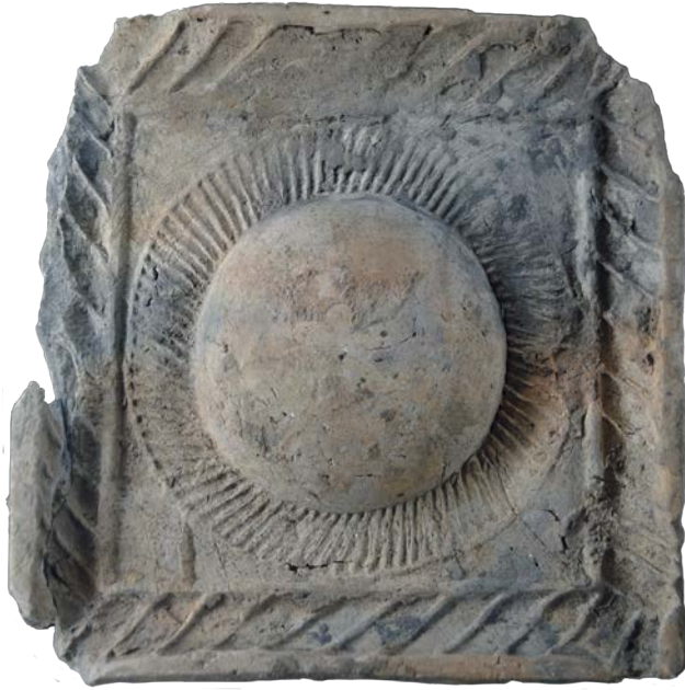
Іл. 1. Кахля 2-ї пол. XVI ст. із символічним зображенням сонця.