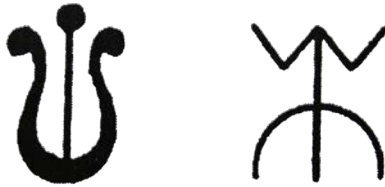
Лл. 13. Герби князя Данила Острозького.