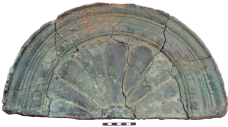
Іл. 6. Сонцеподібне завершення печі (конха) 2-ї пол. XVI ст.