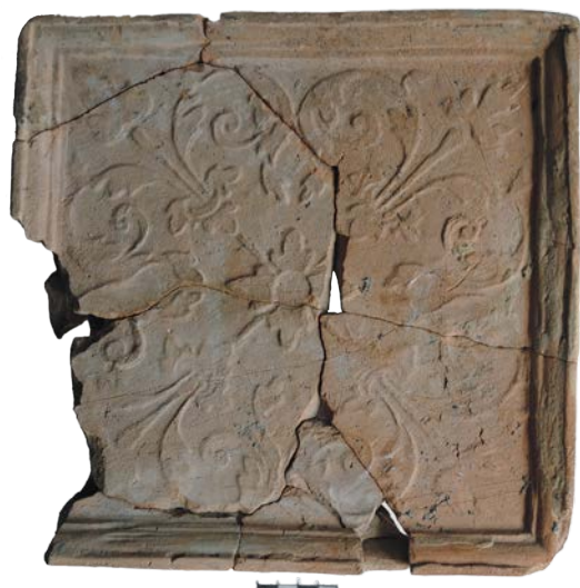
Іл. 9. Кахля 2-ї пол. XVI ст. із центричною композицією з символами сонця і дерева життя.

Перше археологічне підтвердження острозького книгодрукування доби князя В.-К. Острозького?