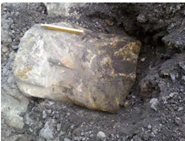
Лл. 17. Архітектурна деталь із стіни підземелля кам'яниці 1-ї пол. XVII ст.