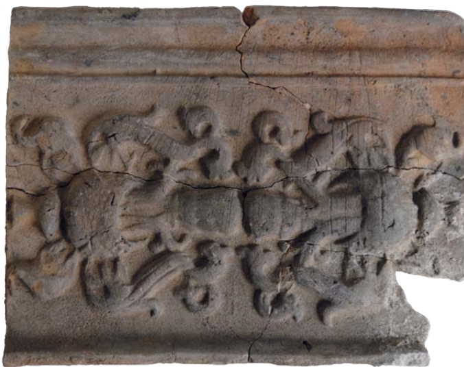
Іл. 4. Кахля 2-ї пол. XVI ст. з орнаментом на мотив гравюри «Апостола» Івана Федорова 1574 р.