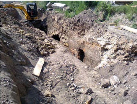
Лл. 15. Руїнування підземель кам'яниць 1-ї пол. XVII ст. при прокладанні комунікацій до нового корпусу Острозької академії. Серпень 2018 р.