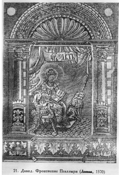
21. Давид. Фронтиспіс Псалтыри (Дрого, 1570)