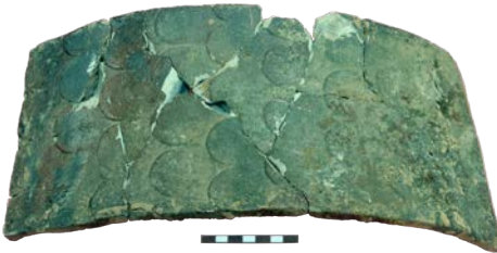
Іл. 8. Дахівка 2-ї пол. XVI ст. - елемент завершення печі.