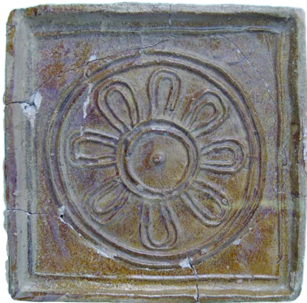
Іл. 2. Кахля 2-ї пол. XVI ст. із символічним зображенням розетки-сонця.