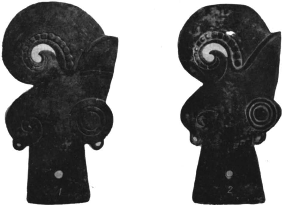
Рис. 1. Бронзові навершя.

2. П'ять ажурних литих блях. Кожна являє собою фантастичну істоту — рогатого левоголового крилатого грифона, зображеного