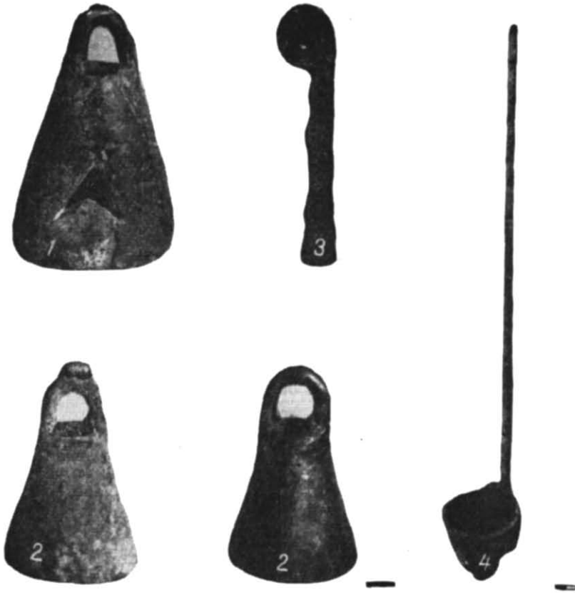
Рис. 4. Бронзові дзвіночки та черпак.

Бронзові наверхня у вигляді спрямованої догори орлиної голівки існують в скіфській культурі на протязі всього скіфського періоду. До найбільш ранніх з них належить наверхня з Краснодарського музею 2 . До кінця VI — початку V ст. до н. е. належать два наверхня з кургану № 2 біля Ульського аулу 3 . Наверхня з с. Розкоївці в Молдавії 4 у ви-