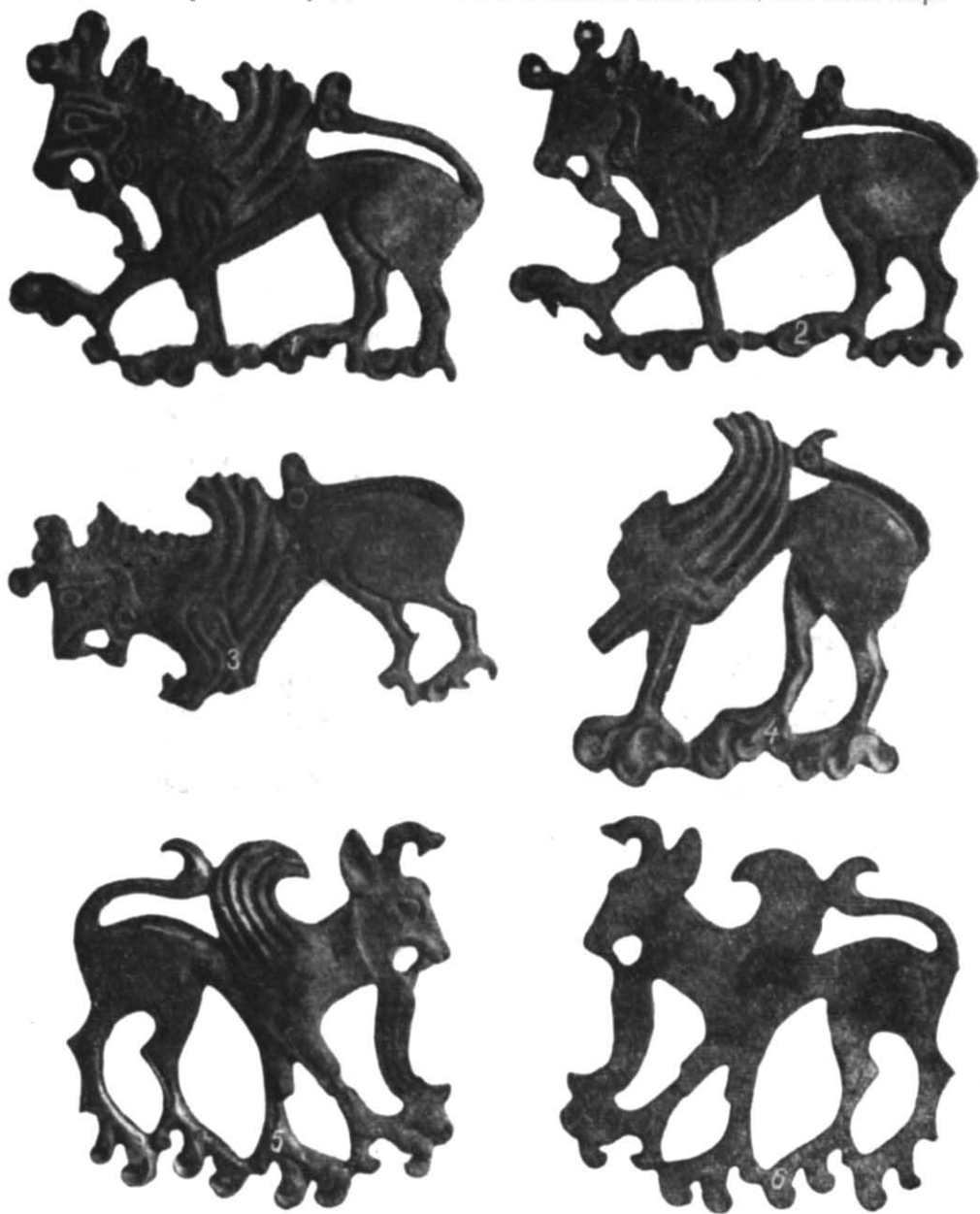
Рис. 2. Бронзові бляхи.

якщо перевернути бляху, зображення водоплавного птаха (качка?) з розкішним хвостом (рис. 3). Мускулясті лапи істоти закінчуються пташиними кігтями. Назустріч двом звитим в кільце переднім пазурам обернений третій. Передні лапи більші від задніх. Загнутий хвіст спря-