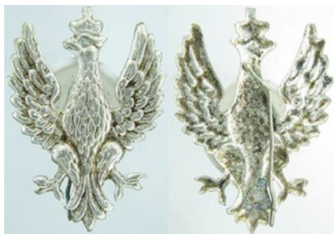
Рис. 21. Кокарда Державної поліції 1919 року. Інв. № МДМ-1431-711. Білий метал. Розмір: 29,77 / 39,11 мм. Sawicki Z. Symbolika polskich organizacji bezpieczeństwa / Sawicki Z. – Warszawa, 2011. – S. 124-133. wzór: 19.

Із проголошенням незалежної Польської республіки у 1919 році було проведено реформу із об'єднання всіх видів міських та регіональних, а також пара-мілітарних правоохоронних та дружинних органів, що утворили Державну Поліцію наказом міністра внутрішніх справ від 24 липня 1919 року. Для носіння на шапках правоохоронців новоутвореної Державної Поліції були виготовлені кокарди у вигляді орла – гербу Польщі (Рис. 21), які вже 3 листопада були відмінені відповідним наказом міністра внутрішніх справ, повністю уніфікувавши кокарди, відзнаки на погонах, гудзики, нашивки та ідентифікаційні жетони і таблички, ввівши також загальнодержавні відзнаки за досягнення: бездоганну довготривалу службу, нагородну особисту зброю, знаки до дипломів, грамоти та інше.