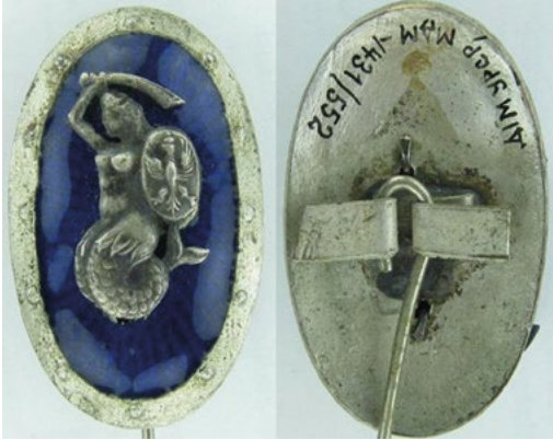
Рис. 1. Кокарда Цивільної гвардії міста Варшави, 1914-1915 рр. для офіцерського складу.

В фалеристичній збірці НМІУ представлені також дві аналогічні кокарди без нанесених емалей, що відрізняються методом кріплення: одна має дві припаяні металеві пластини (Рис. 2), а інша – саморобну голку (Рис. 3).