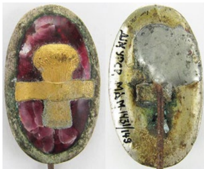
Рис. 8. Відзнака органів приміської міліції м. Варшави. Інв. № МДМ-1431-149. Білий метал, позолота, рожеві емалі. Розмір: 19,3 / 31,2 мм. Sawicki Z. Symbolika polskich organizacji bezpieczeństwa / Sawicki Z. – Warszawa, 2011. – S. 63.

В колекції НМІУ зберігається кокарда приміської міліції міста Варшави (Рис. 8), але має відмінність у виконанні, порівняно із описаною кокардою Здзіславом Савіцькі. Описані дослідником кокарди приміської міліції Варшави мають на полі сині емалі, в той час як відзнака зі збірки НМІУ – рожеві. Можна припустити, що наявний в музейній збірці знак є раніше невідомим та неописаним різновидом. Для уточнення цього припущення необхідно порівняти відзнаку із наявними знаками Приміської міліції в зібраннях інших музеїв та приватних збірках, роботу над чим ми продовжуємо.