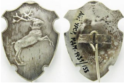
Рис. 15. Відзнака правоохоронних органів Люблінської землі.

Інв. № МДМ-1431-138. Білий метал. Розмір: 24.1/32.3 мм.