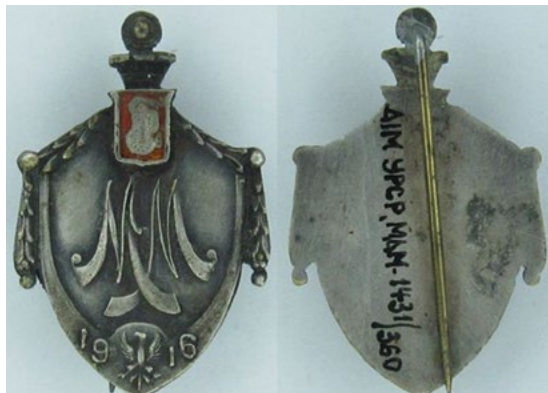
Рис. 9. Почесна відзнака Міської міліції м. Варшави, 1916 рік

гербом міста Варшави у щитку. Відзнаки кріпились за допомогою кільця у вушку у верхній частині знаку, але до аналогічного знаку з колекції НМІУ було саморобним чином припаяно голку для носіння на одягу (Рис. 9).