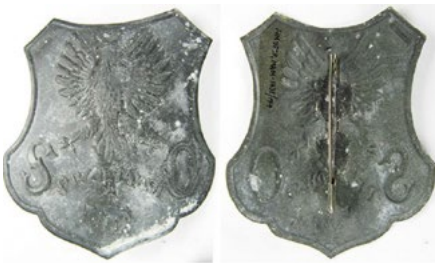
Рис. 18. Відзнака Цивільної гвардії у Перемишлі.

Sawicki Z. Symbolika polskich organizacji bezpieczeństwa / Sawicki Z. – Warszawa, 2011. – S. 319.