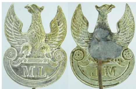
Рис. 20. Кокарда Народної міліції. Інв. № МДМ-1431-708. Білий метал. Розмір: 26,27 / 33,73 мм. Sawicki Z. Symbolika polskich organizacji bezpieczeństwa / Sawicki Z. – Warszawa, 2011. – S. 121-122.

Із поразкою німецької та австрійської армій у Першій світовій війні та роззброєнням їх вояків та отриманою зброєю у ряді міст Польщі було створено Народну міліцію – польською мовою Milicja Ludowa . Перші відділи Народної міліції утворились 18 листопада 1918 року у Радомі, Любліні, Честохові, Пабіяничах, Варшаві, Лодзі та Полоцьку. Перші загони мали емблему із літерами PPS. В той же час у Любліні на народних зборах затверджено утворення власних міліцейських загонів – з такою самою назвою – Milicja Ludowa , тому одночасно діяли дві організації з однаковою назвою. Загони PPS перетворились у більш військову організацію, а Народна міліція у Любліні у поліційну. Декрет про ліквідацію цих установ був підписаний Головою держави у грудні 1918 року і вже 1 липня 1919 року вони були ліквідовані. Для обмундирування органів міліції використовували чорні мундири, на головні убори кріпились різноманітні кокарди, що зображали орлів різного дизайну. Міліцейські гудзики також несли ініціали ML. В збірці НМІУ наявна кокарда Народної міліції з білого металу (Рис. 20).