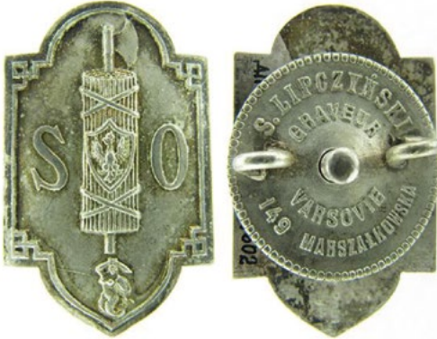
Рис. 6. Відзнака про закінчення курсів кримінального права для Цивільної Гвардії.

Sawicki Z. Symbolika polskich organizacji bezpieczeństwa / Sawicki Z. – Warszawa, 2011. – S. 29, 42.