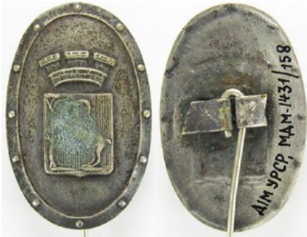
Рис. 13. Відзнака Цивільної міліції у Любліні.

Виробник: Євгеніуш Маріуш Унгер у Львові. Инв. № МДМ-1431-907. Білий метал. Розмір: 18 / 25 мм. Sawicki Z. Symbolika polskich organizacji bezpieczeństwa / Sawicki Z. – Warszawa, 2011. – S. 88-89.