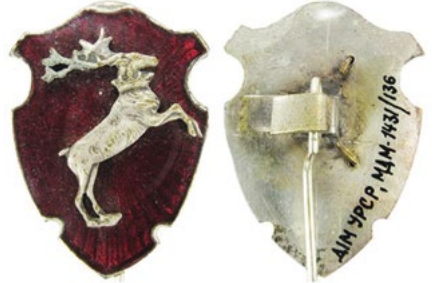
Рис. 16. Відзнака правоохоронних органів Люблінської землі.

Sawicki Z. Symbolika polskich organizacji bezpieczeństwa / Sawicki Z. – Warszawa, 2011. – S. 319.