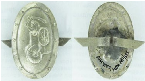
Рис. 2. Кокарда Цивільної гвардії міста Варшави, 1914-1915 рр. для рядового складу.