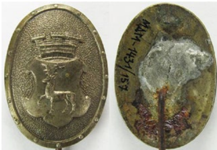
Рис. 19. Відзнака Цивільної гвардії міста Седлець.

Stela W. Polskie odznaki honorowe i pamiątkowe 1914-1918&1918-1921 (wojny o granice państwa). – Warszawa, 2001. – S. 65. – № 7.24.