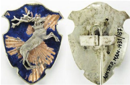
Рис. 17. Відзнака правоохоронних органів Люблінської землі.

Sawicki Z. Symbolika polskich organizacji bezpieczeństwa / Sawicki Z. – Warszawa, 2011. – S. 319.