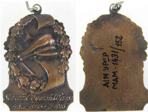
Рис. 7. Пам'ятний медальйон Цивільної гвардії у м. Варшава, 1916 рік

Варшавським медальєром Вінцентієм Вішневські були створені хрести з емаллями і відзнаки-медальйони, що видавались гвардійцям Цивільної гвардії на пам'ять про службу в цій організації. Пам'ятні медальйони Цивільної гвардії відомі у виконанні зі срібла, посріблені та бронзові. Несуть на своєму полі зображення поліцейської кепки у вінку із дубового листа, назву організації Straz Obywatelska та дати її функціонування 4.VIII.1915 – 1.II.1916 рр. В збірці фалеристики НМІУ збережено бронзовий пам'ятний медальйон Цивільної гвардії (Рис. 7).