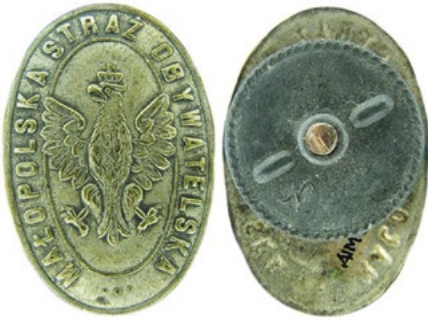
Рис. 11. Відзнака Малопольської цивільної гвардії, або Миської міліції Кракова.

Инв. № МДМ-1431-621. Білий метал, посріблення. Розмір: 22,9/33,8 мм, гайка діаметром 21,2 мм. Кріплення у вигляді гайки, що накручується на штифт. Sawicki Z. Symbolika polskich organizacji bezpieczeństwa / Sawicki Z. – Warszawa, 2011. – S. 81. Stela W. Polskie odznaki honorowe i pamiątkowe 1914-1918&1918-1921 (wojny o granice państwa) . – Warszawa, 2001. – S. 65. – № 7.23.