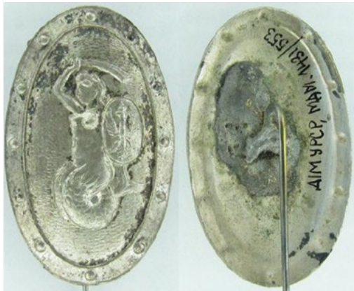
Рис. 3. Кокарда Цивільної гвардії міста Варшави, 1914-1915 рр. для рядового складу.