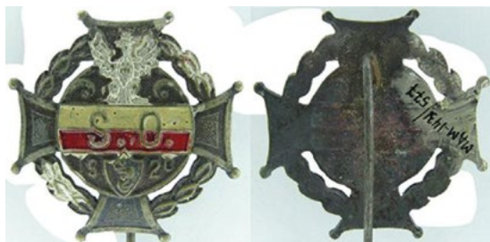
Рис. 10. Пам'ятна відзнака Цивільної Гвардії у Варшаві, 1920 рік.

До вшанування Цивільної гвардії були також випущені пам'ятні хрести, що несли на своєму полі зображення гербу Варшави та Польщі, ініціали SO (Цивільна гвардія) та рік 1920. За даними Здзіслава Савіцьки існували два різні типи пам'ятних хрестів Цивільної гвардії 1920 року, в тому числі з червоно-білими емаллями та без них. В колекції НМІУ зберігається хрест з лавровим вінком з емаллями (Рис. 10). Вартим окремої уваги також є факт того, що упорядники каталогу VII аукціону «La Galerie Numismatique», що пройшов у Лондоні 26 вересня 2005 року, визначили цей знак як приналежний до Варшавської офіцерської школи, трактуючи ініціали SO як «Szkoła Oficerska», але при тому вказавши також про його приналежність до Цивільної гвардії. Підтримує віднесення відзнаки до Цивільної гвардії і польський фалерист Войцех Стела. Ми вважаємо, що точна ідентифікація цієї відзнаки та правильне розшифрування абрєвіатури буде можливо з пошуком пов'язаних з цим знаком архівних документів: наказів на створення та виготовлення, проекти ескізів, тощо.