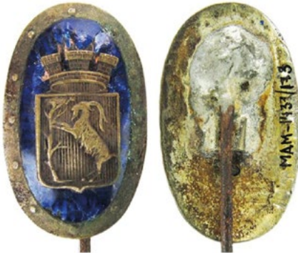
Рис. 14. Відзнака Цивільної міліції у Любліні.

Инв. № МДМ-1431-158. Білий метал. Розмір: 21,0 / 32,7 мм. Sawicki Z. Symbolika polskich organizacji bezpieczeństwa / Sawicki Z. – Warszawa, 2011. – S. 92-93.