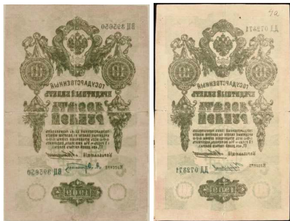
Рис. 6. Фальшивий кредитний білет вартістю 10 рублів випуску 1909 року.

Із зростанням витрат на ведення війни, потреба у грошовій масі стрімко збільшувалась, що спонукало уряд Російської імперії до суттєвого збільшення емісії паперових грошей, які повністю заповнили грошовий обіг.