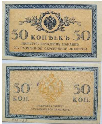
Рис. 5. Російська імперія, 50 копійок 1915 року.

Ще напередодні Першої світової війни гроші майбутнього супротивника – Російської імперії, виготовлялись у Німеччині та Австро-Угорщині. Міністр Юстицій Щегловітов повідомляв у листі директору Департаменту поліції Джунковському про те, що «...получили распространение государственные кредитные билеты 500-рублевого достоинства, отпечатанные на специально приготовленной бумаге с водяным знаком, тем самым способом, который применялся исключительно Экспедицией заготовления государственных бумаг и считался до сих пор безусловно обеспечивающим государственные кредитные билеты от подделок» 3 .