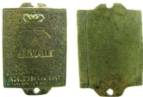
Рис. 15. Друкарське кліше для підробки розмірних марок номіналом 50 шагів. Знайдено в околицях міста Кам'янець-Подільський. Приватне зібрання м. Вишгород.

У контексті свідчень С. Шрамченка про часте виявлення підроблених грошей у вигляді марок номіналом у 50 шагів в околицях Кам'янця-Подільського, особливо цікавою є половина друкарської матриці, випадково знайденої місцевими краєзнавцями в тому ж районі (Рис. 15). Вага матриці – 10,5 грама, розмір – 23 / 34 міліметрів. Виготовлена з металу жовтого кольору, імовірно за все – бронзи. Робоча сторона матриці містить гравійоване гострими інструментами (різцями, штихелями) зображення, що з високим ступенем передає малюнок марки номіналом у 50 шагів. Враховуючи те, що другу половину матриці знайдено не було, ми не можемо виключати, що нею виготовлялись фальшиві саме поштові марки, а не гроші. Але враховуючи те, що марки номінальною вартістю 50 шагів найчастіше слугували для фальшивомонетників прототипом для підробки, можна із високим ступенем імовірності стверджувати, що даний інструмент використовувався для підробки грошей. При візуальному огляді видно, що зображення рослинних орнаментів має суттєві розбіжності із малюнками орнаментів на марках державного виробництва, нерівною є висота літер. Верхня та нижня бокові частини матриці мають вушка із отворами, якими здійснювалось з'єднання половин матриці між собою. Вушко у верхній частині пошкоджене. Скоріше за все, друга половина цього агрегату фальшивомонетників мала аналогічні засоби кріплення, що з'єднувалися між собою гвинтами. Написи на робочій