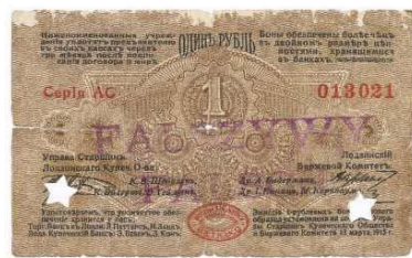
Рис. 11. Фальшивий рубль міста Лодзь, 1915 рік.