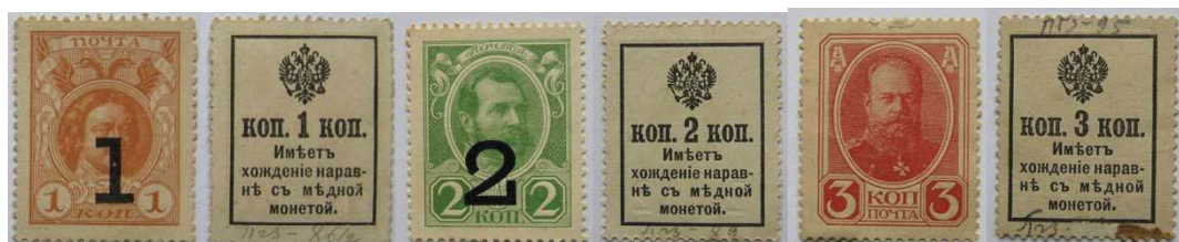
Рис. 2. Розмінні марки замість мідних російських монет. 1 копійка із наддруком «1» 9 , 2 копійки із наддруком «2» 10 , 3 копійки 11 .

Розмінні марки виготовлялись з міцного картону типографським методом із подальшим нанесенням зубцювання за допомогою перфораційної машини. Майже повна відсутність засобів захисту від підробок створювала сприятливі умови для приватних осіб щодо виготовлення їх підробок.