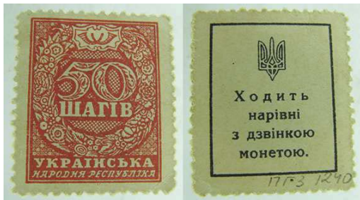
Рис. 14. 50 шагів 1918 року державного друку. м. Київ, «Типографія В. С. Кульженка».