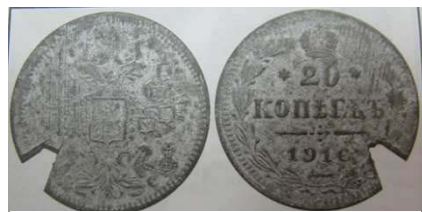
Рис. 8. Фальшиві 20 копійок з датою «1916» із погашенням.

Зразки фальшивих монет та банкнот, які є німими свідками подій Першої світової війни відомі і на колекційному ринку. Відомий нумізматичний аукціон «Gabinet Numismatyczny D.Marciniak» декілька разів виставляв у продаж підробки: