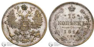
Рис. 9. Фальшиві 15 копійок 1914 року. Вага: 2,53 г.

15 копійок 1914 року (Рис. 9) 1 , 50 польських марок 1916 року (Рис. 10) 2 , а також фальшивий рубль для міста Лодзь 1915 року (Рис. 11) 3 .