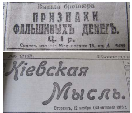
Рис. 17. Повідомлення про випуск спеціальної брошури із методикою розпізнавання фальшивих грошей. Газета «Киевская мысль», 1918 рік.