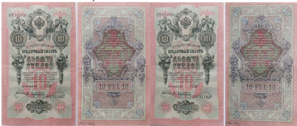
Рис. 7. Російська імперія, 10 рублів 1909 р., ПЧ 971828 4 , ПЧ 971827 5