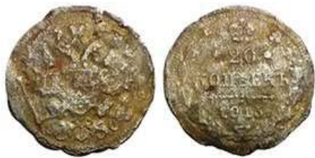
Рис. 12. Підробка монети 15 копійок 1915 року. Знайдено у Полтавській області, вага 1,79 грама, виготовлена методом покриття тонким шаром срібної фольги.

наводячи приклади фактів підробки рублевих монет, зафіксованих в архівах та дореволюційних газетах, А. Бойко-Гагарін зафіксував факти підробки грошей протягом всього часу правління останнього російського монарха 1 .