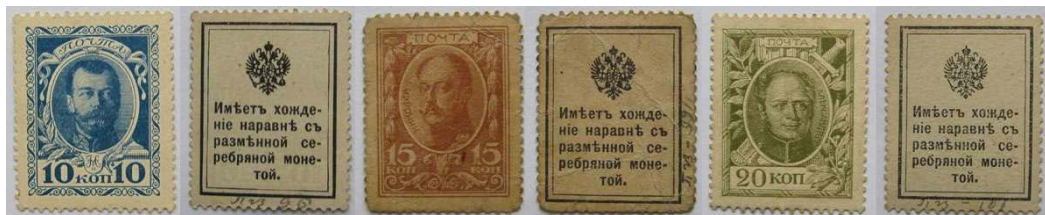
Рис. 1. Розмінні марки замість срібних російських монет. 10 копійок 6 , 15 копійок 7 та 20 копійок 8 .

Вже 29 вересня 1915 р. було опубліковано відповідне розпорядження Міністра фінансів: «О выпуске в обращение разменных марок» 4 , в якому згадувалось про випуск не лише розмінних марок номіналом 20, 15 та 10 копійок замість срібних монет (Рис. 1), а також і номіналів 3, 2 та 1 копійка замість мідних (Рис. 2). На виконання цього розпорядження від 18 листопада 1915 р. Державний Банк (відділ кредитних білетів) розіслав всім своїм конторам та відділенням лист № 55/а під грифом «таємно» – «О разменных марках 1, 2 и 3 коп. дост. На случай выпуска их в обращение наравне с медной монетой» 5 .