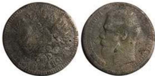
Рис. 13. Підробка монети 1 рубль 1897 року. Знайдено у Львівській області, вага 16,51 грама, виготовлено з олова. Приватна колекція, м. Київ.