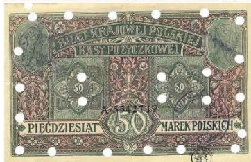
Рис. 10. Фальшиві 50 марок 1917 року, Регентське королівство Польське