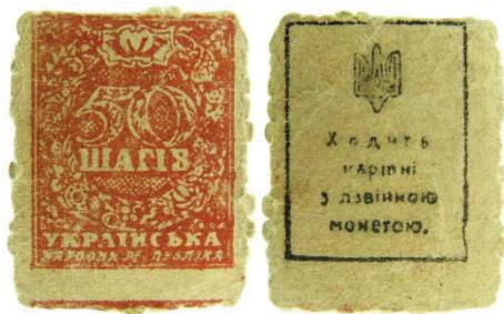
Рис. 16. Тогочасна підробка 50 шагів.

Таким чином, підсумовуючи проведені дослідження, можна зробити висновок про те, що в Україні у роки Першої світової війни практично всі грошові знаки, які перебували грошовому обігу підроблялись приватними особами з метою незаконного прибутку. Також в Україні набули поширення фальсифікати російських грошей, виготовлених у Німеччині та Австро-Угорщині у якості економічної диверсії стосовно Російської імперії. В останній рік Великої війни в Україні набули широкого поширення підробки грошей, емітованих українськими урядами.