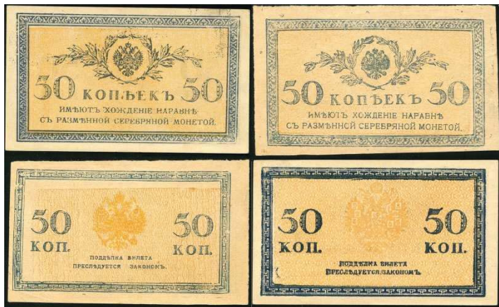
Рис. 4. Підробки для обігу казначейських знаків 50 копійок 1915 р.

Підробки вищезгаданих казначейських знаків нам вдалося зафіксувати у приватних колекціях в м. Києві (Рис. 4), а факти їх фальсифікації оприлюднила на своїй сторінці газета «Крымский Вестник» від 8 травня 1916 року: «Поддельные боны. В молочную лавку в Новой Деревне в Петрограде вошли двое неизвестных, которые, купив хлеба, дали в уплату 50-копеечный бон. Рассматривая деньги, приказчик заметил несоответствие их с действительными бонами. Едва неизвестные вышли из лавки, приказчик, бросившись за ними, задержал их и доставил в участок. При обыске у них была обнаружена пачка поддельных 50-копеечных бонов. Чины сыскной полиции отправились на квартиру неизвестных и обнаружили целую организацию, занимающуюся поддеокй бумажных бонов. Все арестованные в числе пяти человек были доставлены в сыскную полицию» 1 . Порівнюючи вивчені підробки казначейських знаків із оригінальними, що зберігаються в колекції Національного музею історії України (Рис. 5) 2 , можна виявити суттєві відмінності в якості паперу, нанесених фарб, відхилення в дрібних деталях малюнка, особливо малого герба Російської імперії, а також цифр позначення номіналу.