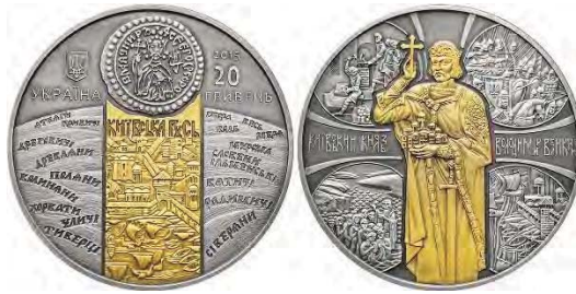
20 гривень 2015 року «Київський князь Володимир Великий»

Світове українство у 2015 році відзначило 1000-ліття успіху великого князя київського – Володимира Святославича. 20-гривнева монета «Київський князь Володимир Великий» нагадує світу про те, що Володимир Святий – великий князь київський та хреститель України-Руси, а не держави-агресора, яка намагається вкрасти нашу історію.