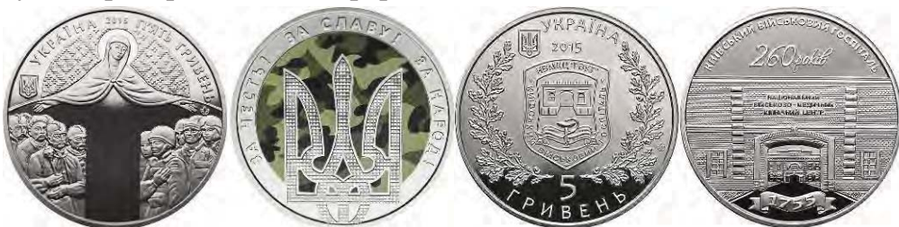
5 гривень 2015 року «День захисника України. За честь! За Славу! За Народ!»

Поранених бійців, які боронили українські кордони, лікують кращі лікарі, не стоїть осторонь і столичний військовий шпиталь, який 2015 року відзначив свій ювілей. На пам'ятній монеті номіналом 5 гривень «260 років Київському військовому госпіталю» – зображення в'їзної брами госпіталю, що розташувався свого часу на території Київської фортеці.