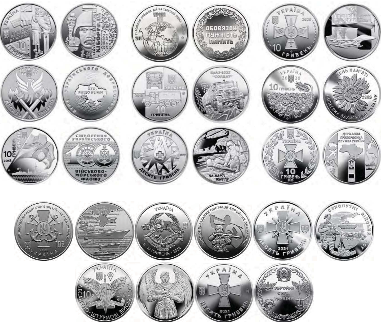
10-гривневі монети 2018 – 2022 років на честь Збройних Сил України

Військова тематика в комеморативному карбуванні України збагачується спеціальною військовою серією 10-гривневих монет, виготовлених зі сплаву на основі цинку. Перша така монета була випущена в обіг у 2017 році та присвячена «Захисникам Донецького аеропорту». У 2018 році серію продовжили монети: «День українського добровольця», «100-річчя створення Українського військово-морського флоту». Наступний 2019 рік став роком випуску монет-присвят: «На варті життя (присвячується військовим медикам)», «КрАЗ-6322 «Солдат», «Учасникам бойових дій на території інших держав», «Повітряні Сили Збройних Сил України», «День пам'яті полеглих захисників України», «Державна прикордонна служба України», «Десантно-штурмові війська Збройних Сил України», «Збройні Сили України», «Сухопутні війська Збройних Сил України».