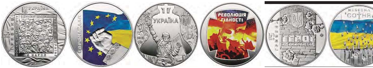
5-гривневі монети 2015 року, присвячені Революції Гідності 2014 року

Світове українство у 2015 році відзначило 1000-ліття успіху великого князя київського – Володимира Святославича. 20-гривнева монета «Київський князь Володимир Великий» нагадує світу про те, що Володимир Святий – великий князь київський та хреститель України-Руси, а не держави-агресора, яка намагається вкрасти нашу історію.