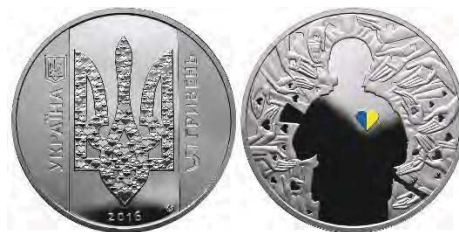
5 гривень 2016 року «Україна починається з тебе»

Успішна боротьба за державність неможлива без внеску кожного з нас. Саме про це кожному громадянину України символічно нагадує 5-гривнева монета 2016 року «Україна починається з тебе».