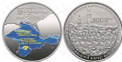
5 гривень 2017 року «100-річчя першого Курултаю кримськотатарського народу»

Політичні реалії збройної агресії росії проти України докорінно змінює тематичне спрямування ювілейних та пам'ятних монет. Окрім військової тематики набуває особливої актуальності тема злочинів радянського режиму та російського уряду проти кримських татар. Пам'ять про депортованих татар ушановується 5-гривневою та 20-гривневою монетами: «Пам'яті жертв геноциду кримськотатарського народу». 2017 року вводяться в обіг 5 гривень «100-річчя першого Курултаю кримськотатарського народу». У 2018 році кримську тематику продовжила 2-гривнева монета «100-річчя Таврійського національного університету імені В. І. Вернадського».