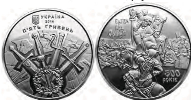
5 гривень 2014 року «500-річчя битви під Оршею»

Із початком гібридної війни росії проти України та окупації частини її території на Сході у 2014 році весь світ побачив справжнє обличчя путінського режиму. Свідома світова спільнота відразу сформуvala попит на нумізматичну продукцію, присвячену військовим подіям, що результували б поразку росіян на полі бою. Першою такою монетою стали 5 гривень «500-річчя битви під Оршею» 2014 року. Перемога в Оршанській битві 1514 року зупинила наступ військ великого князя московського Василя III Івановича і мала велике міжнародне значення. Армія Великого князівства Литовського на чолі з князем Костянтином Острозьким складалася з польських, литовських, українських і білоруських військ.