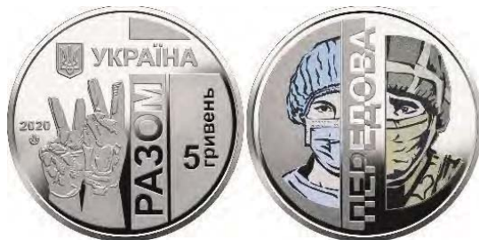
5 гривень 2020 року: «Передова»

Пам'ятною монетою року 2020 на тлі світової пандемії вірусу SARS COV-19 та продовження гібридної війни росії проти України стає монета «Передова». На реверсі 5 гривень зображено бійців військового та медичного «фронтів», які відважно борються з видимим та невидимим ворогом.