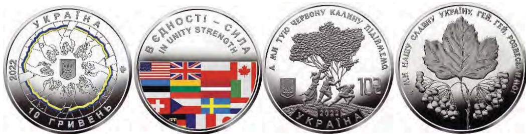
10 гривень 2022 року «В єдності – сила!»

Серія 10-гривневих монет військової тематики поповнилася випусками: «Військово-морські Сили Збройних Сил України», «Сили спеціальних операцій Збройних Сил України». Нумізматичній спільноті монети цієї серії також пропонуються у колекційному наборові з дев'яти пам'ятних монет спеціальних випусків серії «Збройні Сили України» 2018 – 2020 років.