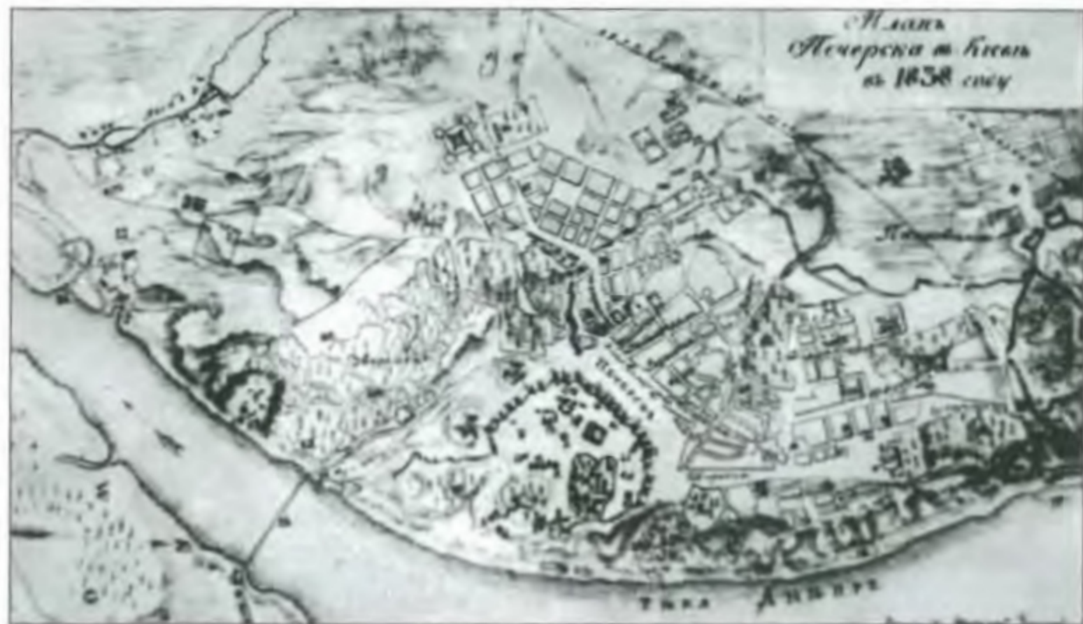
План Печерська. 1838 р.

нених мало бути завдовжки 40 і за- вирши 30 сажнів. Кріпилася будів- ля на соснових стовпах, стіни сплі- тали з лози на дубових кілках і обма- зували глиною всередині й знадвору. Долівка була глиняна і гарно висуше- на. Приміщення планували на 3 від- діли, в кожному з яких мали постави- ти 30 ліжок 12 .