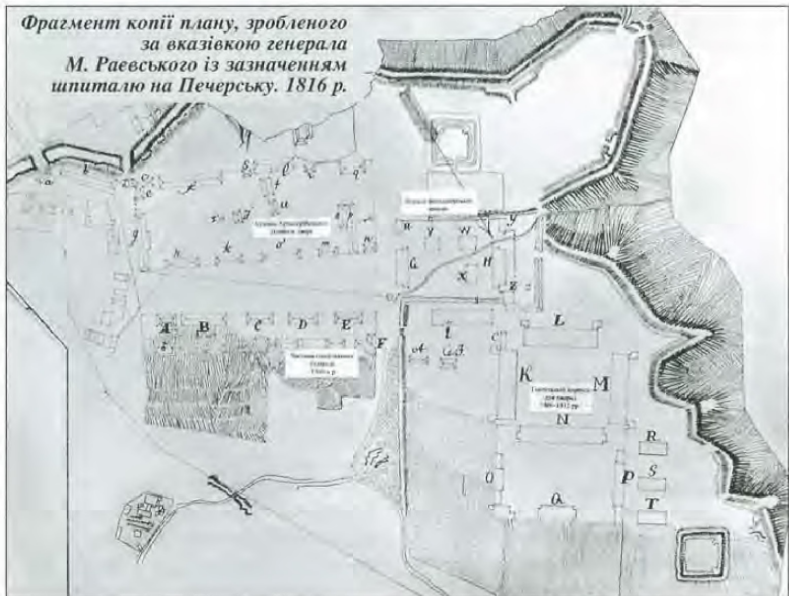
Фрагмент копії плану, зробленого за вказівкою генерала М. Раєвського із зазначенням шпиталю на Печерську. 1816 р.

У 1826 р. влаштовано два басейни для водозбору, а наступного продовжено ремонт підлоги. Того ж, 1827 року київський купець 2-ї гільдії Сергій Терехов вирішив допомогти військовому відомству, зголосившись збудувати лазню й колодязь для військових кантоністів, що мешкали в одному з флігелів фельдмаршала О. Прозоровського. План і кошторис було доручено скласти міському архітекторові Андрієві Меленському 8 . Восени роботи завершилися. Будівництво коштувало купцеві 5 тис. крб. За цей шляхетний учинок Сергій Терехов одержав „монарше благовоління” від Миколи I 9 .