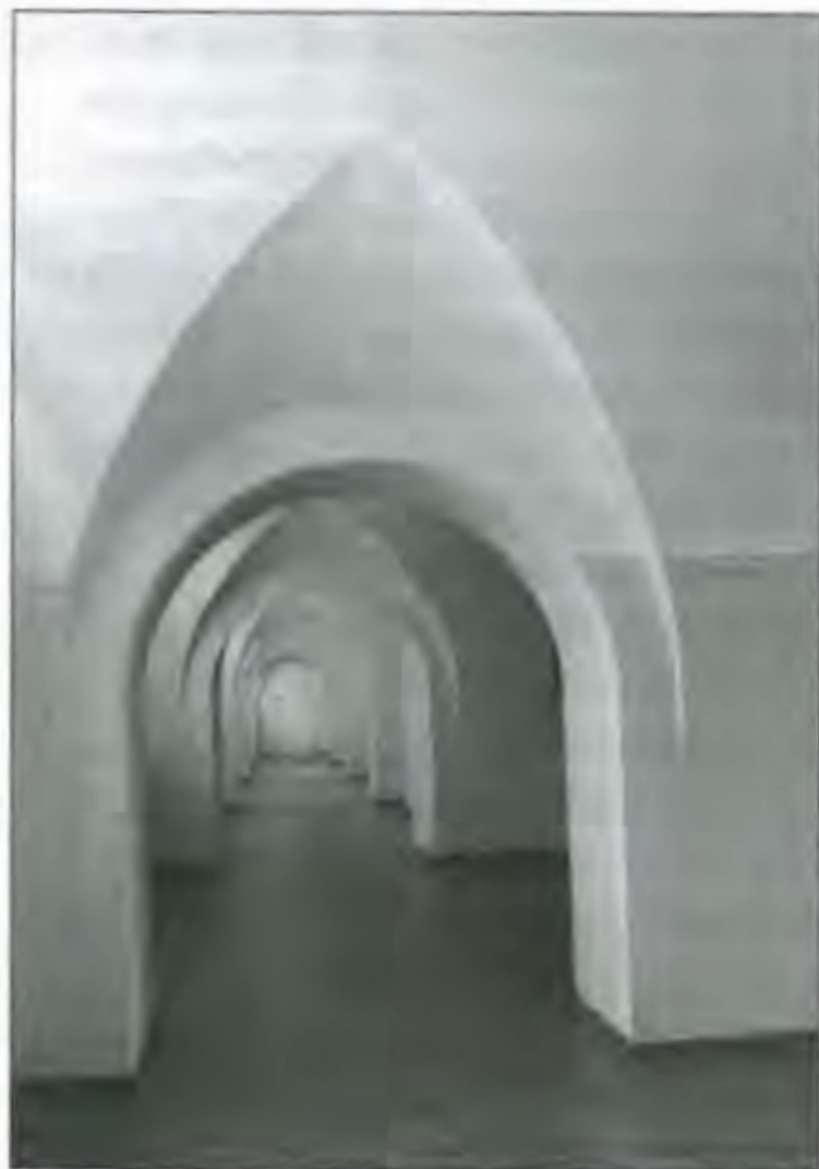
Анфілада приміщень у П-подібному корпусі

а важкохворих направляли в шпиталь на Печерську. Такою була вказівка головного медика дієвої армії надвірного радника Р. Четиркіна, який відвідав шпиталь у 1836 р. До думки цього чільного військово-медичного адміністратора, голови військово-медичного комітету прислухалися не тільки головні лікарі шпиталів, а й головнокомандувач дієвої армії генерал-фельдмаршал І. Паскевич 47 . Допомогала військовому відомству в розміщенні недужих будівельників міська влада, запропонувавши в разі потреби використовувати три великі будинки на Подолі – титулярного радника Сухоти, Киселівського й Чарковського 48 .