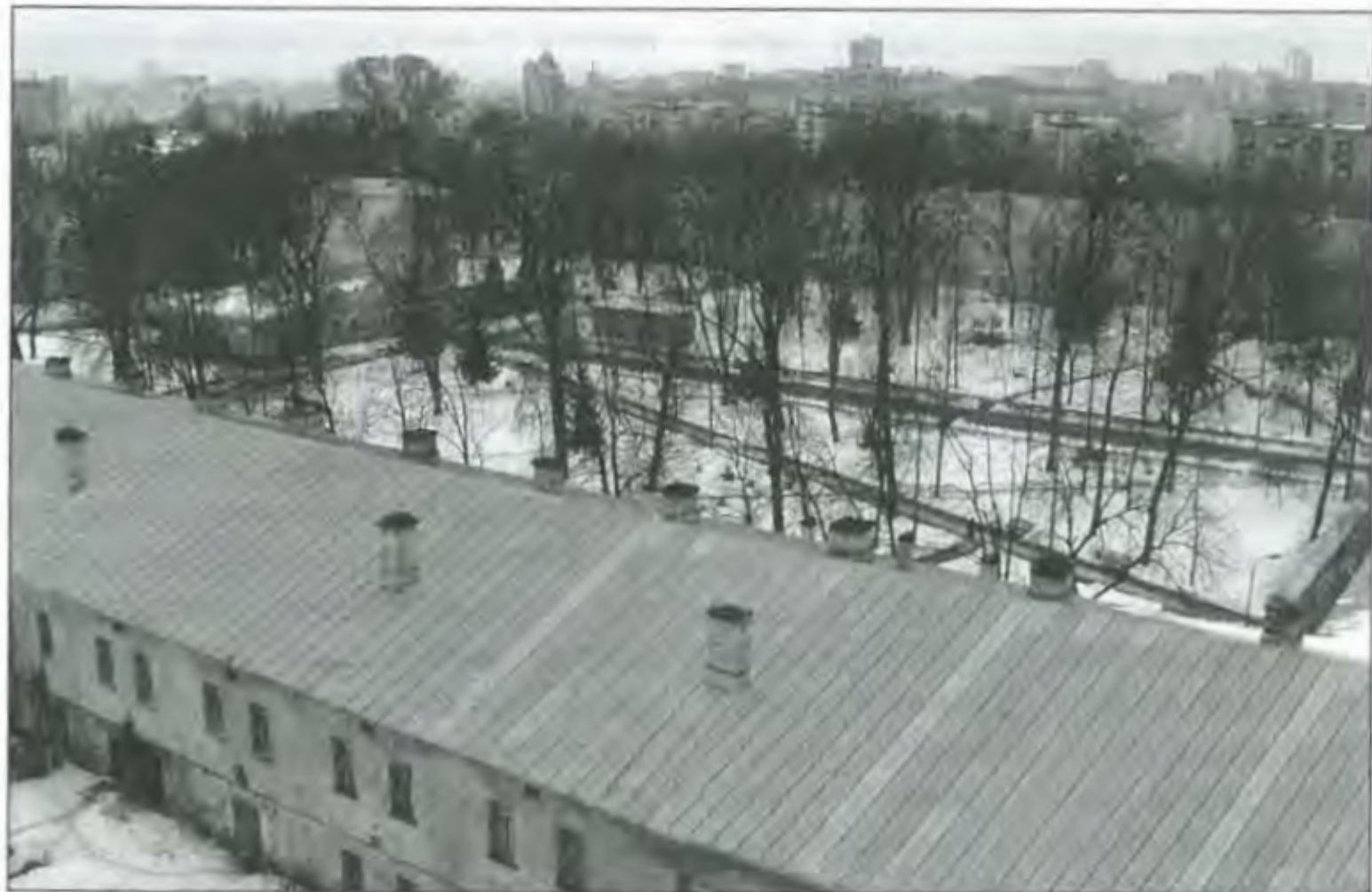
Частина правого П-подібного шпитального корпусу. Сучасна світлина