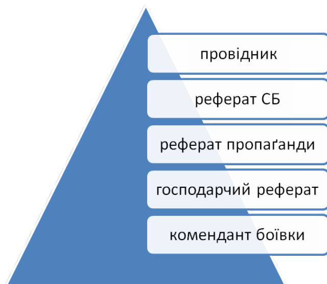
Організаційна структура проводу III району надрайону “Левада”