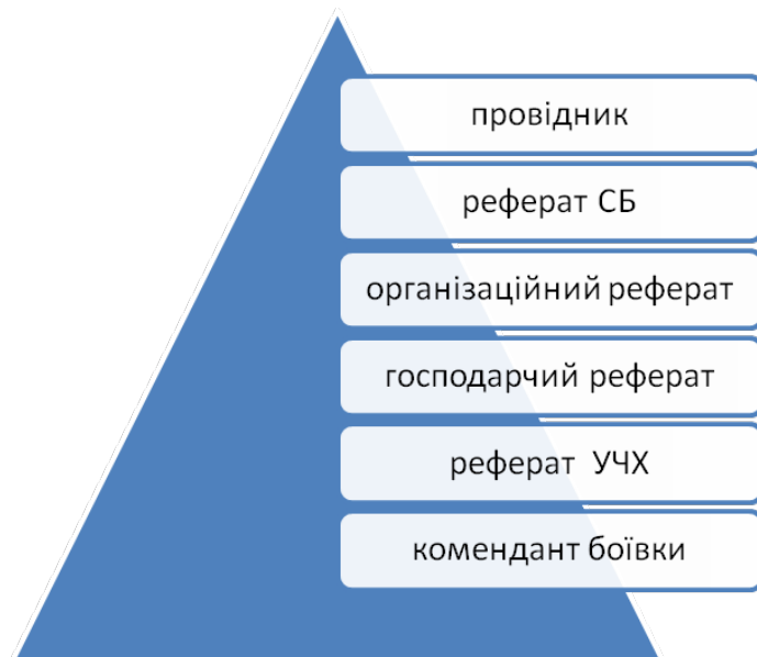
Організаційна структура проводу IV району надрайону “Левада”