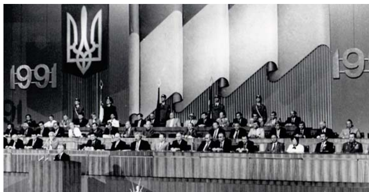
Рис. 1. Президія перших Урочистих зборів з нагоди першої річниці проголошення незалежності України. 21 серпня 1992 р.

Найголовнішими офіційними заходами святкування Дня Незалежності, починаючи з 1992 р., стали різноманітні урочисті збори. (Рис. 1)