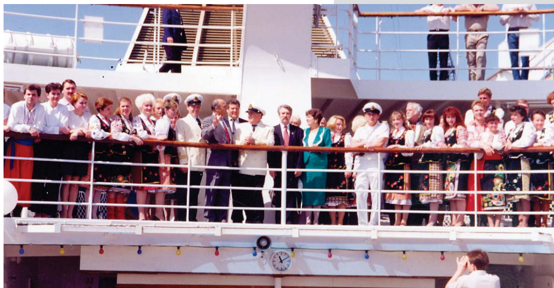
Рис. 3. Перший посол України в Канаді Левко Лук'яненко під час святкування першої річниці Незалежності України на теплоході «Грузія» у порту м. Монреалю. 21 серпня 1992 р.

Одним із перших офіційних заходів, організованих українськими дипломатами за кордоном, стало святкування першої річниці Незалежності України в Канаді. Тоді Посол України Л. Лук'яненко та Конгрес українців Канади ініціювали організацію рауту у приміщенні парламенту Канади у Оттаві. Основні заходи 21–24 серпня 1992 р. відбувалися на теплоході «Грузія». (Рис. 3)