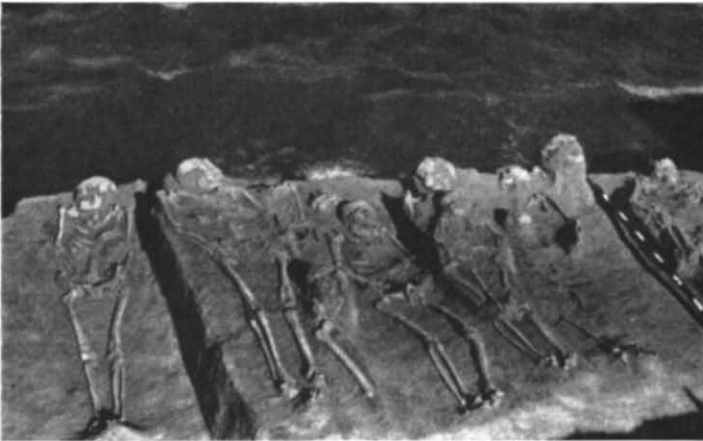
Рис. 1. Вид на частину розкопаних поховань Капулівського могильника.

Зараз, після піднесення рівня дніпровських вод, важко уявити собі топографію місцеположення могильника. Певно, це був край високого