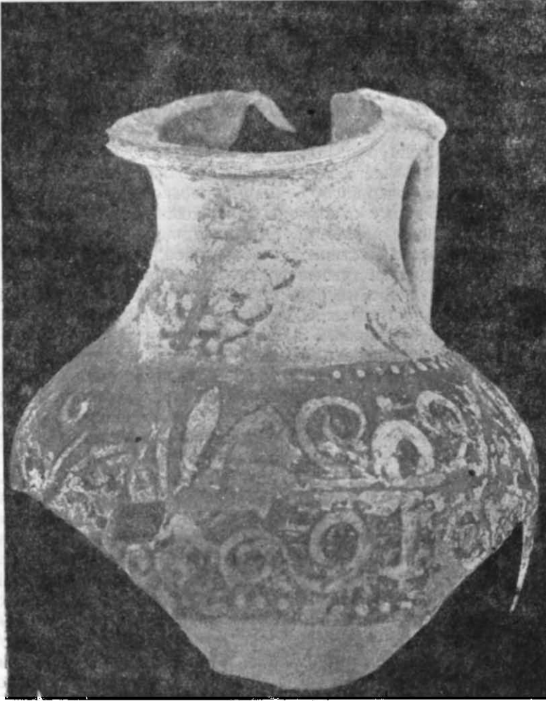
Рис. 1. Ойнохоа з Ольвії. Fig. 1. Oinochoe d'Olbia.

верхні шийки плечей і вичеревка вміщені зображення шнурів, які ніби підтримують широку пурпурову смугу і пов'язані над ручкою складним бантом.