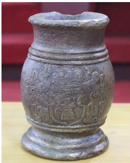
5) № 1332. Салютовка гадяцького полковника І. Чарниша (зберігається в музеї). Україна. Мідний сплав; лиття. Н – 175 мм. Калібр – 100 мм. Інв. № И-5869. З колекції В. Тарновського (каталог В. Тарновського, 1900 р., Т. II, № 1265–1266).