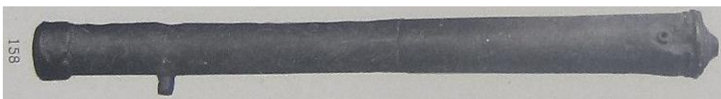
8) № 158. Гармата човенного типу (у музеї відсутня). Чавунний сплав; лиття. L – 110 см. Калібр – 37 мм. Без дельфінів, одна цапфа відбита. Знайдена поблизу с. Прохорівка Переяславського повіту. З колекції В. Тарновського – № 158.