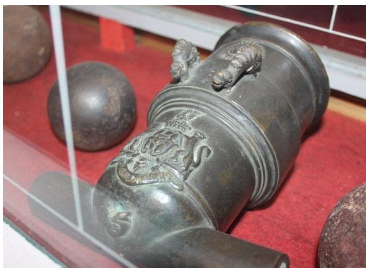
6) № 123. Мортирка графа П. Румянцева-Задунайського (зберігається в музеї). XVIII ст. Мідний сплав; лиття. L – 20 см. Калібр – 70 мм. Інв. № И-2771. На казенній частині зображено графа П. Румянцева-Задунайського і девіз: «Non solum armis» («Не лише зброєю»). З колекції музею Чернігівської вченої архівної комісії – № 658.