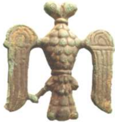
Рис. 2. Срібна підвіска з зображенням двоголового орла 30 мм. Приватна колекція

Сучасні дослідники одноставно сходяться на думці, що основними символами, які функціонували як територіальні знаки Галицько-Волинської Русі XII–XIV ст. були: 1) двоголовий орел; 2) лев; 3) галка; 4) прями́й хрест. У даній статті зроблено спробу проаналізувати різні види історичних джерел, використавши новітні досягнення археологічної науки, з метою показати, що в епоху правління Галицько-Волинською державою Романа Мстиславовича (1199–1205) і Данила Романовича (1245–1264) головним геральдичним символом був двоголовий орел.