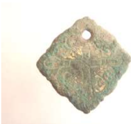
Рис. 5. Мідна підвіска з хрестом та залишками позолоти розміром 28x28 мм. Приватна колекція

Підвіски з геральдичною символікою Римської імперії були популярними як прикраси на українських землях у II–IV ст. На знайденій поблизу с. Городища Зборівського району на Тернопільщині свинцевій підвісці зображений орел із розкритими паралельно тулубу крилами і головою, повернутою вліво (рис. 6). На той час іконографія орла посіла почесне місце і в християнському мистецтві 12 .