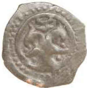
Рис. 3. Бронзова пластика з барельєфом двоголового орла розміром 68x50x6 мм. Продана на аукціоні “Віоліті” 2015 року