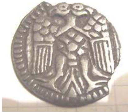
Рис. 8. Аверс золотоординської монети 1270–1290 рр. Діаметр монети 20 мм