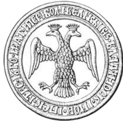
Рис. 9. Двоголовий орел на печатці Івана III (1497 р.). Російський державний архів давніх актів (Москва, Росія)

Особисті знаки галицько-волинських князів (тамги, тотеми) та геральдичні символи керованої ними держави на цю пору вивчені недостатньо, що пов'язано зі свідомим знищенням, приховуванням або втратою історичних пам'яток. Проведений нами пошук артефактів у музейних зібраннях та приватних колекціях дозволив знайти цікаві історичні пам'ятки княжої доби з цієї тематики. В одній із приватних колекцій ми виявили невеликий за розмірами бронзовий рельєф із зображенням двоголового орла в класичній геральдичній позі. Чудовий взірець давньоруської металопластики (рис. 1) було виявлено на городищі XII–XIII ст. в с. Шевченкове Галицького району Івано-Франківської області. Відкриття геральдичної пам'ятки поблизу церкви Святого Пантелеймона є додатковим аргументом до твердження тих науковців (О. Головка, О. Мельничук, Б. Томенчук), які вважали, що фундатором цього храму був Роман Мстиславович.