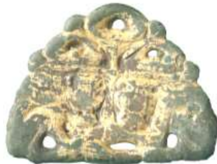
Рис. 4. Позолочена півовальна бронзова пластика з зображенням хреста та двоголового орла розміром 30x40 мм. Приватна колекція

Отже, автор “Хроніки” мав на увазі велетенський постамент орла, висота якого сягала п'яти метрів, а з головою і підніжками 6 м. Свідчення Ф. Софоновича розбурхували уяву новітніх істориків і вони, як, наприклад, Микола Котляр, поміщували літописну пам'ятку на башті одного із замків в околицях Холма 9 . Тим самим шляхом пішли й історики мистецтва. Видатний російський мистецтвознавець Михайло Воронін у цілій серії публікацій післявоєнного періоду зосереджував увагу на “величезній” скульптурі птаха. Український дослідник Микола Макаренко тлумачив голови з підніжками і скульптурне зображення орла на стовпі як річ звичайну в романському мистецтві 10 . На наш погляд, найбільше наблизився до розуміння образу орла в передмісті