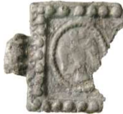
Рис. 6. Свинцева підвіска римського періоду розміром 30x30 мм з зображенням орла

Історик Володимир Пшик також убачав у скульптурі орла її візантійський родовід. У світлі його концепції, така емблематика на Галицько-Волинській Русі могла з'явитися після вимушеної втечі сюди візантійського імператора Олексія III Ангела близько 1204 р., коли біля Холма споруджувалися вежі в Столп'є і Білавино 13 . Геральдист Андрій Гречило запропонував оригінальну художню реконструкцію герба Данила Романовича: “Отже, можна припустити, що орла вирізьбили на великій плиті (можливо, вона мала форму щита), а її верхній і нижній краї й були отими, не зовсім зрозумілими, “головами й підніжками” 14 .