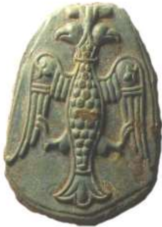
Рис. 1. Бронзовий барельєф двоголового орла розміром 58x50x8 мм. Приватна колекція

Ключові слова: Галицько-Волинська Русь, геральдика, герб, орел, Холм.