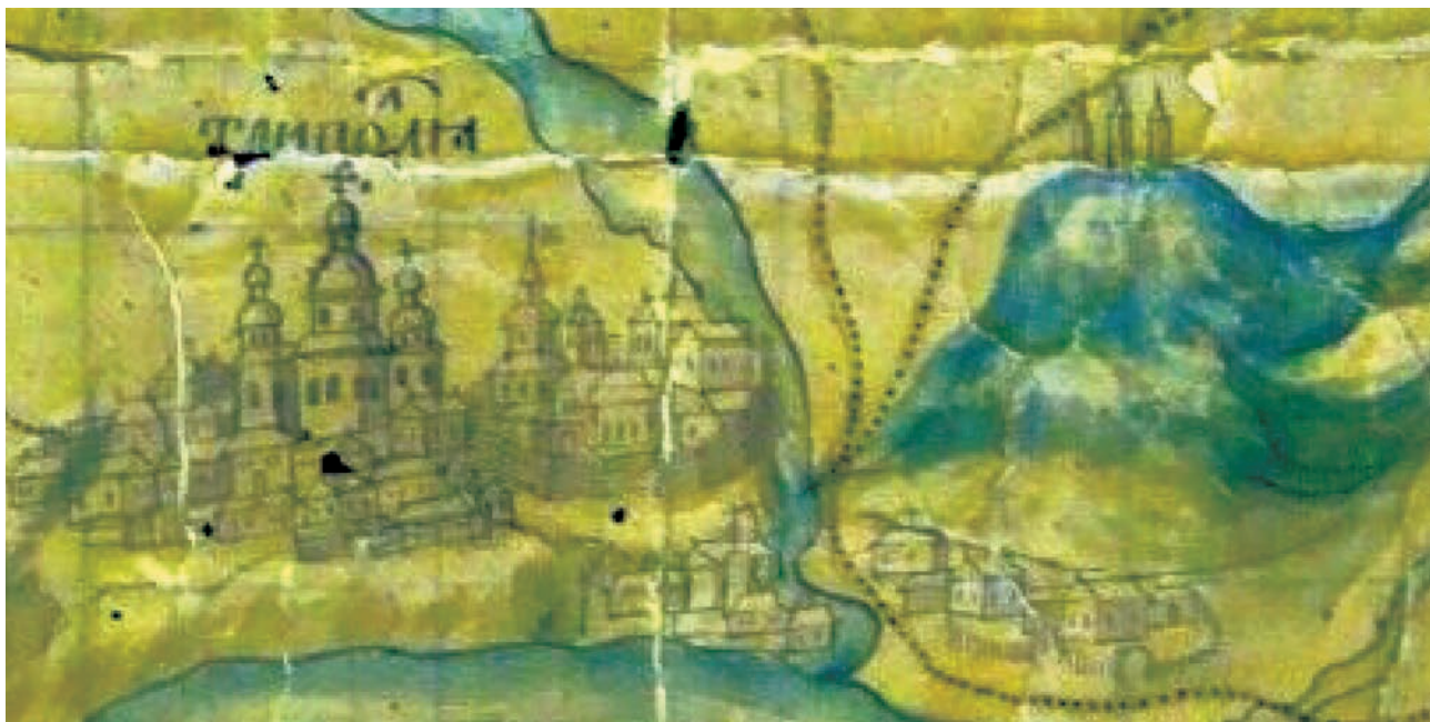
Іл. 7. Зображення Трипілья на мапі XVII ст.

Між 1596 і 1600 рр. до містечка прибували піддані-втікачі з Овруччини, Житомирщини, Брацлавщини, зокрема з маєтків шляхтичів Якуба Павші, Юрія Струся і князя Юрія Друцького-Горського 49 . У 1600 р. власники Трипілья впорядковували кордони своєї маєтності зі сторони Обухівщини. Її тодішній власник – Павло Монвид-Дорогостайський подав скаргу до суду на Федора, Гапона, Ждана і Федора молодшого Трипольських за порушення кордонів своєї маєтності. Справа закінчилася декретом Люблінського трибунальського суду від 12 червня 1600 р., згідно з яким урядники Київського підкоморського суду мали провести розмежування цих маєтностей, що відбулося 24-27 липня 1600 р. за участі коморника Шимона Уруцького, але незадоволенні розмежуванням Трипольські подали апеляцію до трибунальського суду. Розлогий опис цієї справи з усіма подробицями вміщено до книги Київського підкоморського суду 50 . У 1602 р. П. Монвид-Дорогостайський знову скаржився до Люблінського трибунальського