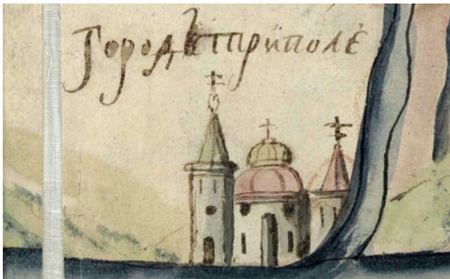
Іл. 5. Фрагмент карти Київської губернії. XVIII ст. (РГАДА, ф. 192, оп. 1, Киевская губ., № 5; http://rgada.info/geos2/zapros.php?nomer=947 )

Король своїм привілеєм надавав Дідовичам-Трипольським право на осадження і заселення містечка вільними людьми, ремісниками та прибульцями з різних місць. Трипілью надавалося магдебурзьке право за прикладом інших міст, але без будь-якої конкретизації і взірця: «В котром месте надаемъ вольность и право майдеборское прикладомъ и порядкомъ такимъ, яко ся в ынших местах заховуєть, яко они похочуть». Інакше кажучи, від власників Трипілья