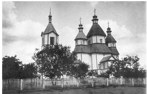
Іл. 6. Введенська церква 1797 р. (Павлуцкий Г. Деревянные и каменные храмы. К., 1905, альбом, № 17)