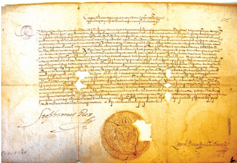
Іл. 3. Привілей на магдебурзьке право Трипіллю 1580 р. Оригінал

На відміну від більшості тогочасних документів, вписаних до книг королівської канцелярії, даний привілей написаний не латиною чи польською мовою, а кирилицею, мабуть, на прохання власників Трипілля. Палеографічний аналіз показує, що це оригінал, писаний на пергаменті, засвідчений підписами короля Стефана Баторія та писаря Руської (Волинської) канцелярії Лаврентія Пісочинського, а також печаткою Коронної канцелярії. Документ нині зберігається у Державному архіві Польщі в м. Краків (відділення на Вавелі), у фонді «архів князів Сангушків», має задовільний стан збереження, але в кількох місцях текст пошкоджений. При публікації у квадратних дужках нам вдалося реконструювати окремі втрачені місця тексту (Іл. 3, 4).