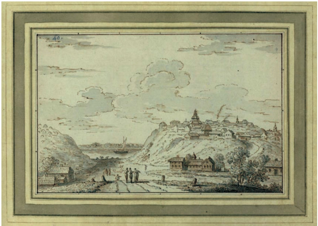
Іл. 9. Вигляд Трипілля 1781 р., художник Йоган Генріх Мюнц

підданими з сіл Коцовщина і Мамче до Зеревщини, другий позов подали в с. Лукашовка через погрози (похвалки) Парфена Трипольського, третій у м-ку Межиричка по Івана Новоселицького через збіглих підданих 124 . 29 серпня 1646 р. брати Трипольські знову подали позов у с. Збранков, маєтності Парфена Трипольського, через якісь взаємні суперечки 125 , а 3 вересня вони поклали позов у с. Черніговці по пана Скіпора, якому на той час належало це село 126 . У той же час вони скаржились на Христину Тишкевичову через те, що їхні піддани збігли з с. Клочки до її с. Дідовщина або Христинівка 127 . 27 лютого 1646 р. Олександр Солтан скаржився на братів Трипольських через те, що вони виїжджали озброєними і перешкоджали розмежуванню його Болотковських ґрунтів з с. Коцовщина згідно з трибунальським декретом 128 . Після цього наступного дня возний записав зізнання до урядових