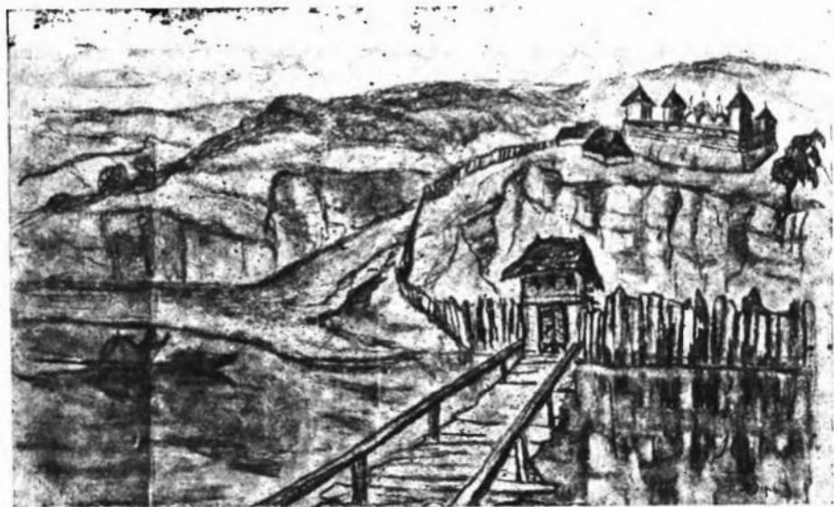
Мал. 3—Гаданий вигляд Він. Замка з Нової Вінниці.

було не менш як 10 фунтів, себ-то всього пороху було коло 5 пудів. Схований цей порох був за описом в „избі чорнїй“ в стіні Замковій, а над тою „избою“ світлиця, в якій жив ротмістр і яку він опалював. Ревізор цілком слушно каже: „хованье там порохом не безопасно от огня“. І справді, мимохіть хочеться спитати, не вже-ж не можна було збудувати приміщення спеціально для ховання пороху і на віддалені від житлових помешкань. І дивуєшся тому ротмістрові, як він міг спокійно спати, маючи під собою такі значні запаси пороху. Нарешті ревізія 1545 р. визначила, що стіни в Замку погнили, опали, всюди були діри і як каже ревізор „не тільки людей не можна було заховати, но і бидла не можна було заперети“ 1) . Правда, в ревізію 1552 р. цих останніх хиб не було,—значить був зроблений відповідний ремонт. Треба тут сказати, що і в інших українських замках, згідно з описами їх, було також чимало дефектів.