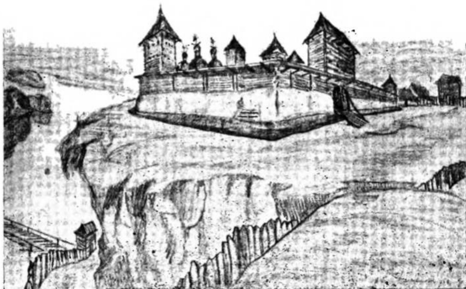
Мал. 2— Гаданий вигляд Він. Замка зі Старого Міста.

Щоб краще уявити собі вигляд Вінницького Замка та топографію його околиць, на наше прохання художник С. Сваричевський після детального вивчення місцевости ласкаво виготовив схемат. плян околиць та спробу реконструкції Він Замка, як він виглядав за описом з 1552. р. Одна з цих реконструкцій подає вигляд Замка зі Старого Міста, а друга—з Нової Вінниці.