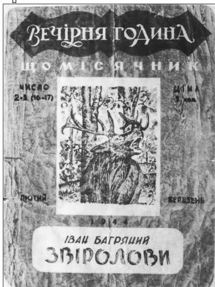
Обкладинка журналу «Вечірня година», в якому було надруковано первісний варіант повісті «Тигролови» під назвою «Звіролови»