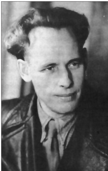
Іван Багрянний, кінець 1945 р.

Видатний український письменник Іван Багрянний уже в 30х рр. сформувався як противник радянської влади і заробив тавро «буржуазного націоналіста». Відбувши три роки заслання на Далекому Сході і провівши два роки під тортуррами у в'язниці НКВД, у 1941 р. він за переконаннями був готовий приєднатися до політичних сил, які виборювали б незалежну Україну. Тому природно, що під час Другої світової війни Багрянний співробітничав з Організацією Українських Націоналістів (як мельниківців, так і бандерівців) і Українською Повстанською Армією.