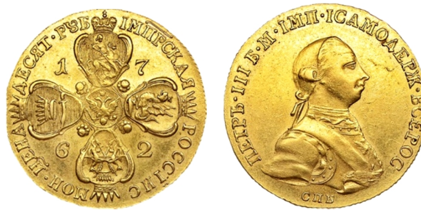
Російська імперія, золотий імперіал (10 рублів) Петра III (1761 – 1762), 1762 р.