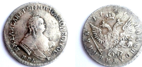
Російська імперія, срібна полуполтина Єлизавети Петрівни (1741 – 1761), 1741 р.