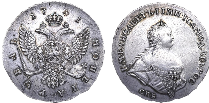
Російська імперія, срібний рубль Єлизавети Петрівни (1741 – 1761), 1741 р.