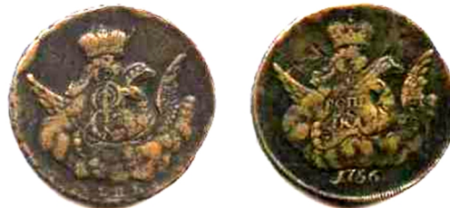
Копійка, мідь, Росія, Єлизавета Петрівна (1741 – 1761), 1756 р.