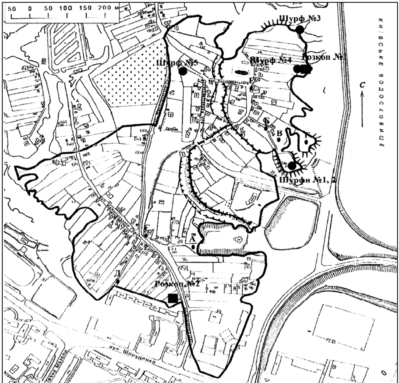
Рис. 1. Загальна схема археологічних робіт на території Вишгородського історико-культурного заповідника у 2012 р.

Підйомний матеріал можна поділити на три періоди: