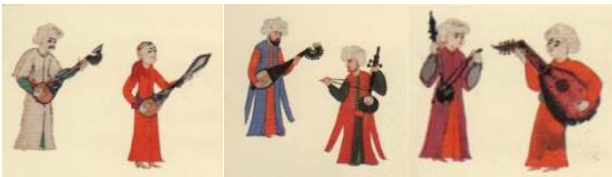
Іл. 4. Зображення турецьких лютнеподібних хордофонів, 1582 рік. Альбом «Surname-i Hümayun» 1582 року (BEYAZIT 2014, s. 105).

Зауважимо, що турецькі іконографічні джерела цього часу навіть подають певні варіанти у зображенні відповідних копузів (kopuz) (Іл. 4) (BEYAZIT 2014, s. 105).