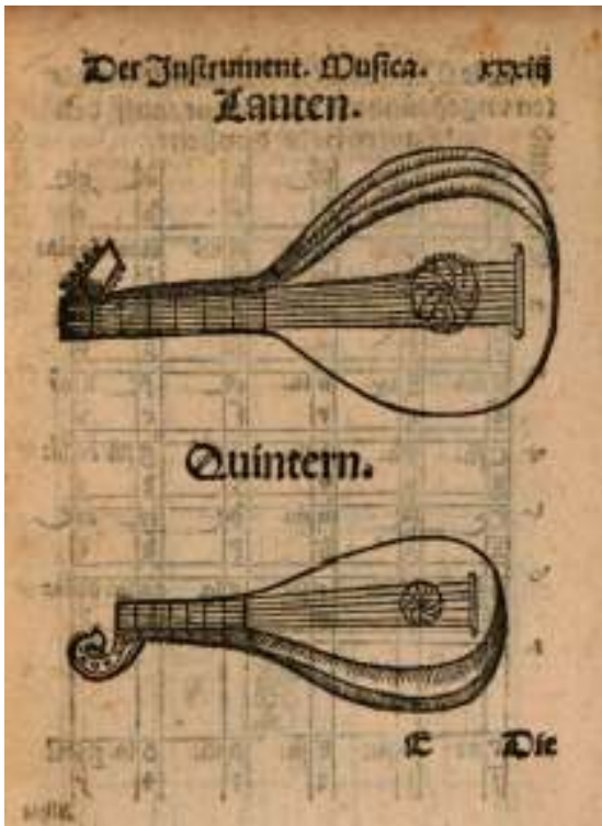
Іл. 2. Зображення невеликої лютні (Quintern), 1542 рік. Музично-теоретичний трактат Мартина Агріколи « Musica instrume[n]talis deutsch... » 1542 року (Agricola 1542, s. E I).

Це саме зображення «квінтарної» лютні з трактату Себастьяна Вірдунга, але у дзеркальному положенні, вміщено у трактаті Мартина Агріколи « Musica instrume[n]talis deutsch... » 1542 року (Іл. 2) (Agricola 1542, s. E I).