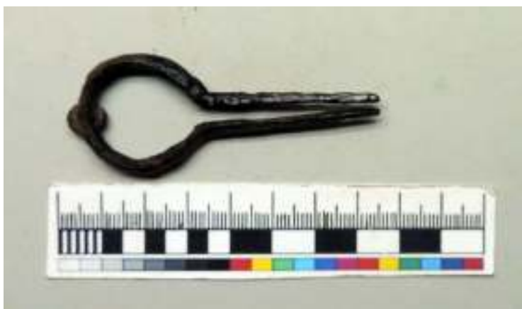
Іл. 6. Дримба (варган) з розкопок у Дорогобужі, приблизно 1570-ті роки.

Про танці на Волині, при чому в негативному сенсі, дізнаємося з духовного заповіту