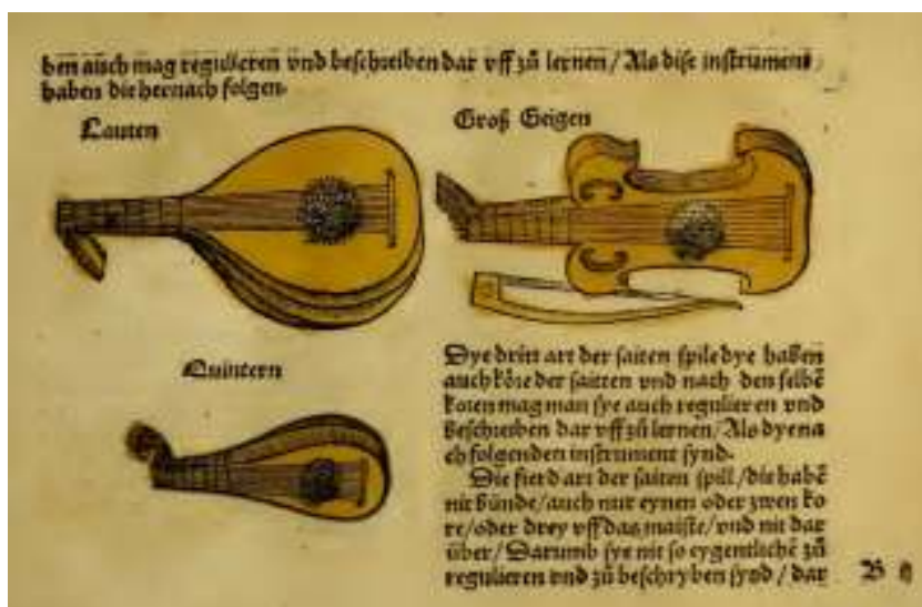
Іл. 1. Зображення невеликої лютні (Quinter), 1511 рік. Музично-теоретичний трактат «Musica getuscht und außgezogen durch...» 1511 року Себастьяна Вірдунга (Virdung 1511, s. B II).

У цьому розділі досліджуються назви музичних інструментів, які були віднайдені в актових книгах Волині XVI – початку XVII століть. Важливо відзначити, що корпус назв музичних інструментів досить різноманітний. Серед них є й такі, які виразно вказують на іноземне походження. Істотно конкретизується розуміння про побутування кобзи у ранньомодерний період, адже у суспільній свідомості існує глибоко вкорінене уявлення про кобзу, як суто український традиційний народний музичний інструмент.