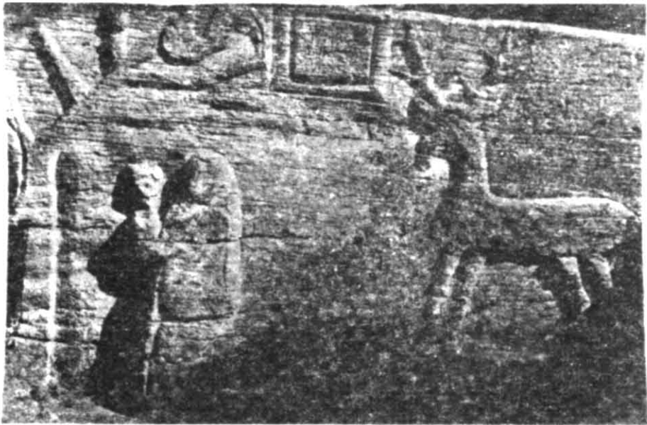
Рис. 1. Наскальний рельєф з села Буша Ямпільського району Вінницької області (відбиток з фотографії В. Б. Антоновича, 1883 р.).