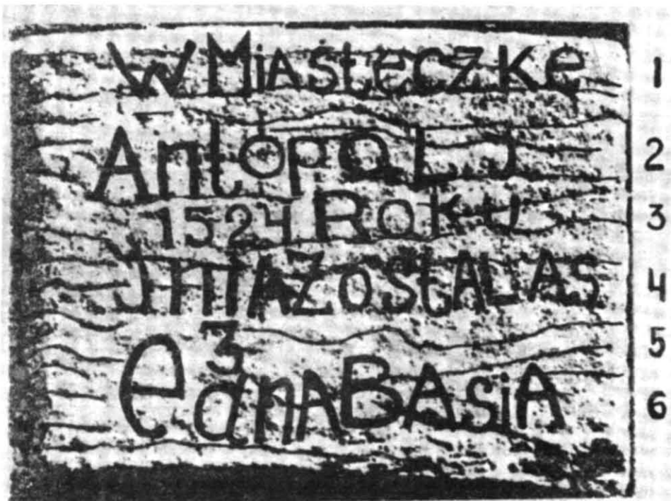
Рис. 2. Рамка зі слідами напису, елемент композиції рельєфу до і після реконструкції напису (збільшення з фотографії 1883 р.).

вається бушанцями — «Татарська». Згадується ця назва Л. Марчинським і в 1822 р. 12 Поселення, що виникло пізніше, почало називатись «Буша — бо ж залишилась одна душа». Згадуючи цей вислів, мешканці села не пояснюють його — такою непрозорою, незрозумілою, загадковою здається їм зараз назва села. Очевидно, чули цей вислів і в 1873 році, хоч зміст розуміли інакше: «По преданню, на той написи и возле нея, на мѣстѣ нынѣ существующего с. Буши, нѣкогда стояло многолюдное и богатое мѣстечко, называющееся Гилополець или Антополець. Нынѣшнее с. Буша произошло отъ этого мѣстечка и названо такъ отъ малороссійскаго слова «бушовать» потому, что здѣсь кто-то когда-то бушевалъ, — вырѣзалъ всё населѣніе мѣстечка» 13 .