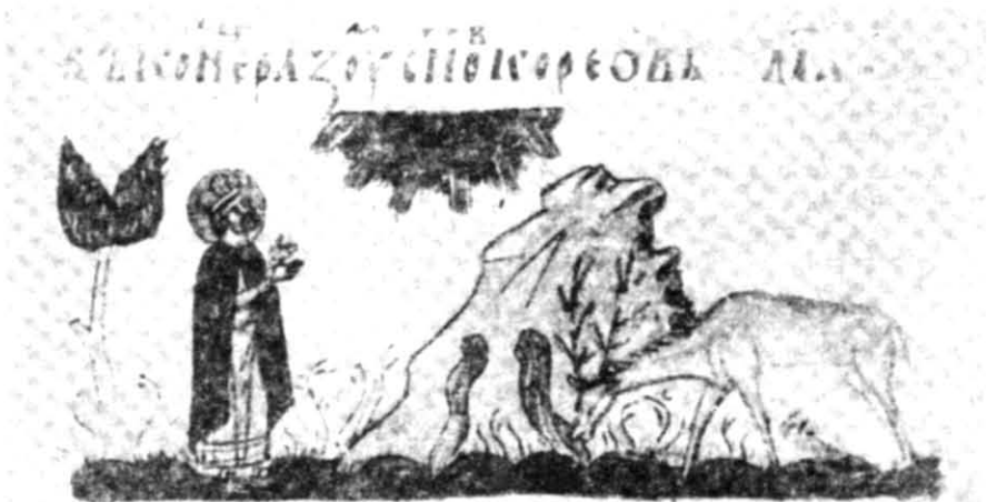
Рис. 4. Паралелі Бушанського рельєфу:

1 — скельний рельєф Святого Онуфрія з села Кашперівці Заліщицького району Тернопільської області; 2 — болгарська мініатюра XIV ст.