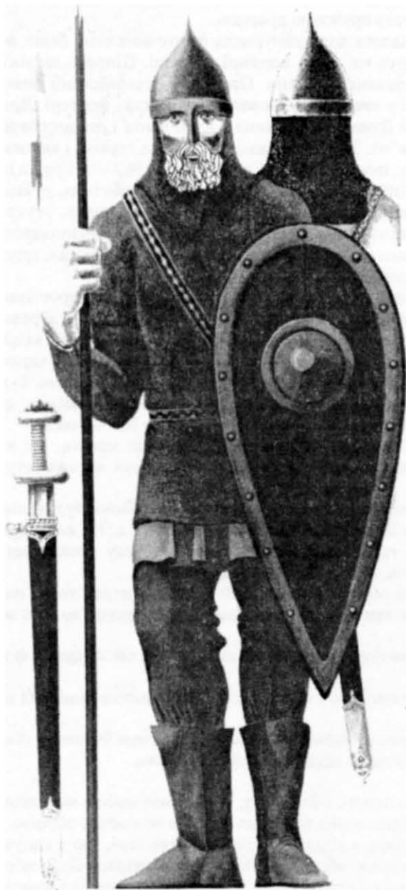
Рис. 3. Давньоруський воїн (реконструкція П. П. Толочка).

а утримувався на плечах шлейками або виготовлялася у вигляді жупана — з розрізом спереду. Замість степових кроїв, використовувалося запозичене у візантійських бронників «пончо», з розрізами по боках і на одному плечі, часто з оздобленням подолу і рукавних пройм бахромою з рядів металевих платівок, нашитих на шкіру або тканину.