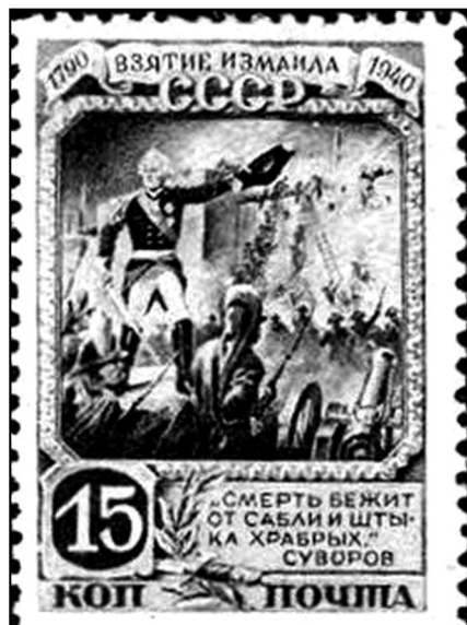
Поштова марка СРСР, із серії «До 150-річчя узяття фортеці Ізмаїл»

Суворов розраховував отримати за штурм Ізмаїла чин генерал-фельдмаршала, але Потьомкін, клопочучи за нього перед імператрицею, запропонував нагородити його медаллю і чином гвардії підполковника або генерал-ад'ютанта. Медаль було вибито, і Суворова було призначено підполковником Преображенського полку. Таких підполковників було вже десять; Суворов став одинадцятим. Сам же головнокомандуючий російською армією князь Г. А. Потьомкін-Тавричеський, приїхавши до Петербурга, отримав у нагороду мундир фельдмаршала, вишитий алмазами, ціною 200 тис. крб. і Таврійський палац; у Царському селі було передбачено спорудити князевіobelisk із зображенням його перемог і завоювань.