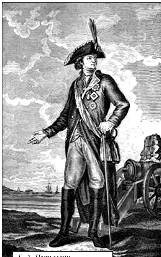
Г. А. Потьомкін

7 грудня Суворов надіслав командувачеві турецькими військами в Ізмаїлі офіцій-