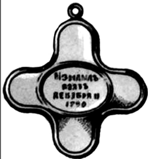
Медаль за узяття Ізмаїла: написи «За отменную храбрость» на лицевому боці та «Измаил взят декабря 11 1790» на зворотньому

зили за місто і хоронили за церковним обрядом. Турецьких трупів було так багато, що їх, за наказом, кидали в Дунай (на цю роботу призначалися полонені, поділені на черги). Але і за таких дій Ізмаїл було очищено від трупів лише через 6 днів. Полонені прямували партіями до Миколаєва під конвоєм козаків [30, 271–274].