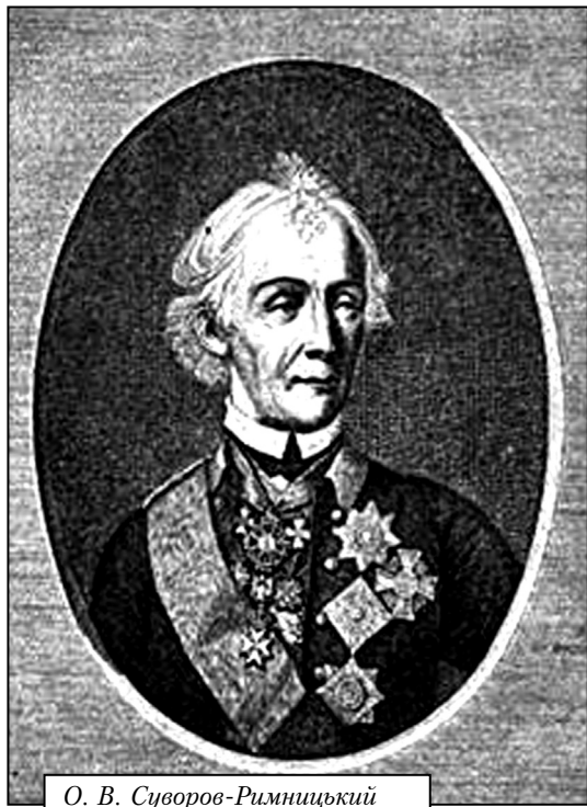
О. В. Суворов-Римницький

На чолі турецького гарнізону був Айдозле-Мехмет-паша. Частиною гарнізону командував Каплан-Гирей, брат кримського хана. Султан дуже гнівався на свої війська за всі попередні капітуляції і звелів у разі падіння Ізмаїла страчувати з його гарнізону