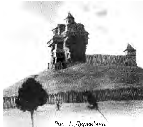
Рис. 1. Дерев'яна Святоспаська церква на Камені в реконструкції М. Рожка.

Потрапити на територію монастиря можна було лише через західні або східні ворота. Територію монастирського двору захищали високі мури та кутові потужні вежі. На сьогодні збереглися лише округлі стіни трьох веж. На основі залишків перекриття можна твердити, що вони мали триповерхові рівні. Вежі, що знаходилися на північно-східному куті монастиря та східних воріт, зараз не існує. Від неї залишився фрагмент потужної кам'яної стіни, залишки зруйнованих фундаментів, окремі архітектурні