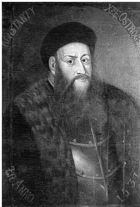
ЛІМ №Ж-1533. XVIII ст.? Т. Копистинський? XX ст.?