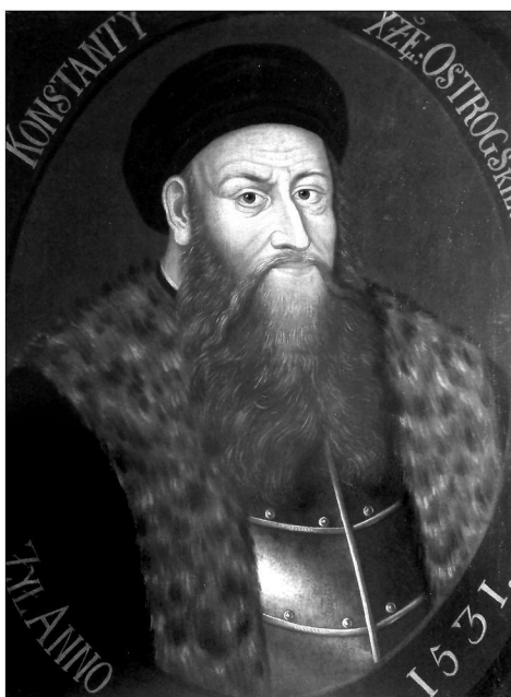
Портрет К. І. Острозького. Худ. К. Александрович. Львівський історичний музей

Як вже згадувалося вище, сьогодні цей портрет також зберігається у Львівському історичному музеї.