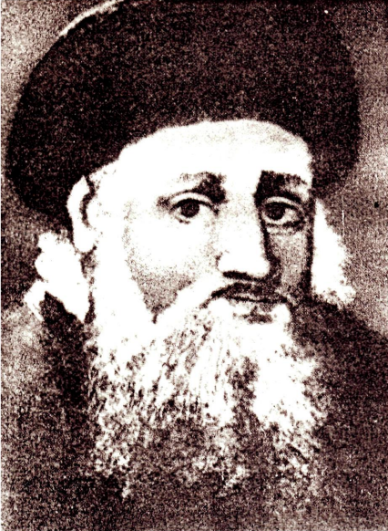
Замок у Новомалині (втрачений)