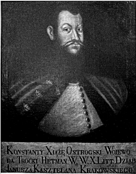
Портрет К. І. Острозького. Копія ХVІІ ст. Львівський музей історії релігії

На портреті князь Роман виглядає вже немолодою людиною (хоча помер він, маючи трохи більше 30 років). Сангушко вдягнений в розшитий кун-