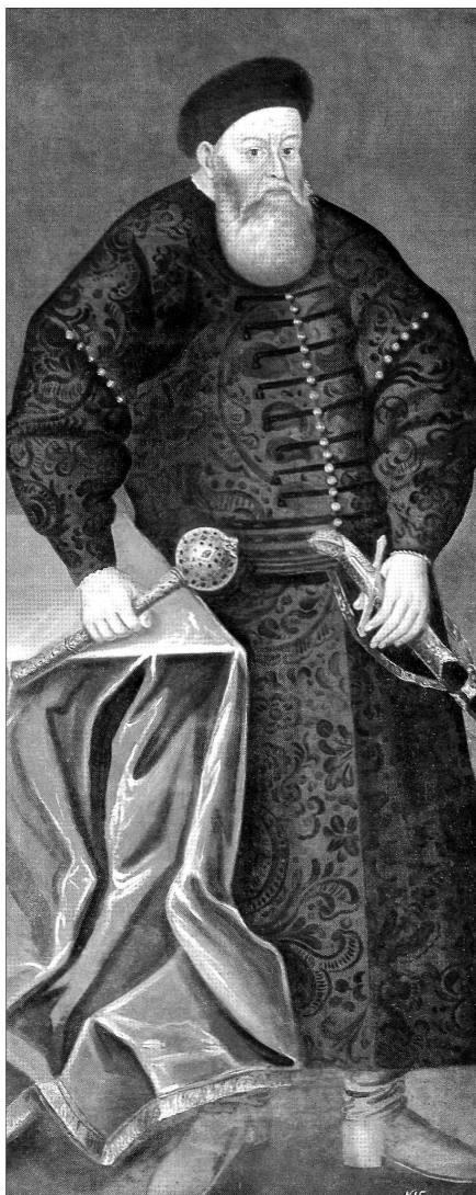
Портрет К. І. Острозького. Національний музей історії і культури Республіки Білорусь, м. Мінськ

галереї князів Радзивілів у Несвіжі 41 . Найвірогідніше, замовником контерфекту був Криштоф Радзивіліл «Перун» (1547-1603), зять кн. Василя-Костянтина Острозького 42 . На пізній копії, що датується XVIII ст. і збереглася й донині, гетьман із сивою бородою «лопатою», стоїть біля столу, вкритого червоною скатертиною. На відміну від попередніх портретів, князь одягнений в парчевий кунтуш насиченого фіолетового кольору з золотими гудзиками. В одній руці він тримає гетьманську булаву, оздоблену дорогоцінним камінням, інша лежить на позолоченому ефесі шаблі.