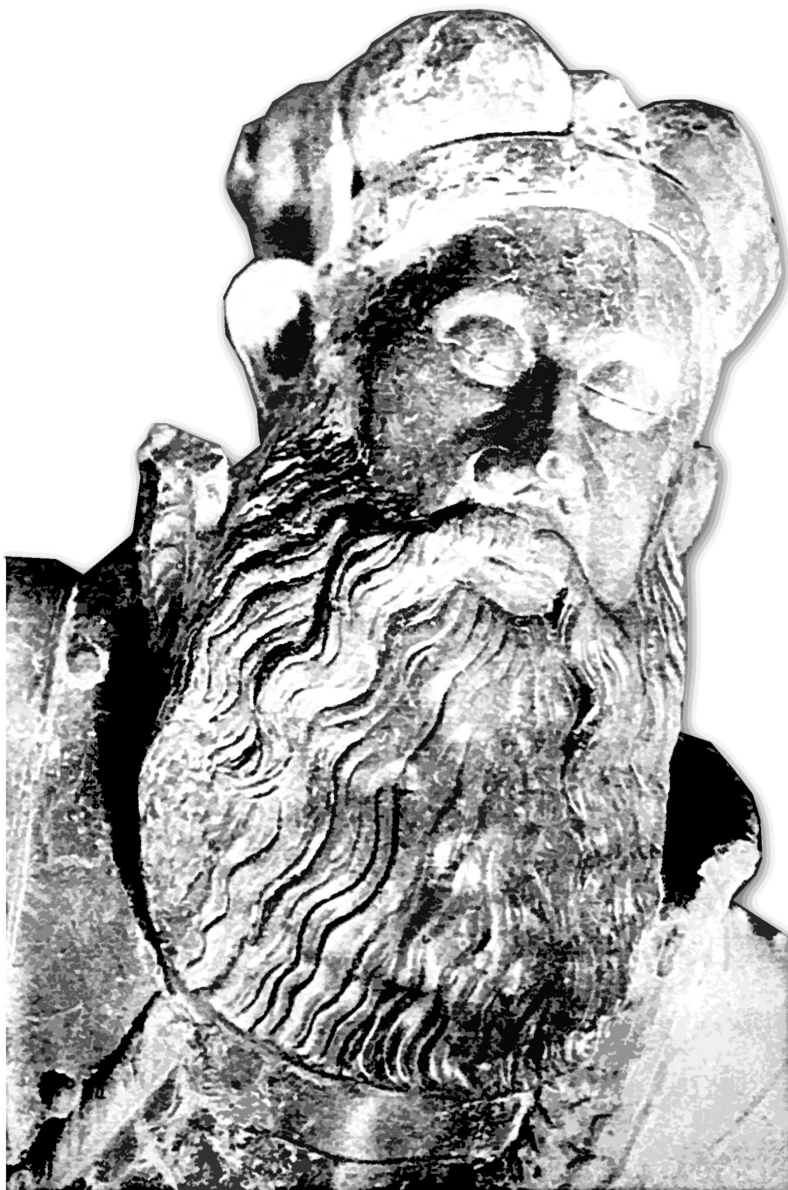
Фрагмент надгробку кн. Костянтина Острозького в Успенському соборі Києво-Печерської Лаври