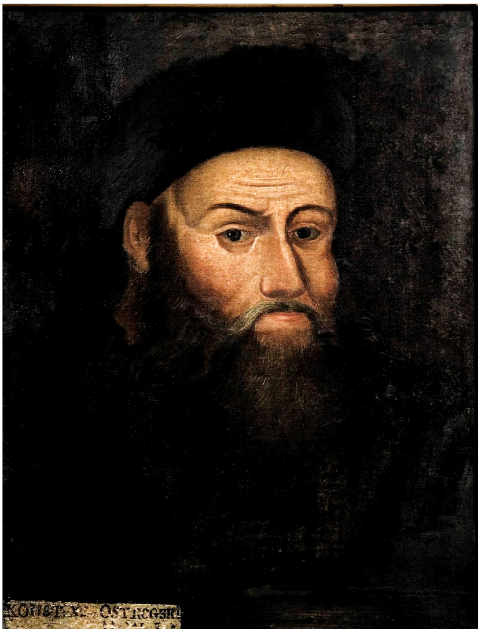
Портрет кн. Костянтина Острозького з музею в Острозі