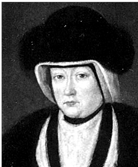
Портрет Катерини Замойської. Окружний музей м. Замостя