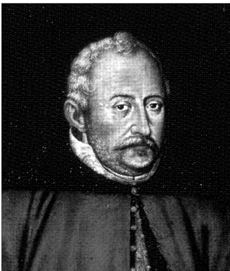
Портрет Яна Замойського. Львівська галерея мистецтв

Портрет Адама-Костянтина Острозького (пом. 1618 р.) зберігається в музеї міста Ярослава. Складається враження, що це прижиттєве зображення князя. Молодий аристократ стоїть у вільній гоноровій позі, тримаючи праву руку на боці, а іншу – поклавши на край столу, на якому лежить шапка. Князь одягнений в яскраво-червоний жупан і такого ж кольору делію, підбиту чорним хутром і обрамлену широким чорним коміром. На ногах (ліва виставлена трохи вперед) жовті чоботи. Темно-зелена завіса з тяжкими китицями живописними збірками звисає за спиною Острозького, посилюючи урочистість та імпазантність портрету.