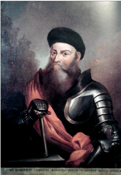
Музей у Білій Церкві