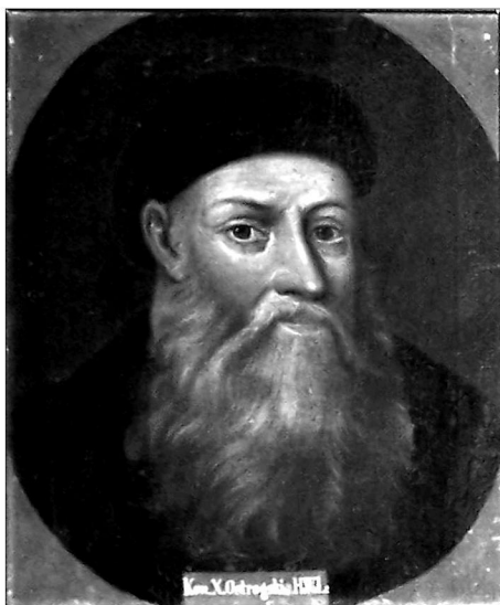
Портрет К. І. Острозького. Львівський історичний музей, інв. № Ж-1480

знаходиться в острозькому музеї. Погрудне зображення, темне тло, на голові однакової форми берет. На обох портретах вміщений однаковий напис: «Kon[stanty] x[iazę] Ostrogski, h[etman] w[ielki] I[itewski]». Борода князя вже зображена «лопатою». Мабуть, на момент створення копії фарби на першовзірці вже настільки потемніли, що майстру довелося на власний розсуд вирішувати, якої форми має бути борода. В подальшому вона неодноразово повторювалася у копіях портрета Костянтина Івановича. Різниця між портретами лише в тому, що портрет із Львова зображений в овалі і напис знаходиться по середині нижнього краю полотна, на відміну від острозького, де напис знаходиться в лівому нижньому кутку.