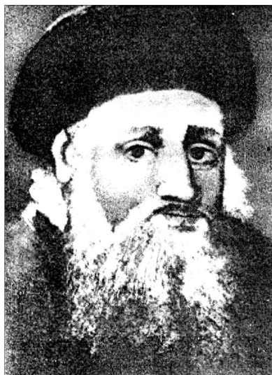
Портрет К. І. Острозького (втрачений)

7. Пишучи про портрети князя Костянтина Івановича, не варто випускати з