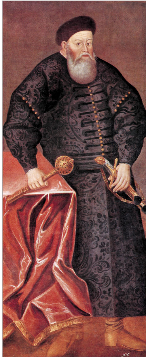
Музей історії і культури Республіки Білорусь у Мінську