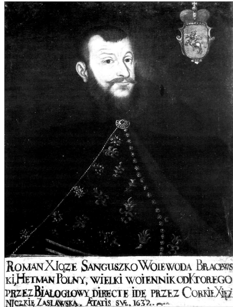
Портрет Р. Ф. Сангушка. Копія ХVІІ ст. Музей у Тарнові (Польща)