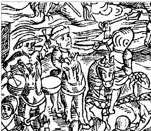
Князь К. І. Острозький у битві під Оршею 1514 р. Гравюра з «Хроніки польської» Мартина Бельського

з найдавніших і, разом з тим, найдетальніше зображення литовського гетьмана можна побачити на картині «Битва під Оршею», де князь написаний у трьох різних ракурсах. Це своєрідний фільм XVI ст., у якому послідовно розгортаються події на полі бою. Деякі дослідники вважають 4 , що твір створений у 1520-1530-х роках і належить невідомому майстрові школи Луки Кранаха Молодшого. На картині гетьман зображений портретно: вже немолодий чоловік з довгою сивою бородою і вусами одягнений у пурпурний жупан, розшитий спереду золотом. На голові тканий золотом берет, подібний до того, в якому бачимо короля Сигізмунда Старого на портретах авторства Крістофано дель Альтіссімо з галереї Уффіці у Флоренції та Ганса Дюрера (?) з Національного музею у Варшаві. Чорні високі чоботи із позолоченими острогами і обручеве стремено з кулькою внизу, над якими звисає позолочена шабля угорського типу, що тримається на прикрашених ремнях з круглими золотими медальйонами. Статус аристократа підкреслюють двічі обкручений навколо шиї товстий золотий ланцюг і перстень на пальці, виготовлений із цього ж дорогоцінного металу. Кінь під гетьманом покритий блакитною попоною, накинутою зверху на сідло і зав'язаною у вузол на кінських грудях; деталі зброї позолочені.