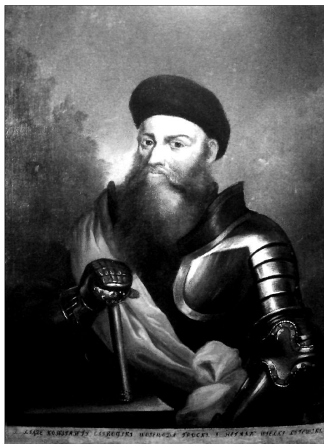
Портрет К. І. Острозького. Білоцерківський краєзнавчий музей

5. Ще одне зображення князя знаходиться в Білоцерківському краєзнавчому музеї. Образ Острозького подібний до зображень на попередніх портретах «в обладунку», але розміщення самої постави змінено. На глядача дивиться полководець, фігура якого повернута на три чверті вправо (а не вліво, як на інших картинах). Острозький у чорному береті і панцирі, що обперезаний через плече червоним плащем, спирається на гетьманську булаву. На задньому плані зображено ледь помітний пейзаж, який був характерний романтичній добі кінця XVIII – початку XIX ст.