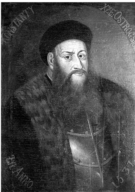
Портрет К. І. Острозького. Львівський історичний музей, інв. № Ж-1533

У серпні 1911 року картину продав львівському Національному музею імені короля Яна III колекціонер Станіслав Заревич, а до місця свого теперішнього зберігання картина потрапила після того, як у Львові утвердилася радянська влада (1940) 15 . У цьому ж музеї зберігається майже ідентичний, лиш трохи менший за розміром, портрет Костянтина Івановича XVIII ст. авторства Костянтина Александровича (інв. № Ж-1707) 16 . На портреті князь зображений у береті і металевому панцирі, поверх якого накинута шуба з широким хутряним коміром. Погруддя гетьмана вписане в овал, по периметру якого вміщена легенда: «Konstanty x[ią]ze Ostrogskie żył Anno 1531» («Костянтин князь Острозький жив року 1531»).