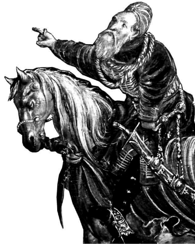
Князь К. І. Острозький. Фрагмент картини «Битва під Оршею». Національний музей, Варшава

Писемних свідчень про зовнішній вигляд князя збереглося обмаль. На жаль, вони є малоінформативними і вказують лиш на те, що Острозький був брונетом «невеликої статури» («зросту невисокого») 3 . Значно більше інформації дає іконографічний матеріал. Одне