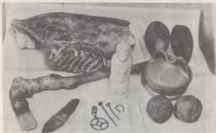
Знахідки часів кам'яного віку та періоду міді-бронзи. Васильківський краєзнавчий музей