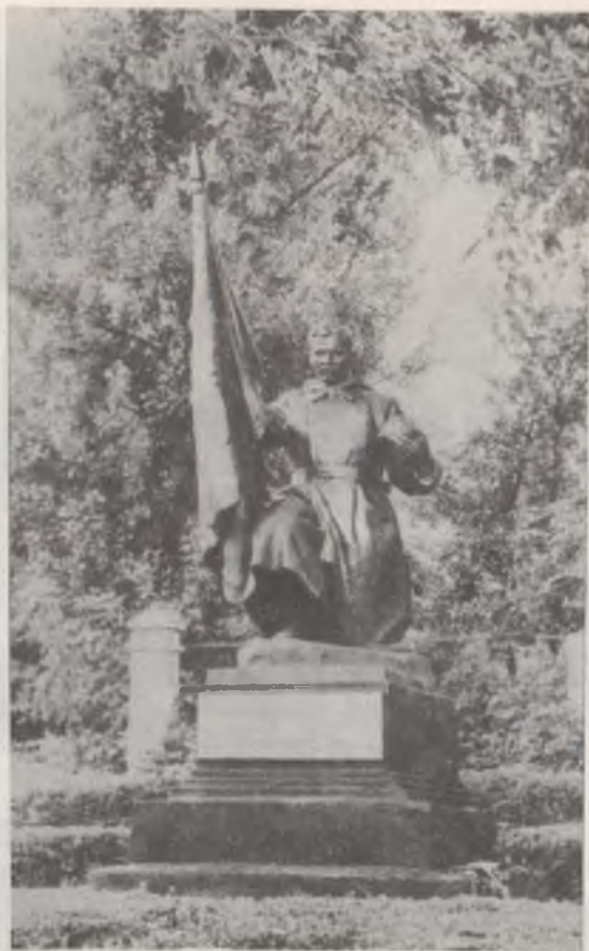
Братська могила у центрі міста