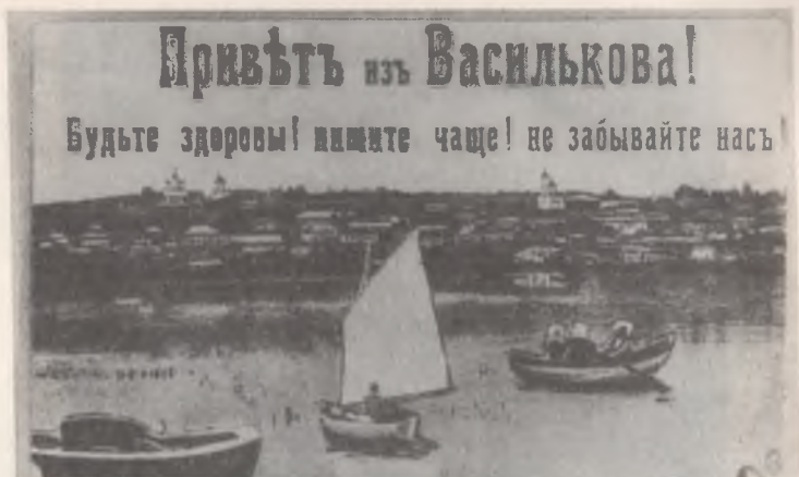
Васильків у XIX столітті. Поштова листівка