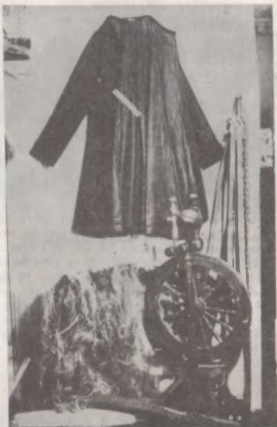
Знаряддя праці, одяг жителя Васильківщини кінця XIX — початку XX століття. Васильківський краєзнавчий музей