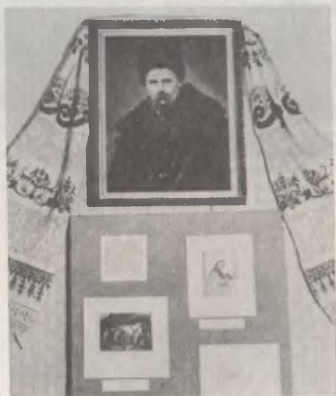
Т. Г. Шевченко і Васильківщина. Васильківський краєзнавчий музей