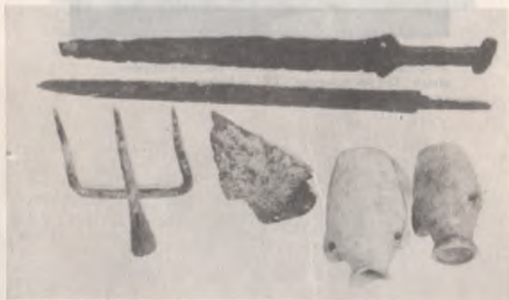
Знаряддя праці, предмети побуту, зброя часів Київської Русі. Васильківський краєзнавчий музей