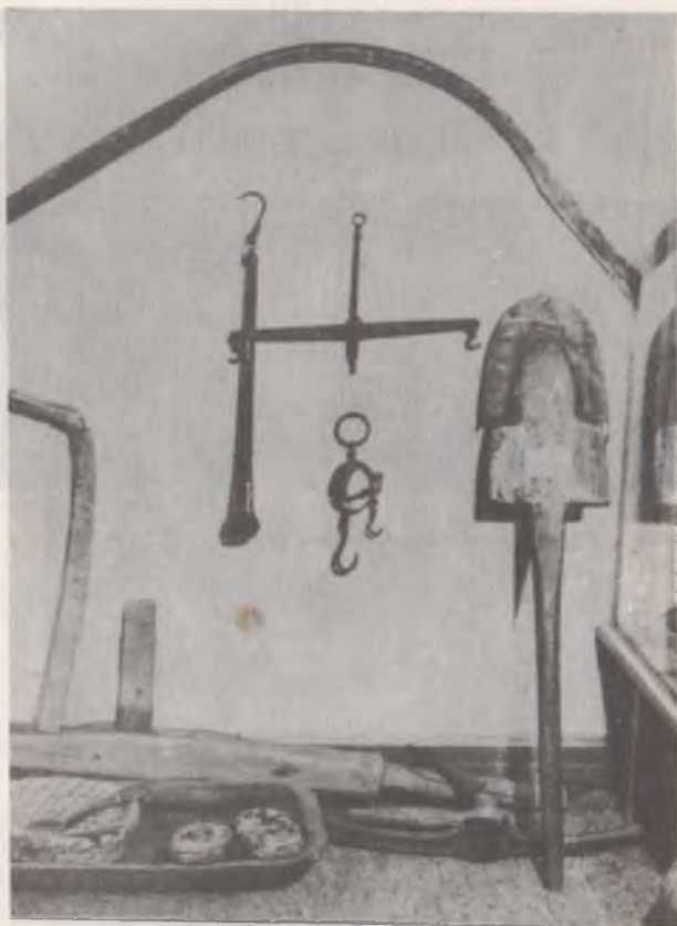
Знаряддя праці, предмети побуту. Початок XIX століття. Васильківський краєзнавчий музей

Васильківський краєзнавчий музей Знаряддя праці, предмети побуту. Початок XIX століття.