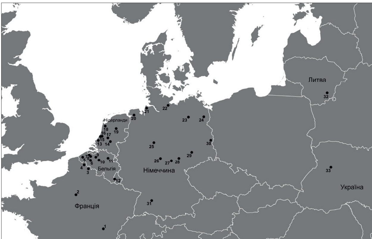
Рис. 3. Місцезнаходження посуду з продряпаними літерними позначеннями в жіночих монастирях на території Європи. 1 – Шалон-сюр-Сон, 2 – Париж, 3 – Амаж, 4 – Маркетт, 5 – Іпр, 6 – Петегем, 7 – Гентбрюгге, 8 – Гесден, 9 – Дендермонде, 10 – Тер Камерен, 11 – Геркенрод, 12 – Клерфонтен, 13 – Делфт, 14 – Тіль, 15 – Утрехт, 16–17 – Лейден, 18 – Хорн, 19 – Кампен, 20 – Гесель, 21 – Альтенвальде, 22 – Любек, 23 – Гайлігенрабе, 24 – Зехаузен, 25 – Бренкгаузен, 26 – Фрауензее, 27 – Арнштадт, 28 – Єна, 29 – Німбшен, 30 – Губен, 31 – Бебенгаузен, 32 – Вільнюс, 33 – Дубно.