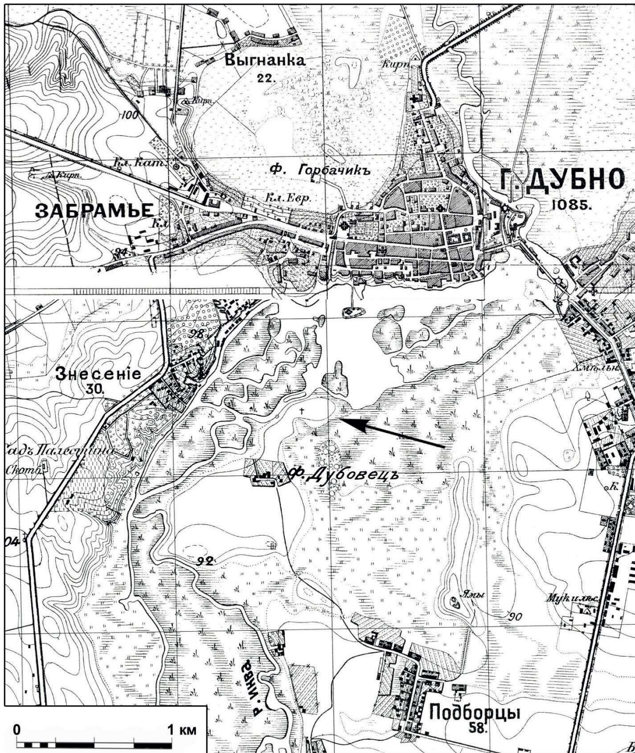
Рис. 1. Розташування острова Дубовець на карті генерального штабу РККА 1939 р. на основі зйомки 1885 р.