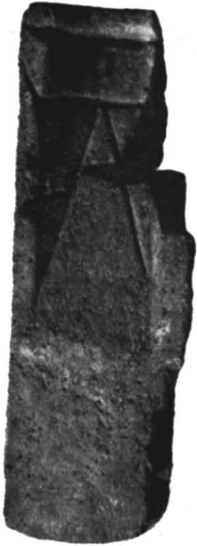
Рис. 2. Ливарна формочка, на якій зображений негатив кельта.

Велике значення має знайдена тут чотирихвітна ливарна формочка для лиття чотирьох предметів: кельта та трьох долот. Формочка виготовлена із одного бруска сланцевого талька, прямокутної форми довжиною 14,5 см, шириною 4,5—5 см, товщиною 3—4 см. Кути бруска в декількох місцях збиті (рис. 2). Нижче подаємо короткий опис предметів, відбитих на формочці 5 .