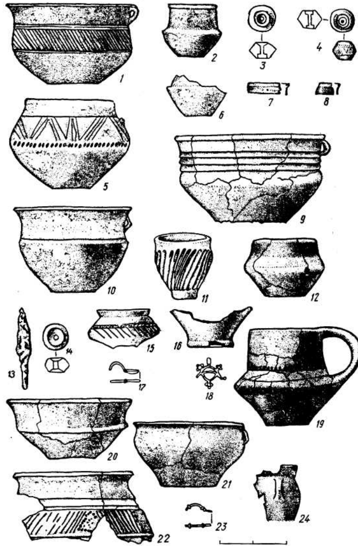
Рис. 3. Матеріали із поховань могильника в с Дитиничі.

високорозвинутої провінційно-римської культури. На нашу думку, могильники в Коблеві, Каборзі і Вікторівці відбивають процеси змішування степових племен з північно-західним прийшлим населенням.