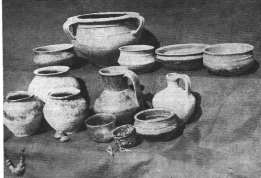
Рис. 2. Знахідки із поховань могильника черняхівської культури в с. Бережанка.

Зовсім інша картина відкрилась при дослідженні поселення і могильника в с. Бережанці. Вони розташовані над безіменним потічком — правою притокою р. Горині. На поселенні відкрито залишки невеликих наземних жител, при розчистці яких зібрано тільки гончарну кераміку характерних черняхівських форм. Ліпного посуду тут не виявлено. На могильнику досліджено шість трупопокладень і три трупоспалення. Поховальний інвентар складається лише з гончарних посудин, фібул та ін-