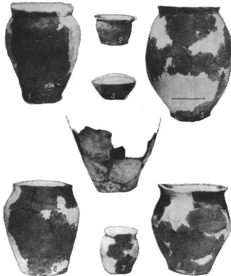
Рис. 5. Ліпний посуд із поселення черняхівської культури Бовшів II (1-8).

розкрити характер взаємозв'язків і процесів їх інтеграції. Але про те, що такі процеси відбувалися, свідчать різноманітність поховальних обрядів на черняхівських могильниках (трупоспалення і трупопокладення), коріння яких ведуть до попередніх культур, різні прийоми житлобудівництва і наявність елементів різних культур у матеріальній культурі черняхівського населення. Ці процеси проходили під сильним і постійним впливом провінційно-римської культури, що не тільки визначила ті характерні риси черняхівських старожитностей, які притаманні всім культурам римської периферії, а й настільки щільно перекрила місцеві