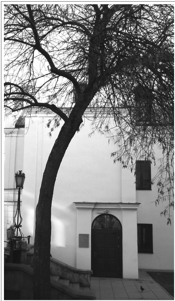
Wojewódzka Biblioteka Publiczna im. Hieronima Łopacińskiego w Lublinie