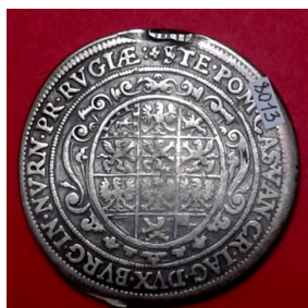
25. Бранденбурзько-Прусска держава, Ернст, талер 1919 р.; с. Чапаївка Бершадського р-ну, Вінницької області, 1974 р.