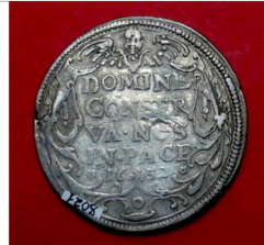
31. Республіка з'єднаних провінцій, талер 1652 р.; с. Чапаївка Бершадського р-ну, Вінницької області, 1958 р.