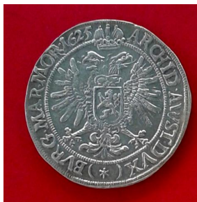
28. Священна Римська імперія, Моравія, Фердинанд II (1619–1637), талер 1625 р.; с. Рудка Дунаєвського р-ну Хмельницької області, 2014 р.