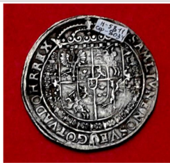
29. Річ Посполита, Сигізмунд III Ваза (1587-1632), талер коронний 1632 р.; с. Чапаївка Бершадського р-ну, Вінницької області, 1974 р.