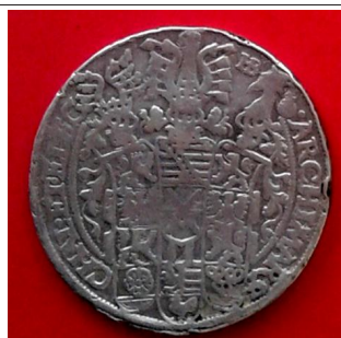
23. Священна Римська імперія, Саксонія, Християн (1586-1623), талер 1587 р.; Шаргородський р-н Вінницької області, 2010 р.