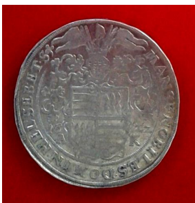
27. Священна Римська імперія, Фрідерік (1608–1624), талер 1622 р.; с. Рудка Дунаєвського р-ну Хмельницької області, 2014 р.