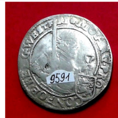
32. Голландська республіка, ріксдаальдер 1611 р.; с. Велика Бушинка Немирівський р-н Вінницької області, 2004 р.