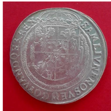
30. Річ Посполита, Владислав IV (1632 -1648), коронний талер 1632 р.; с. Рудка Дунаєвського р-ну Хмельницької області, 2014 р.