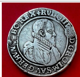
24. Священна Римська імперія, Цісарство Німецьке Рудольф II (1576-1612), талер 1595 р.; Оратівський р-н Вінницької області, 1999 р.