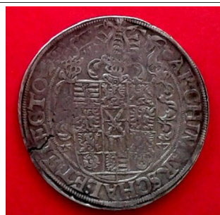
21. Священна Римська імперія, Саксонія, курфюрст Август (1565-1599), талер б.д.; Шаргородський р-н Вінницької області, 2010 р.