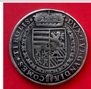
22. Священна Римська імперія, Тіроль, Фердинанд I (1522-1564), талер б.д.; м. Вінниця, 1998 р.