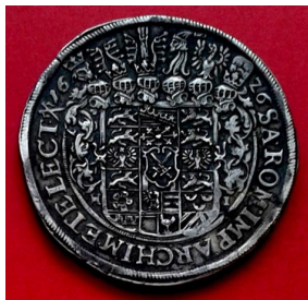
26. Священна Римська імперія, Іоан Георг (1624–1635), талер 1626 р.; Шаргородський р-н Вінницької області, 1995 р.