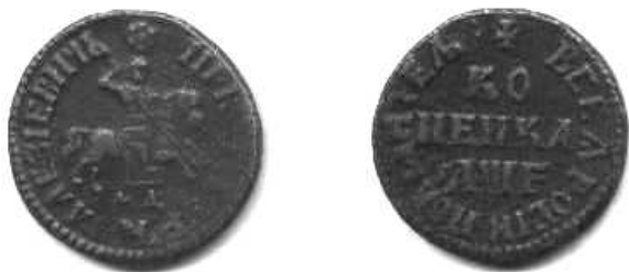
Копійка, мідь, Петро I (1682–1725), 1705 р.

Указом від 16 червня 1727 р. Катерина I дрібні срібні гроші розпорядилася переробити у гривеники (10 коп.). На срібній та мідній копійках Петра I та Катерини I зображено Георгія Переможця на коні із списом («копйом») у правій руці, який вбиває дракона.