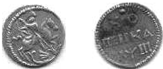
Копійка, срібло, Петро I (1682–1725), 1718 р.

З часу занепаду Київської Русі у XII–XIII ст. Святий Георгій зображався на іконах у вигляді молодого воїна-вершника, який списом вбиває дракона. Георгій в очах віруючих був захисником ображених, пригнічених, обездолених, вимагав покровительства та заступництва. Тому його зображення можна було зустріти на іконах, ямських дзвіночках, на срібних і мідних московських та російських монетах XVI–XVIII ст. [14].