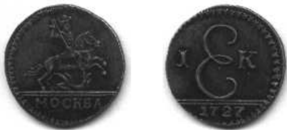
Копійка, мідь, Катерина I (1725–1727), 1727 р.

Навколо краю поля монети з обох сторін розміщений орнамент із випуклих трикутничків. Стан збереження монети досить добрий.