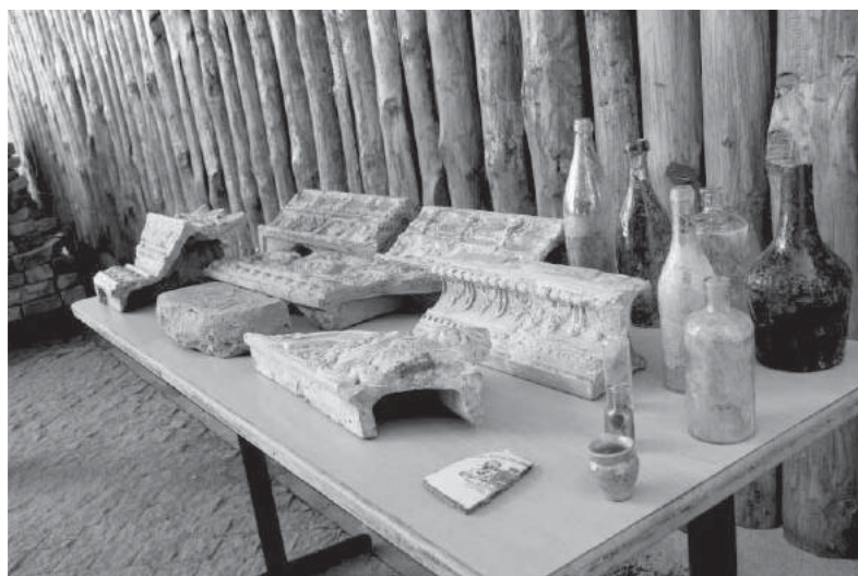
Фото 1. Матеріали археологічно-архітектурних досліджень Башти Чорторийських