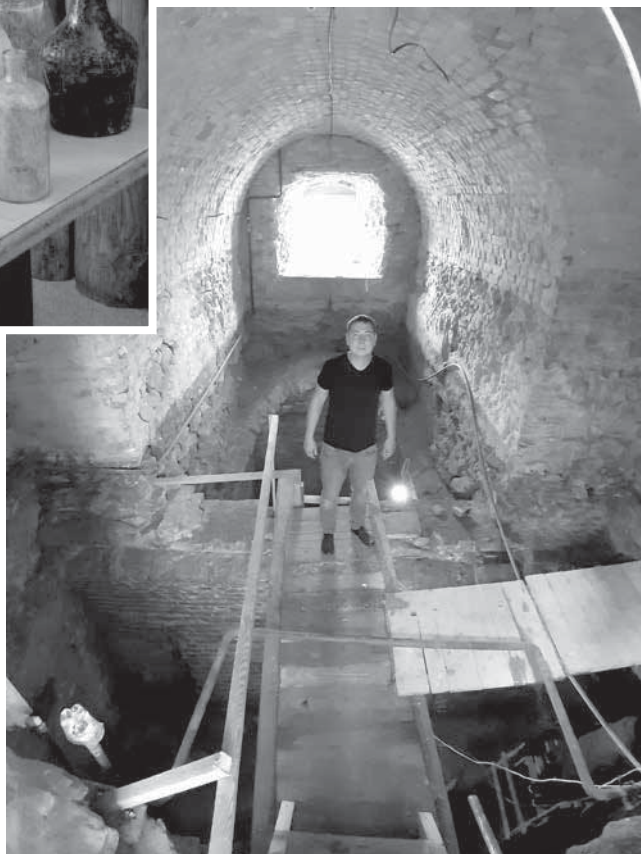
Фото 2. Робочий момент дослідження Башти Чорторийських