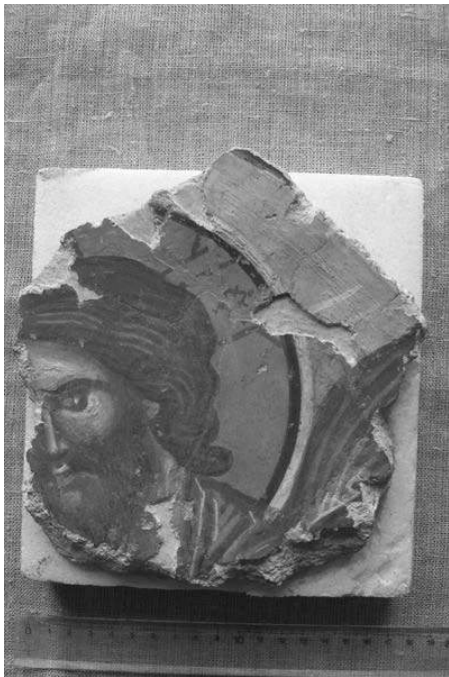
Рис 3. Фреска Лик Христа XIVст. з розкопок М.Малевської церкви І.Богослова в Луцькому замку.

(Рис. 3). Описана будівля собору функціонувала до 1766 року, коли її було частково розібрано, а на звільненому місці закладено новий більший, однак ніколи не добудований храм.