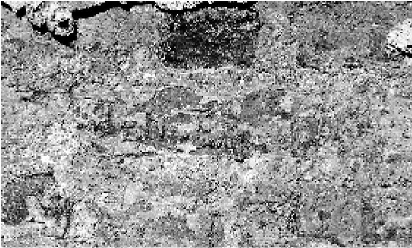
Рис. 3. Напис по цеглі до розчистки, читається як “JAN LIS”

критого мурування з вапняним пофарбуванням нетинькованих стін у баштах, які на той час були без дахів.