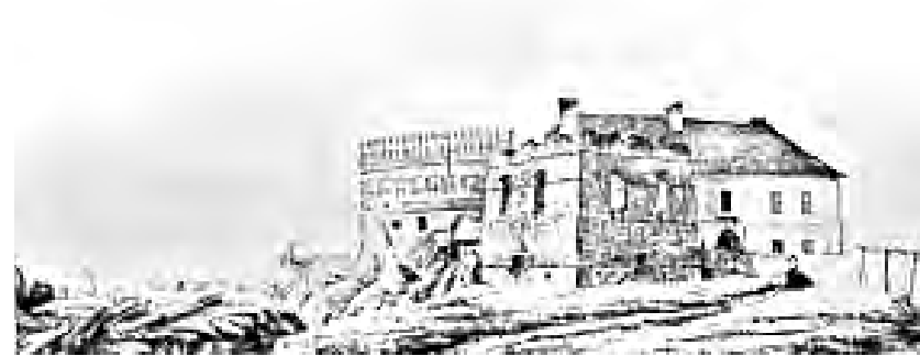
Рис. 1. Загальний вигляд замку в Клевані станом на 1819 р. Рисунок невідомого автора. З фондів Національної бібліотеки у Варшаві. Розшукана М. Л. Долинською. Східний аттиковий мур, вірогідно, авторства Яна Лиса.

Шрифт напису на цеглі класичний, романський, з виразними серіфами. Напис автор виконав на одній із цеглин, шви заглажені, товщиною 2,5–3 см у чергуванні цегли "довжик – поперечик" в кожному ряді, що відповідає готичному муруванню середини XV ст.