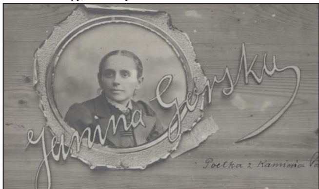
Рис. 4. Листівка-колаж з портретом поетеси Я. Гурської

Ще одна поштівка (рис. 4), датована 1906-м р., має фон дерев'яної дошки, на якій у стилізованій круглій рамці вміщено жіночий портрет із написом «Janina Górska», виконаним із художнім смаком. Праворуч трохи неохайним почерком написано: «Poetka z Kamienia Pod.». З-під рамки видно стилізований клаптик паперу, на якому ледь помітно виведено: «L. Rakowski» [15].