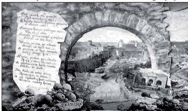
Рис. 3. Листівка-колаж 2