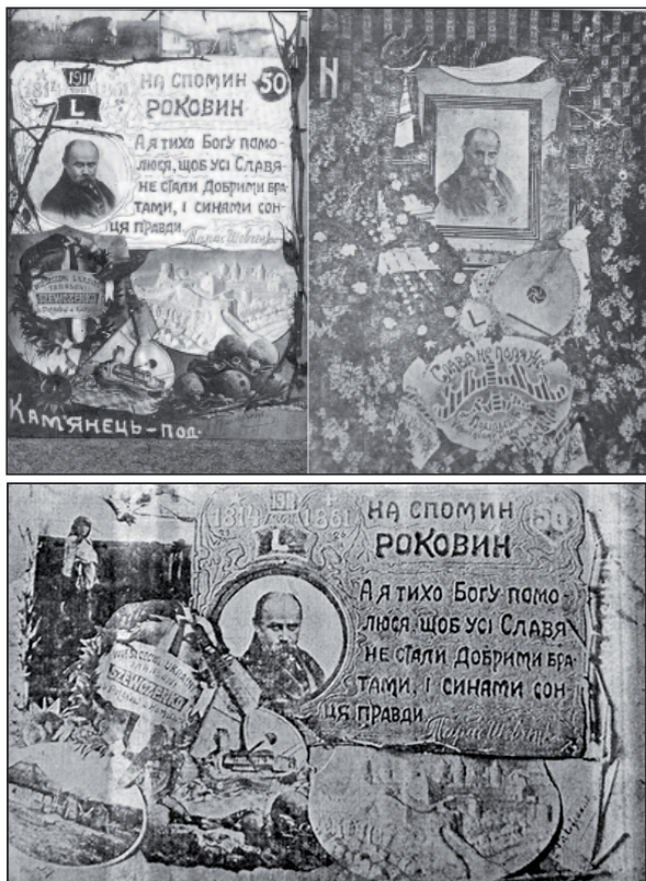
Рис. 7. Перевидана серія листівок в честь 50 роковин смерті Т.Г. Шевченка