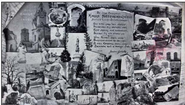
Рис. 5. Фотографія-колаж

У фондах Кам'янець-Подільського державного історичного музею-заповідника ми виявили фотографію авторства Л. Раковського, наклеєну на велике паспарту (рис. 5). Це фотоколаж із 43 зображень історичних пам'яток Кам'янця-Подільського, кожне з яких має підпис. У центрі вгорі є напис «z Kamieńca», а нижче на імпрізовізованому клаптику паперу – вірш поетеси Яніни Гурської «Do Jego Excelencyi Karola Niedzialkowskiego biskupa Lucko-Zytomierskiego», датований 1904-м роком. У лівому нижньому куті є фото Леона Раковського з його власноручним підписом. Уся композиція обрамлена вишитим рушником із типовим подільським орнаментом [12].