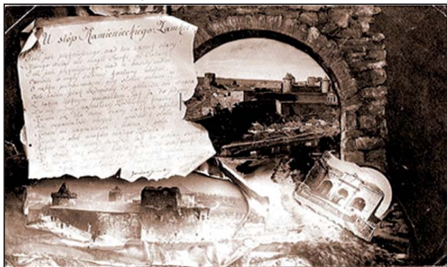
Рис. 2. Листівка-колаж 1