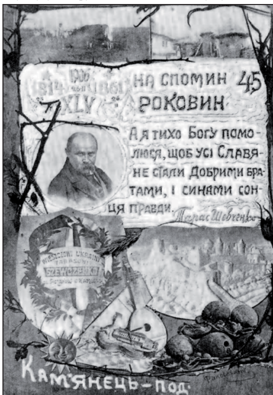
Рис. 6. Пам'ятна листівка в честь 45 роковин смерті Т.Г. Шевченка

барельєфа Турецької фортеці, кобзи, ліри, чавунних ядер, шістнадцятипроменевого сонця, двох панорамних сільських видів. Уся композиція обрамлена гілками черсаку. Поруч у лавровому вінку вміщено фігурну таблицю з написом польською мовою «Співцеві України Тарасові Шевченку від поляків Кам'янця». Поряд з портретом поета є рядки з поеми «Єретик». У нижній частині – напис «Кам'янець-Под» та прихований підпис Л. Раковського українською мовою. Листівка містить дати життя поета «1814-1861», дату роковин «45» та дубльовану дату латиною «XLV». На другій листівці також зображено колаж із портрета Т.Г. Шевченка, барельєф Турецької фортеці, кобзи, ліри, лаврового вінка з аналогічним написом попередньої листівки та рядків з поеми «Єретик» [6, с.524]. На третій листівці теж зображено колаж із портрета Тараса Григоровича Шевченка, обрамлений у вишиваний рушник, під яким розміщено квітковий вінок, стилізований під ліру та бандуру. Між ними у круглій розетці зображено латинську цифру «XLV». Нижче у великому круглому щитку є напис великими літерами «Слава не поляже», а нижче: «Подільське українське товариство Просвіта». Тлом для колажу слугує візерунковий килим і квіти бузку [7].