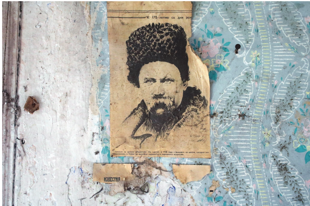
Фото 3. Село Залісся Пінського району. Портрет на стіні будинку, де більше ніхто не живе 58

Грошові та натуральні податки, якими обклали селянські господарства, мали бути внесені в суворо визначений термін — не пізніше, ніж за 2–3 дні. В селян, вимушених платити грошові податки, скуповували худобу за безцінь — за корову давали 30–40 руб, за які можна було придбати 2 л горілки 59 .