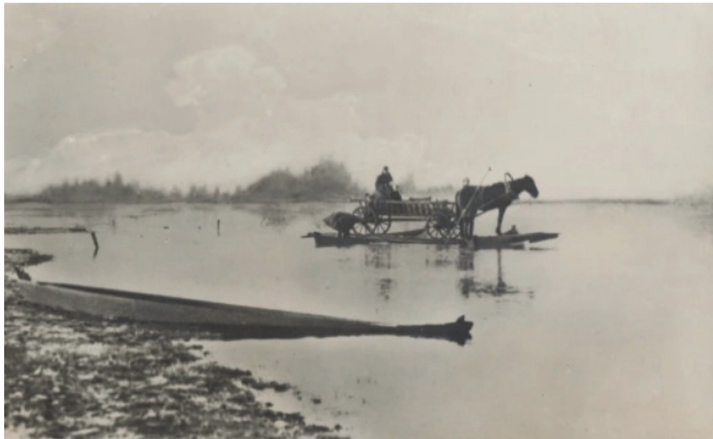
Фото 1. Переправа через річку 6

фотоальбом «Країна Полісся», що містив понад 500 світлин та спогадів про побут поліщуків. Майже через п'ять десятиліть коштом діаспори його було перевидано в США і в Польщі 5 .