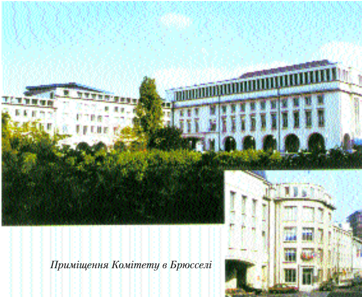
Приміщення Комітету в Брюсселі