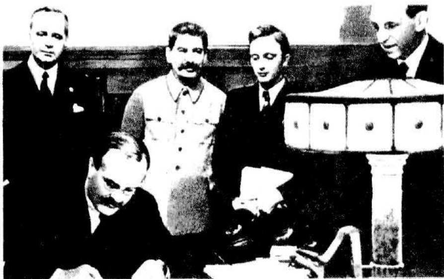
В. М. Молотов подписывает пакт о ненападении с Германией. 23 августа 1939 года