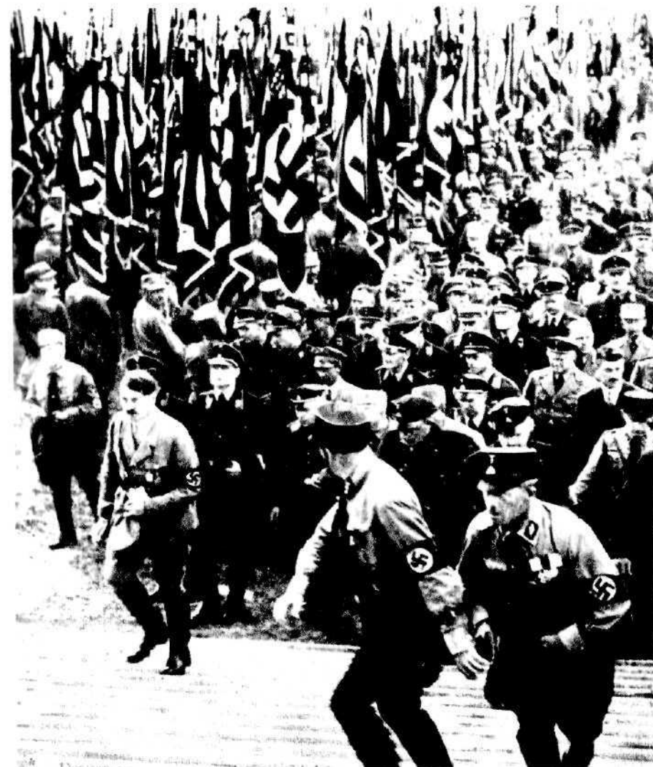
Так начиналось... Фюрер и его ближайшее окружение во время парада нацистов

Здесь мы снова вступаем в сферу дискуссии о принципах: имело ли Советское правительство моральное право перенимать методы своих капиталистических соседей? В первую очередь