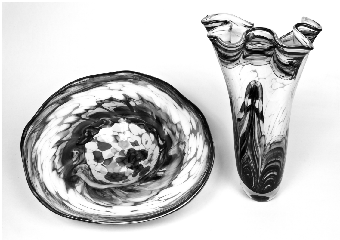
Рис. 17. Декоративний набір «Агати». 1989 р. КЗХС.

Інструменти, створені для виготовлення декоративного набору «Сади цвітуть» (1989), у 2014 р. були передані художницею в подарунок музею [6].