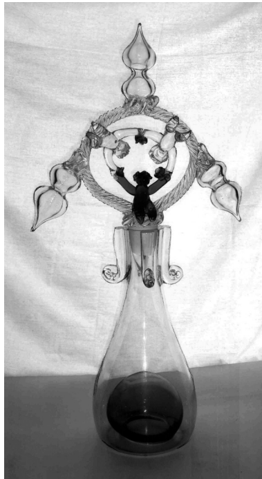
Рис. 13. Композиція з циклу «Космос».