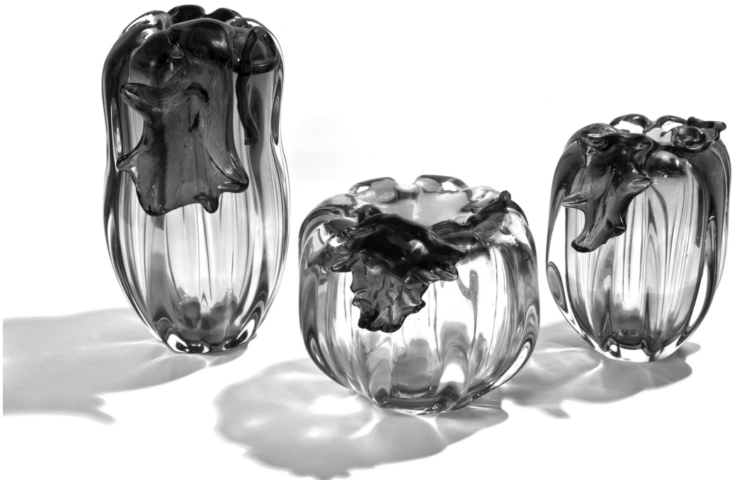
Рис. 11. Композиція «На баштані». 1995 р. КЗХС.