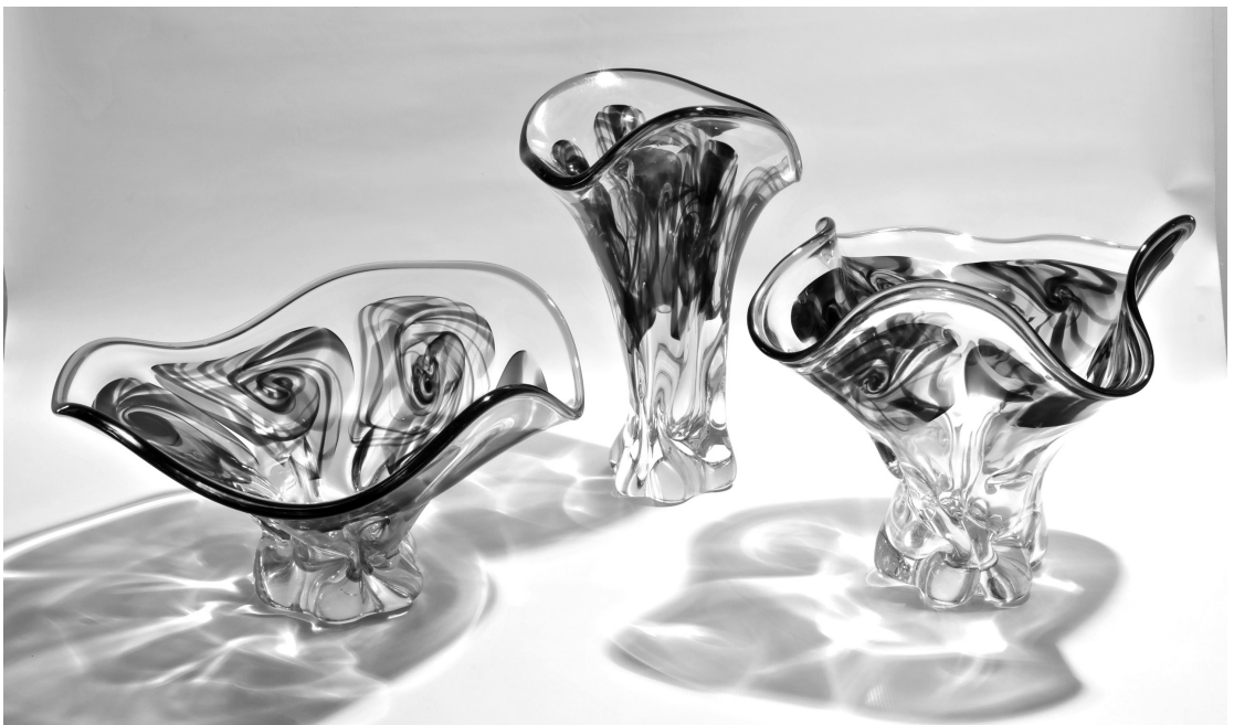
Рис. 7. Декоративний набір «Букет». 1980 р. КЗХС.