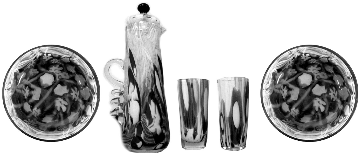
Рис. 16. Набір для соків «Квіти на снігу». 1978 р. КЗХС.