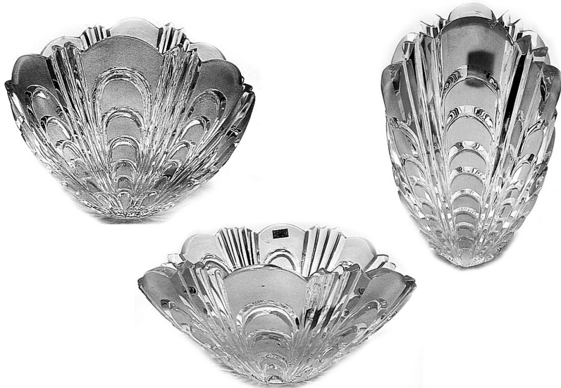
20. Набір для сервірування столу «Мушлі». 1988 р. КЗХС.