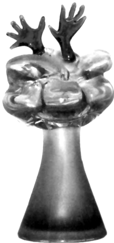
Рис. 22. Скульптурна композиція «Ні». 1983 р. КЗХС.

Рисами творчості С. Сміян є ансамблевість мислення та сміливість експериментів. Тому вона є однією із небагатьох майстрів, яким доручали виконання державних замовлень. Твори майстра прикрашали свята та ювілеї, їх як подарунки отримували іноземні гості. Також, художниця брала участь у створенні монументальних тематичних і декоративних композицій, таких як декоративний набір ваз «Золоті ворота» (1980) (рис. 21), скульптурна композиція «Ні» (1983) – робоча назва «Ні війні» (рис. 22). Ці роботи, також у 2014 р. були подаровані художницею НМІУ.