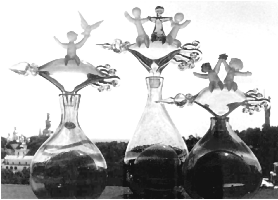
Рис. 14. Композиція з циклу «Космос».

Після експериментів із формотворенням художниця повернулася до традиційних форм. У наборі ваз з трьох предметів «Хвилі Дніпра» (1985) (рис. 15) продумана взаємодія кольорів від золотавого до ніжно-блакитного, які змінюються при кожному новому ракурсі. Автор використала прийом заливки, що дав змогу виявити можливості матеріалу, його оптичні ефекти – рух маси скла асоціюється із водою. Головним акцентом в оздобленні комплекту стало кольорове скло. За допомогою спеціальних пінцетів досягнуто ефекту прозорого рифлення. І якщо у більш ранніх творах наліпи були декоративною прикрасою, то в останніх роботах вони органічно поєдналися з об'ємами, доповнюючи виразність форми, створюючи цілісний образ.