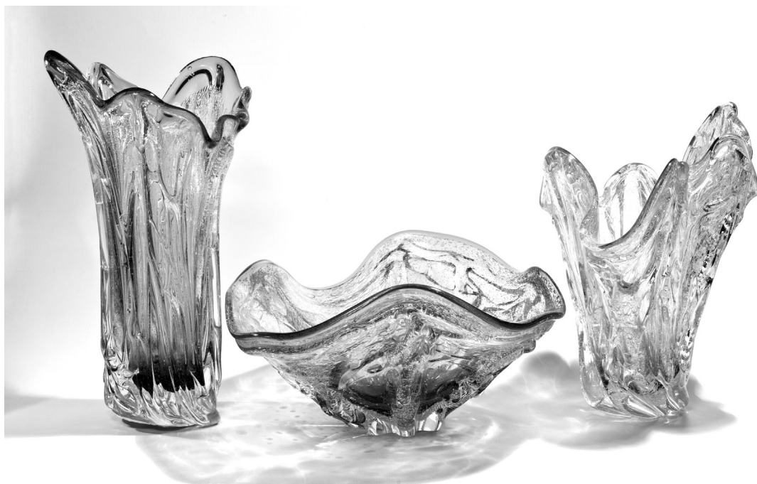
Рис. 18. Декоративний набір «Бузок». 1979 р. КЗХС.