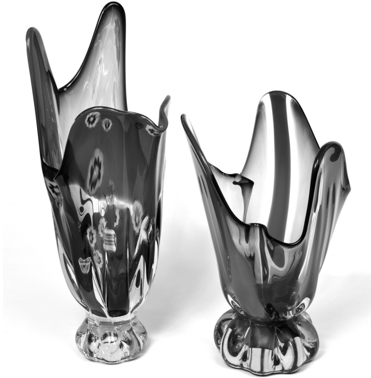
Рис. 6. Декоративний набір «Прапори». 1979 р. КЗХС.

Працюючи на заводі, С. Сміян вдосконалила та урізноманітнила техніку міллефіорі, поєднавши її з гутною технікою вплавлення у скляну масу кольорових хвилястих смуг та розріджених ниток. До цих робіт можна зарахувати: блюдо «Цвітіння» (1975) (рис. 5); декоративний набір «Прапори» (1979) (рис. 6); декоративний набір «Букет» (1980) (рис. 7); блюдо «Меандр» (1981), декоративна ваза «Місячна доріжка» (1981), «Рух» (1983) (рис. 8); декоративний набір «Сади цвітуть» (1989) (рис. 9) [2].