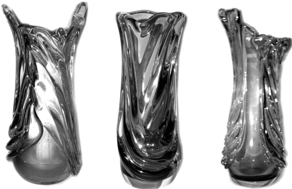
Рис. 15. Набір ваз «Хвилі Дніпра». 1985 р. КЗХС.

Після експериментів із формотворенням художниця повернулася до традиційних форм. У наборі ваз з трьох предметів «Хвилі Дніпра» (1985) (рис. 15) продумана взаємодія кольорів від золотавого до ніжно-блакитного, які змінюються при кожному новому ракурсі. Автор використала прийом заливки, що дав змогу виявити можливості матеріалу, його оптичні ефекти – рух маси скла асоціюється із водою. Головним акцентом в оздобленні комплекту стало кольорове скло. За допомогою спеціальних пінцетів досягнуто ефекту прозорого рифлення. І якщо у більш ранніх творах наліпи були декоративною прикрасою, то в останніх роботах вони органічно поєдналися з об'ємами, доповнюючи виразність форми, створюючи цілісний образ.