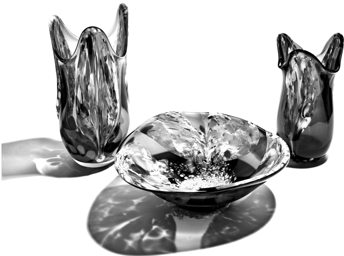
Рис. 9. Декоративний набір «Сади цвітуть». 1989 р. КЗХС.