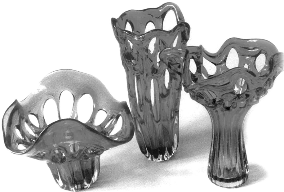
Рис. 3. Набір «Ажурний».