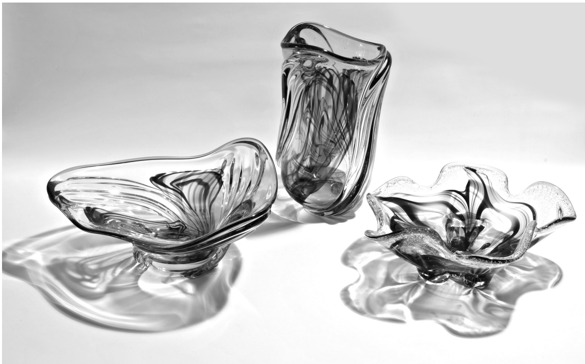
Рис. 8. Декоративний набір «Рух». 1983 р. КЗХС.