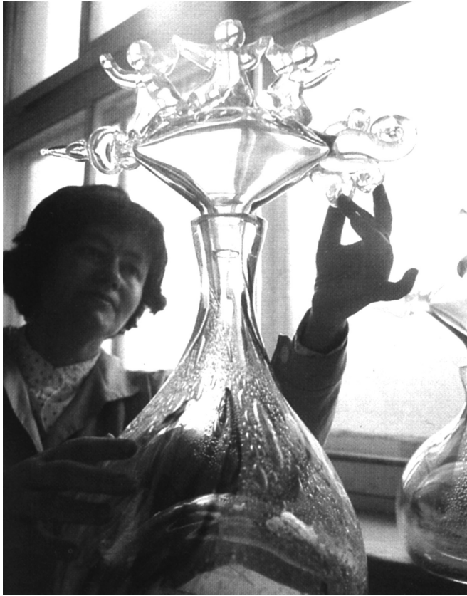
Рис. 12. Композиція «Міжнародний екіпаж». 1982 р. КЗХС.

У 1970-ті рр. художниця акцентувала увагу на створенні виробів з більш пластичними формами. Форми вільної гутної обробки стали більш скульптурними, динамічними та напруженими. Безмежні можливості формотворення привели С. Сміян не тільки до декоративних, а й філософських пошуків [7, 14]. У 1982 р. художницею були створені декоративні скульптурні композиції «Міжнародний екіпаж» та «Міжпланетний екіпаж» з циклу «Космос» (рис. 12, 13, 14) [5, 69]. У 2014 р. ескізи та композиції автором були передані в подарунок НМІУ.