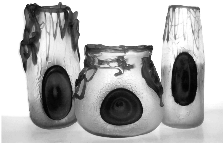
Рис. 21. Декоративні вази «Золоті ворота» 1980 р. КЗХС.