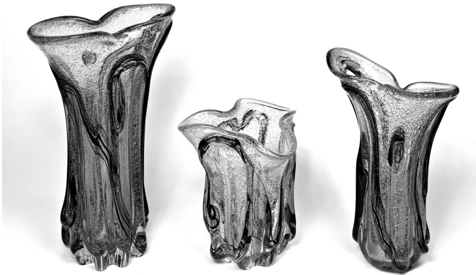
Рис. 19. Декоративний набір «Роздуми». 1980 р. КЗХС.