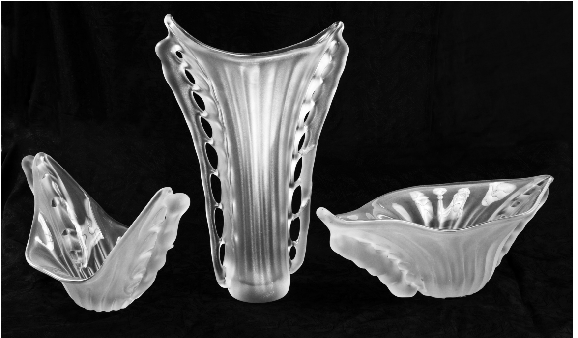
Рис. 10. Декоративний набір «Зимова казка». 1993 р. КЗХС.