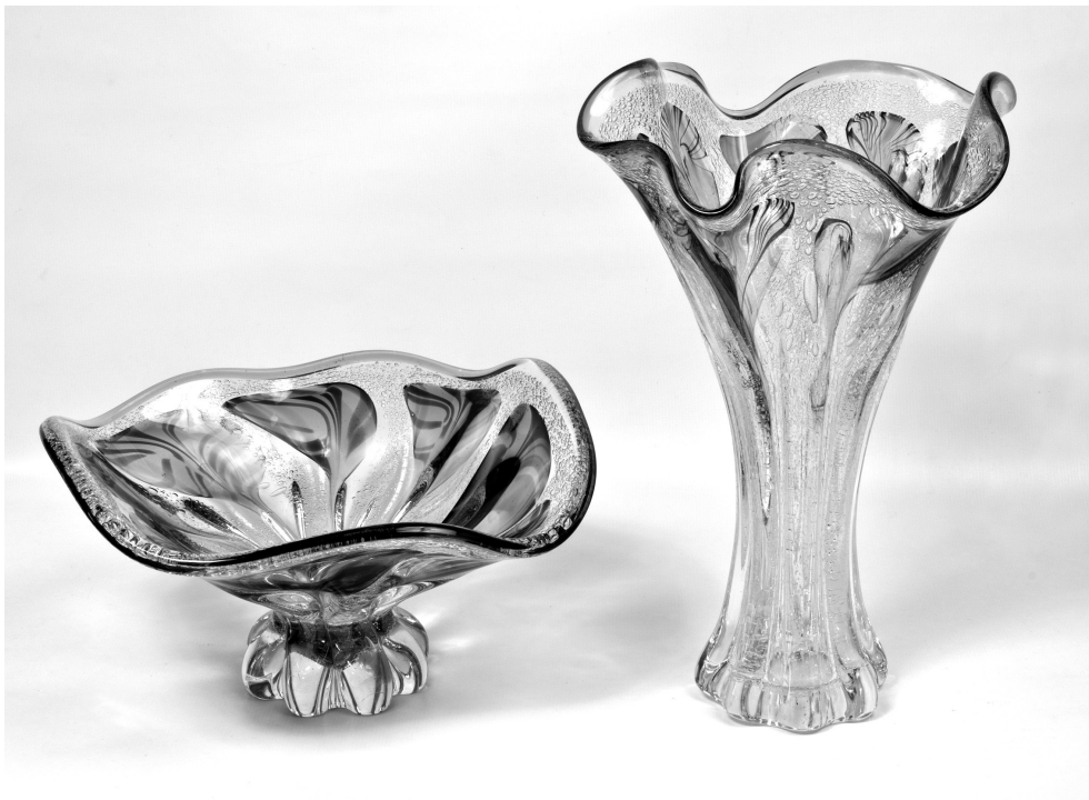
Рис. 4. Декоративний набір «Павич». 1979 р. КЗХС.