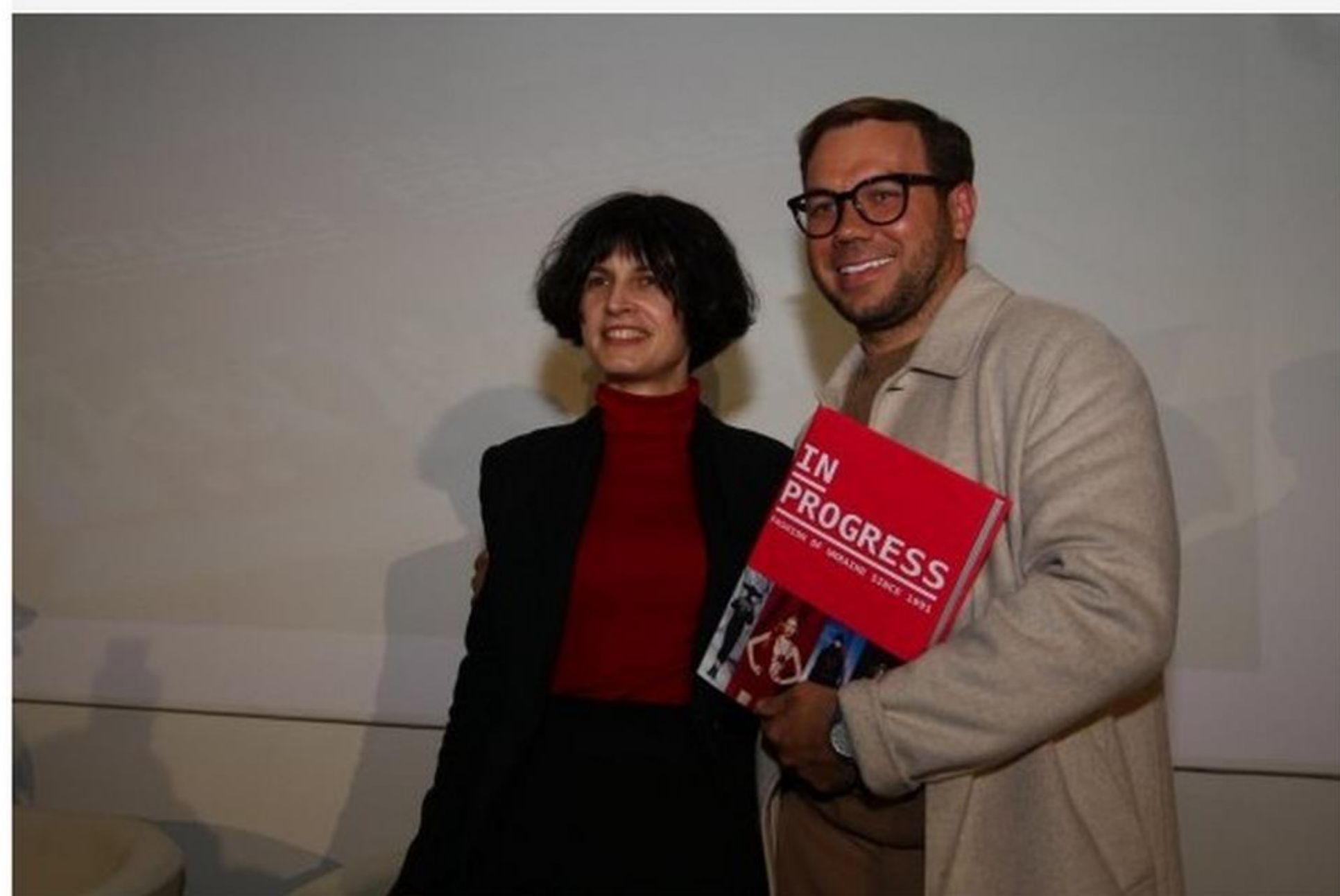
Вартість книги Звinyaцьківської 990 гривень

Жінка в коричневій шубі з сяючою брошкою та масивними червоними бусами п'є вино та розповідає колезі про свою дисертацію.