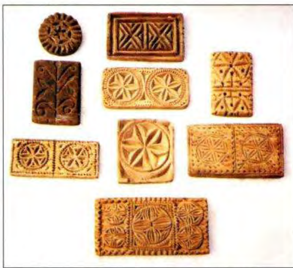
Пряничні дощечки.