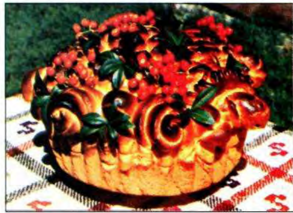
Весільні голуби з калиною і барвінком. С. Стіна Томашпільського р-ну Вінницької обл. 2000 р.