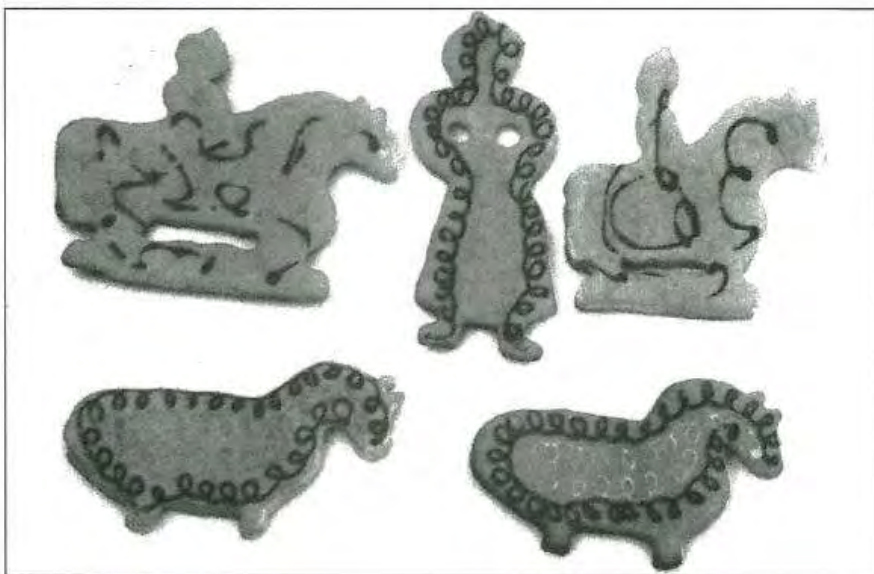
Полтавські праники. Фотоархів Л. Орел