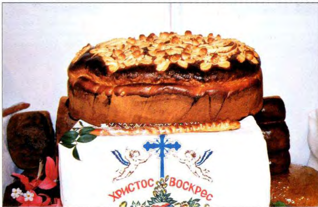
Паска. Черкаська обл. 2004 р.