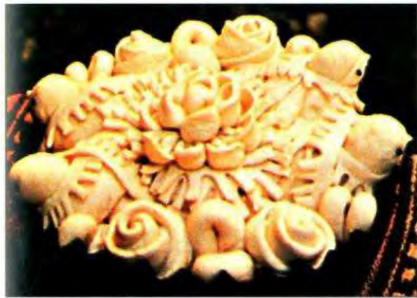
Весільні голуби (перед випіканням). С. Стіна Томашпільського р-ну Вінницької обл. 2000 р.