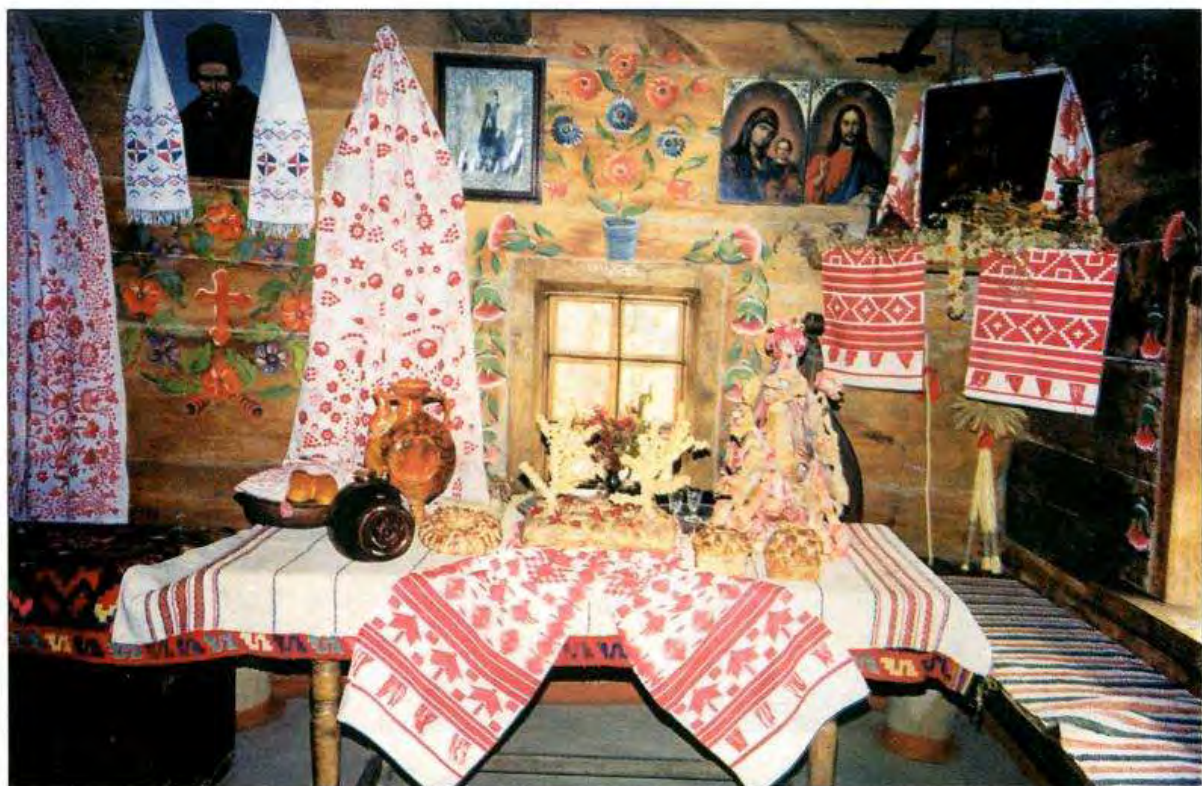
Весільний стіл в інтер'єрі мальованої хати з Полтавщини в ДМНАП НАНУ. Автор інтер'єру С. Щербань.