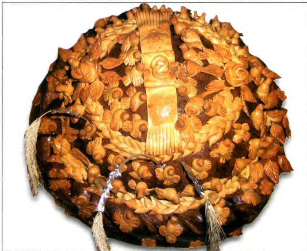
Весільний коровай. М. Кролевець Сумської обл. 2006 р.