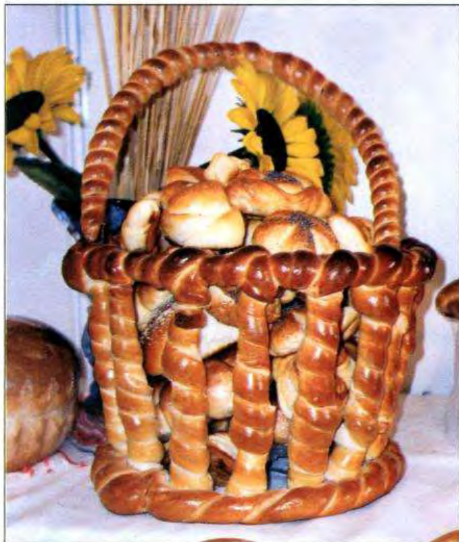
Великодні печиво. Черкаська обл. 2004 р.