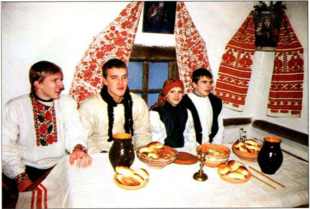
Вечорниці на Андрія. Фотоархів ДМНАП НАНУ