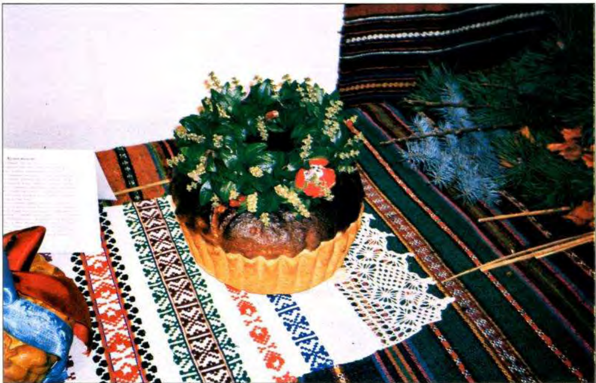
Калач молодого. 2004 р. С. Стіна Томашпільського р-ну Вінницької обл.