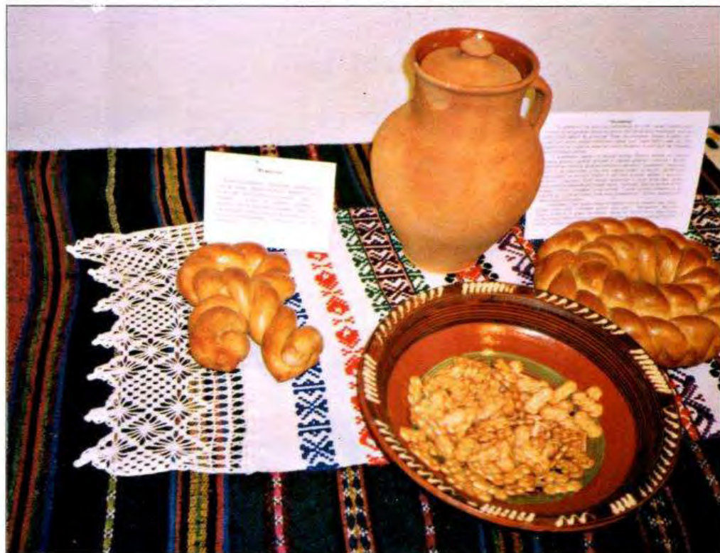
«Рожество». Різдвяна випічка. 2004 р. С. Стіна Томашпільського р-ну Вінницької обл.