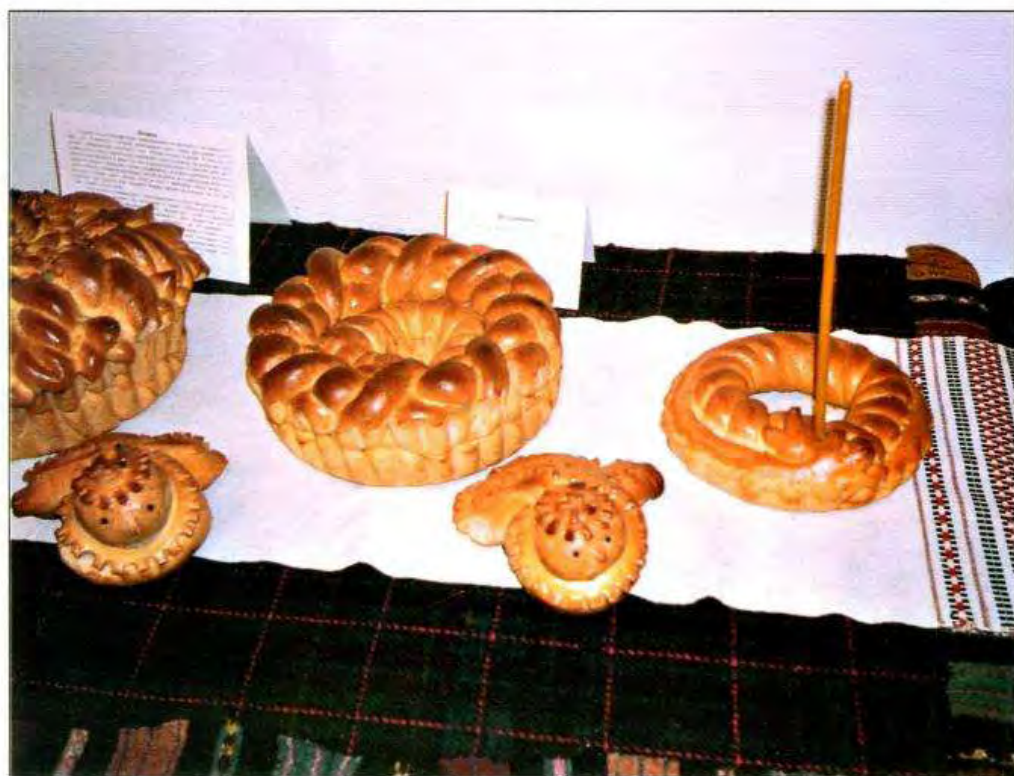
«Помана» поминальна випічка. 2004 р. С. Стіна Томашпільського р-ну Вінницької обл.