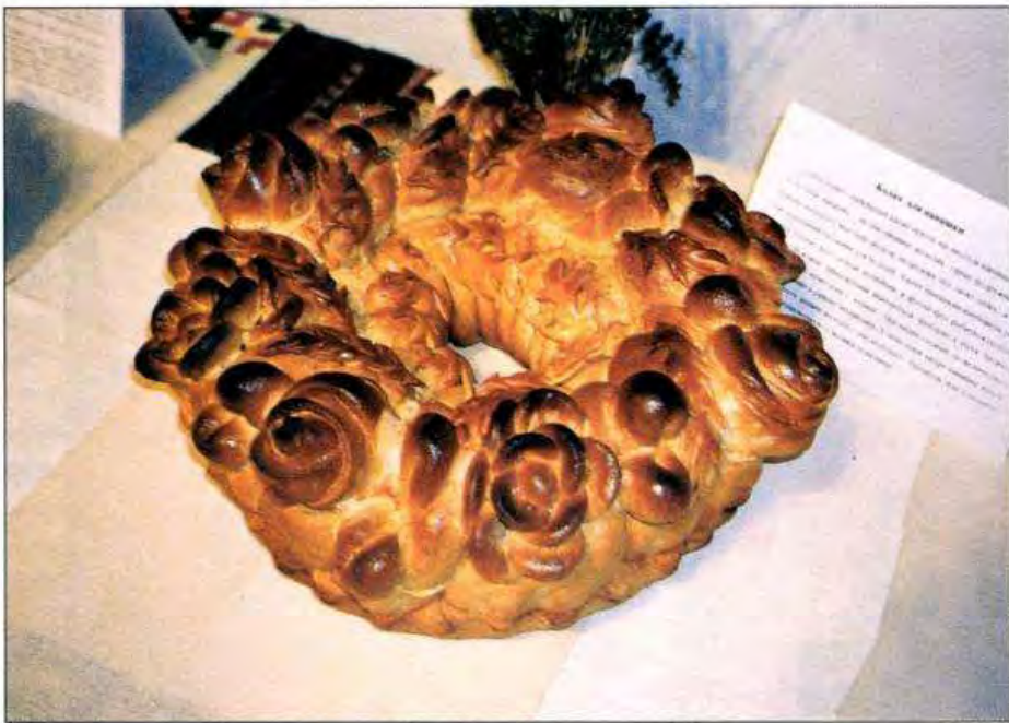
Весільний калач для нанашки (весільної матері). 2004 р. С. Стіна Томашпільського р-ну Вінницької обл.