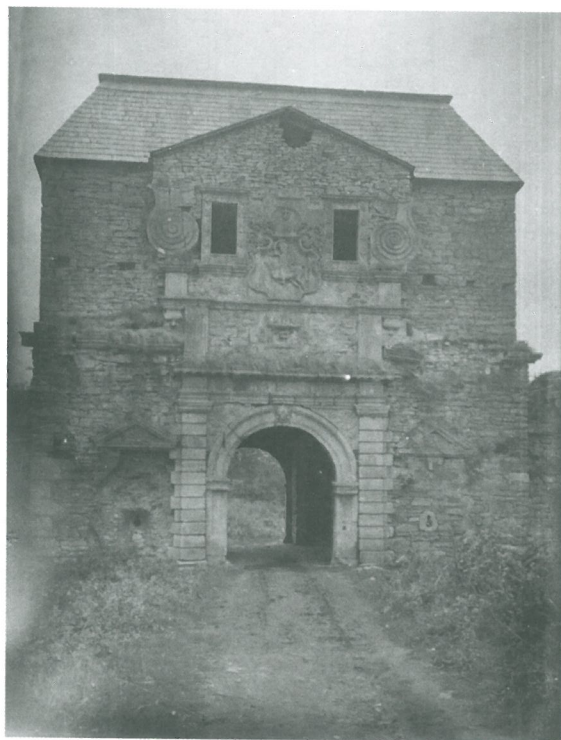
В'їзна вежа замку. 1921 р.

Вже під час реставраційних робіт, які проводила власниця замку, з'явилася цікава заява, написана у Львові 10 липня 1922 року