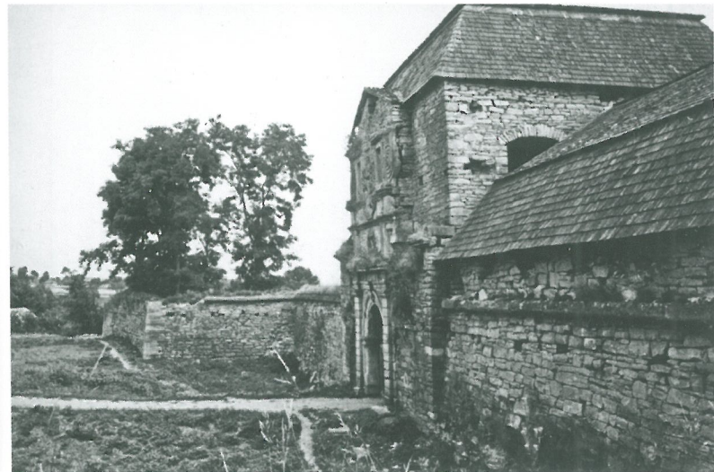
Загальний вигляд замку після реставрації. 1935 р.