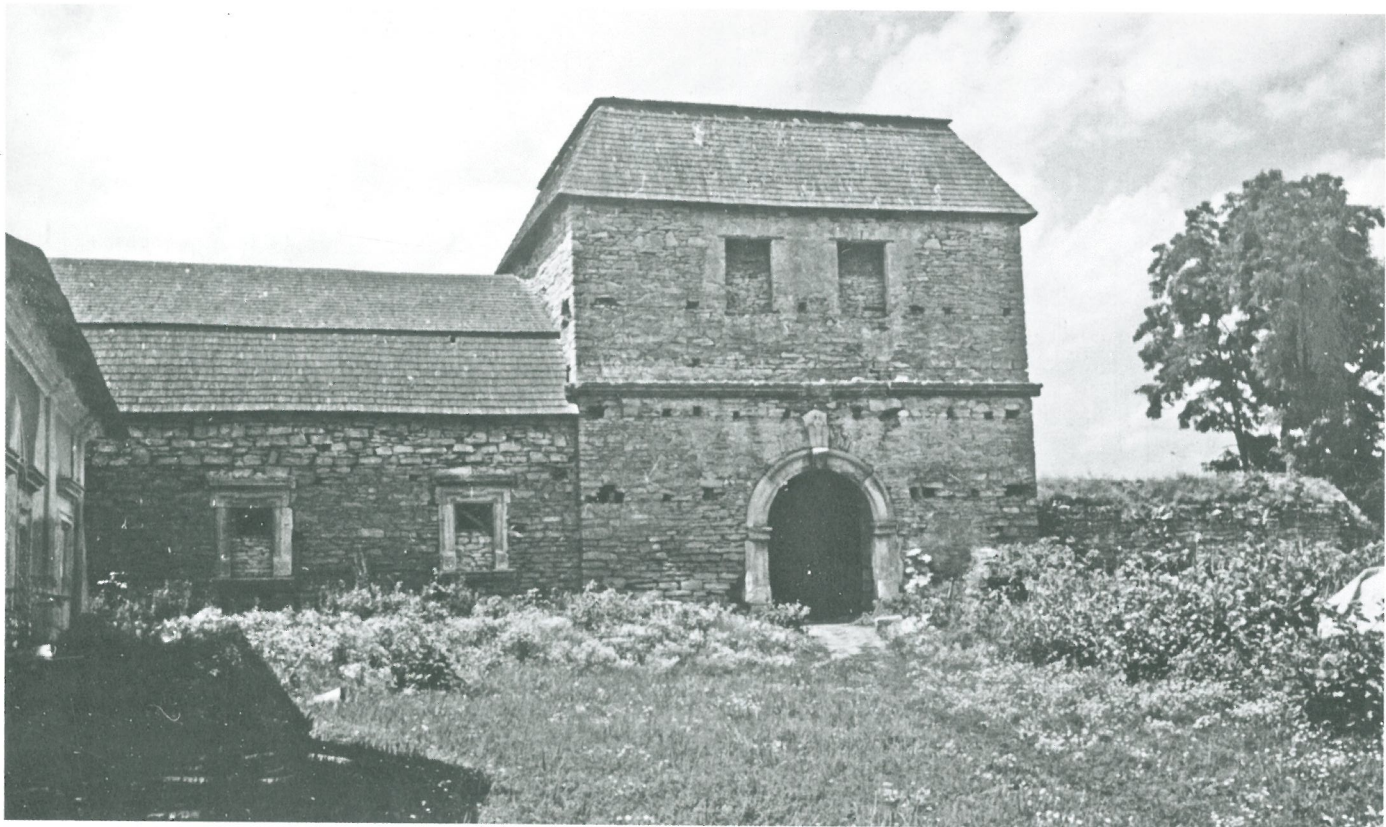
В'їзна вежа замку і фрагмент прибрамного корпусу. Вигляд із замкового подвір'я.