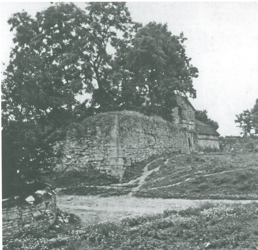
Північно-західний бастіон замку.