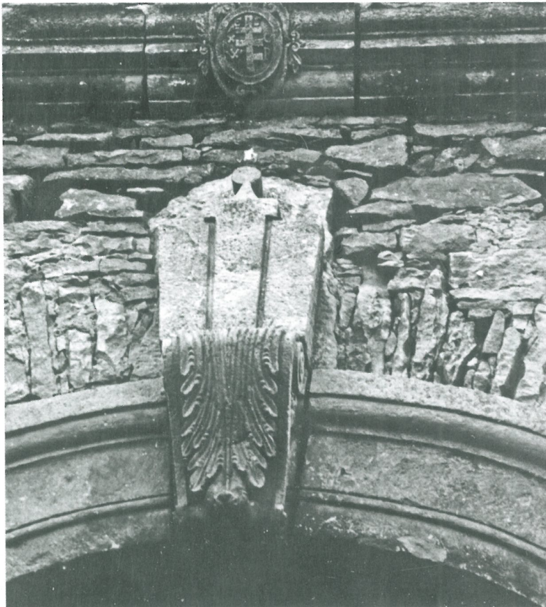
Герб Пілава на в'їзній вежі замку, вигляд із замкового подвір'я. 1935 р.