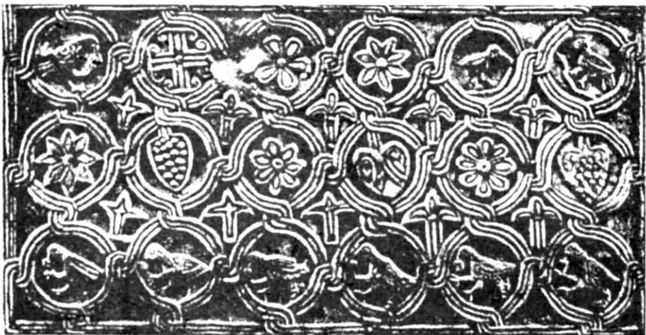
Рис. 3. Мармурова плита вітрової огорожі IX – X ст. з Риму.

Таким чином, орнаментальна композиція цієї плити будується за принципом вписування одних елементів в інші, що органічно з'єднуються стрічкою безперервного плетіння, а загалом її декор типологічно примикає до групи аналогічних шиферних плит з київського Софійського собору, чернігівського Спасо-Преображенського, де вони прикрашають парапети хорів, плити віка шиферного саркофага з Десятинної церкви та ряду інших, знайдених в різні часи на території Києва, які зберігаються нині в лапідарії Софії Київської.