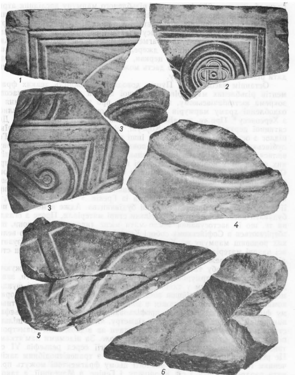
Рис. 1. Фрагменти різьбленого мармуру з розкопок Десятинної церкви у Києві: 1, 2 — фрагмент плити вівтарної огорожі з розкопок Д. В. Мілєєва 1908 р.; 3, 4 — фрагменти різьбленої плити з розкопок М. К. Каргера 1939 р.; 5, 6 — фрагмент фронтальної частини віка мармурового саркофага (яма № 6, розкопки М. К. Каргера). Лівий бік, зовні й зсередини.

ного використання 14 . Проте на другому боці фрагмента (рис. 1, 2) бачимо композицію іншого типу. Тут збереглося більше половини рельєфного кола меншого діаметру, створеного широкою випуклою стрічкою, що має по краях вузькі кромки з глибоким рельєфом. У нього вписана чотирипелюсткова розетка з квадратом та маленьким колом усередині. Коло щільно примикає до рамки, яка обмежує композицію. З боку зламу рельєф читається гірше, але досить, щоб побачити тут зображення лаврового вінка, в який звичайно вміщували хрест або монограму Христа — хризму. Тобто, можна припустити, що з цього боку плита мала симетричну композицію, головна схема якої повторює типи, що широко репрезентовані у візантійському мистецтві. По-