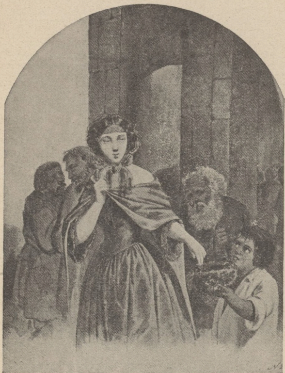
Д. Безперчий. Милостиня.