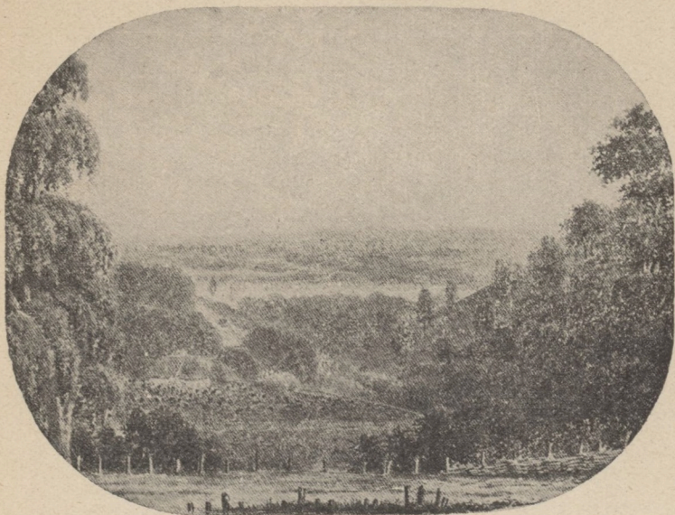
Д. Безперчий. Над Донцем за Чугуївом.