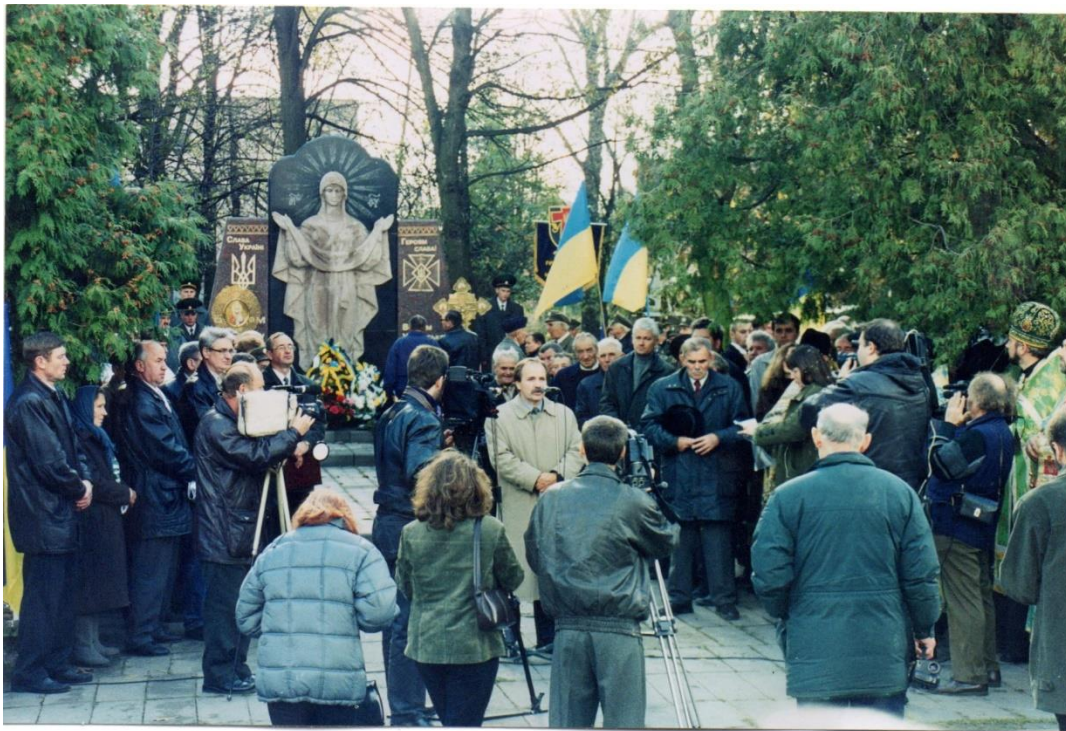
Відкриття меморіалу «Борцям за Самостійну Соборну Державу» в Любомлі. Фото 16 жовтня 2003 р. ЛКМ. КДФ-3588/КН-14407

16 жовтня 2002 р. в Любомлі відкрили меморіал «Борцям за Самостійну Соборну Державу». Поряд із трьома плитами списку «членів ОУН-УПА, які боролись за волю України», на четвертій зобразили портрет Сергія Богдана [37].