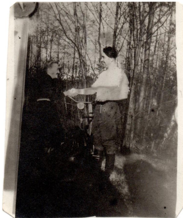
«Биков» з велосипедом, вітається з незнайомкою. ЛКМ. КДФ. 233/3166.

У квітні 1947 р. «Биков» отримав підозрілого листа від «Гомона». У них невідома особа представлялася впливовим провідником ОУН, який відновлював лінію зв'язку між Галичиною та Волинню. Просив надіслати йому радіоприймач, друкарські машинки, медикаменти та хірургічні інструменти. Вимагав передати здобуті радянські документи, оунівські звіти, а також фіктивні паспорти для легалізації втікачів з заслання. Після цього «Биков» доручив есбістам його перевірити. Невдовзі було встановлено, що підпіллю лист передав хлопець з с. Підгородне, а той у свою чергу його отримав від односельчанина – студента Володимир-Волинської педшколи. Вивчивши документ, есбісти дійшли висновку, що його написали співробітники МДБ з метою провокації [22, арк. 78-80].