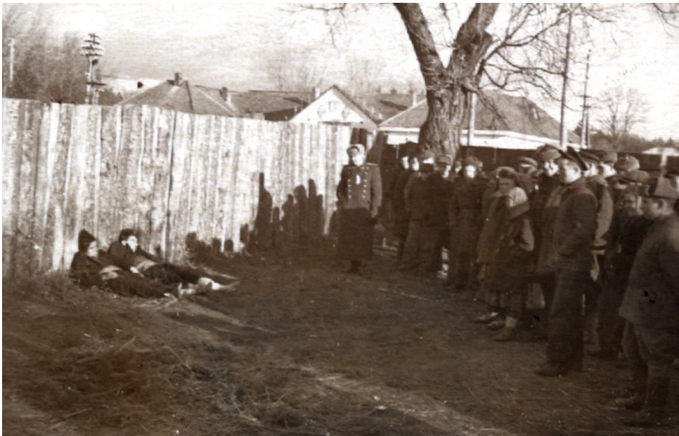
Упізнання вбитих оунівців.