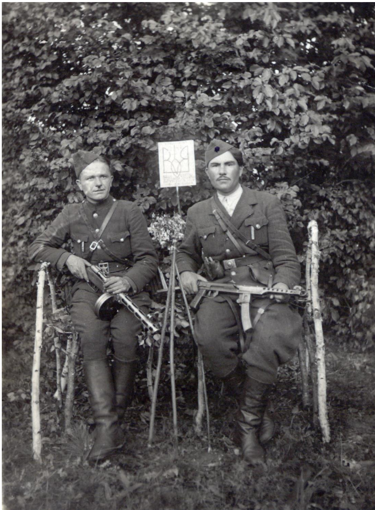
Справа «Биков». На звороті текст: «Друзі, які вже шостий рік в боротьбі з імперіалістами, спочатку з німецько-польсько-більшовицькими загарбниками, які зазіхають аж досьгодні на Українську землю, але ми націоналісти-революціонери безпошадні до всіх ворогів України. Ми тверді як сталь, ми непохитні як граніт. Дня 5.6.1948 року. Слава Україні! Героям Слава!» ЛКМ. КДФ. 1567/10019.