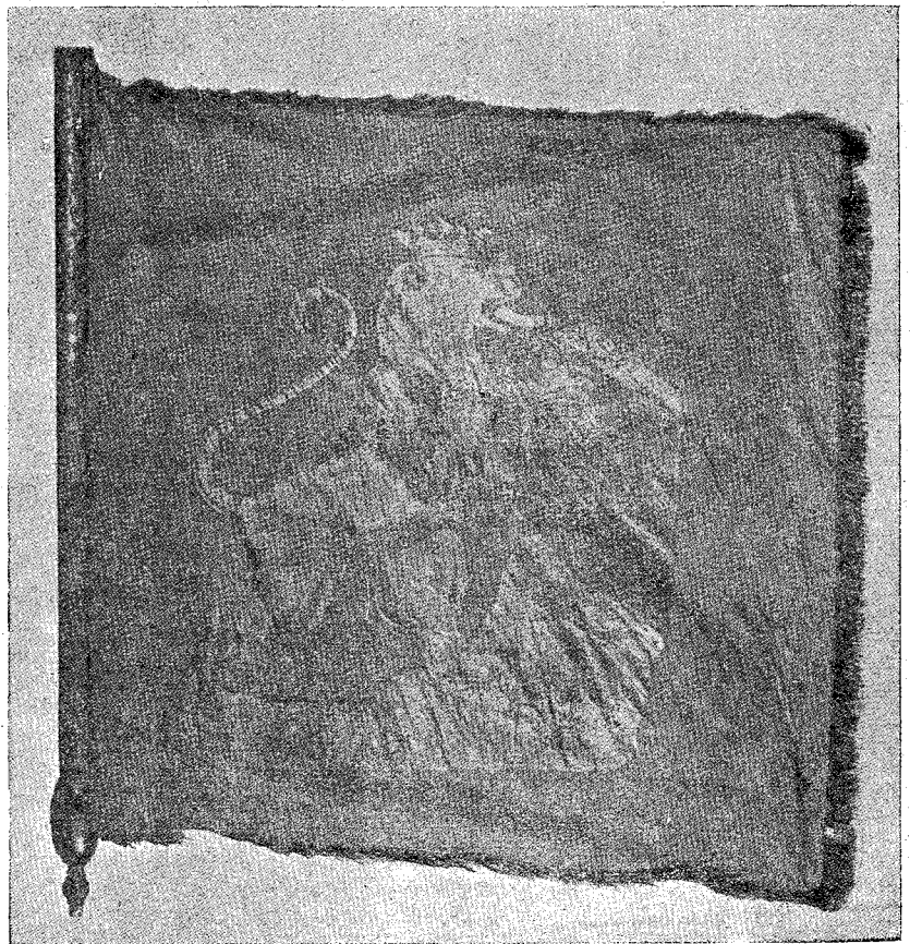
Прапор національної гвардії в Яворові.