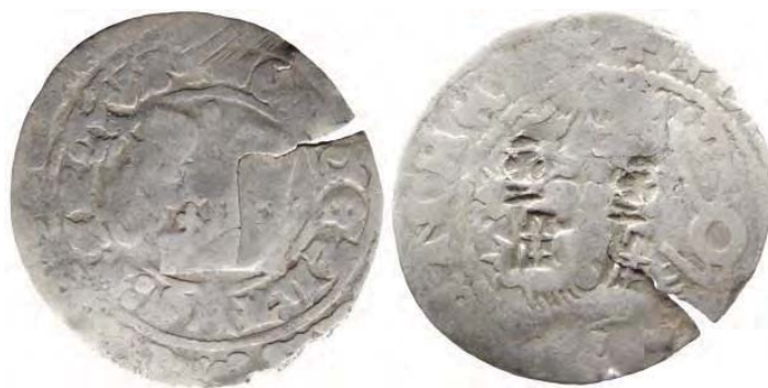
Рис. 5. Богемія, Вацлав IV, грош з подвійною контрамаркою німецького м. Зост

Монети з кількома надкарбуваннями. Навесні 2010 р. на розораному узбережжі річки поблизу с. Курники Вінницької обл. знайшли скарб празьких грошей з одним контрамаркованим примірником. До складу давнього депозиту входило 15 цілих монет та 7 уламків. Усі надані монети можна визначити як празькі гроші, карбовані в Богемії від імені короля Вацлава IV у першій половині XV ст. Серед монет та їх уламків особливий інтерес викликає гріш Вацлава IV із двома контрмарками на реверсі (рис. 5). Два надкарбування у вигляді ключа відносяться до контрмарок німецького м. Зост (нім. Soest) 144 . Такі контрамарки м. Зост використовувалися для підтвердження якості та повної ваги празьких грошей. Відомо 7 типів таких надкарбувань, які відрізняються стилем ключа.