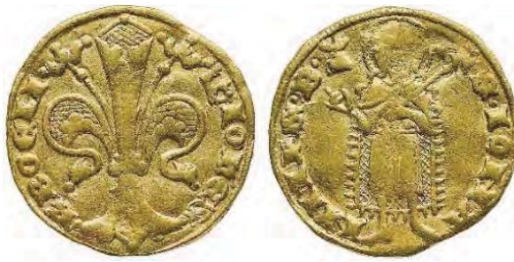
Рис. 3. Богемія, Ян I Люксембурзький (1310–1346), флорин (голдгульден), м. д. Куттенберг. Вага – 3,5 г. 46 Легенда аверсу: IONES R BOEM

У Чехії король Карл носив ім'я Карл I, а в сані імператора священної Римської імперії він був Карлом IV. У пору правління Карла I марка мала 14 лотів срібла, з якої карбувались уже 70 грошів, що спричинило падіння ваги монети до 3,16 г, діаметру – до 27 мм 47 .