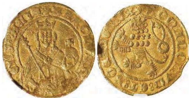
Рис. 4. Богемія, Карл I (1346–1378), голдгульден б/д, м. д. Куттенберг 52

празьких грошів, тобто традиційних празьких грошів, додатково покритих поверхневим шаром золота через намагання видати срібну монету за золоту. Але варто бути свідомими того, що можливість такої події хоча й існує та має аналоги в історії грошового обігу 51 , проте вона виглядає мало ймовірною через рідкісність богемського золотого голдгульдена.