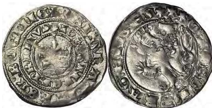
Рис. 2. Богемія, Ян I Люксембурзький (1310–1346), грош, м. д. Кутна Гора 45

За часів короля Яна I Люксембурзького карбування празьких грошів було відновлено за зразком монет Вацлава II, їх середня вага коливалась у межах 3,5–3,678 г, діаметр – 28 мм (рис. 2). Також у Кутній Горі на цю пору відновилося карбування золотої монети – флорину. Прикметно, що потрапляння золотих богемських монет на територію України дослідниками частіше розглядається в контексті обслуговування міжнародної торгівлі вищою ланкою грошового обігу – золотою монетою – цехіном, флорином, а згодом і дукатом. Вважаємо, що в дослідженні обігу празького гроша необхідно звернути більш ретельну увагу на знахідки чеських монет у комплексі із золотими європейськими монетами.