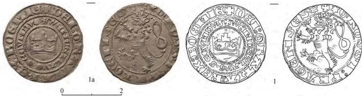
Рис. 1. Богемія, Вацлав II, грош. Вага – 3,16 г, діаметр – 2,63/2,7 мм.

Знайдено в Королівському замку Нялаб, Закарпаття