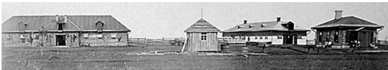
Фото 3. Маєток «Затишшя». Стаїні. 1902 рік