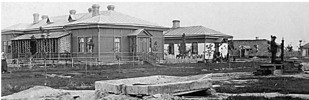
Фото 2. Маєток «Затишшя». Будинок завідувача маєтком. 1902 рік